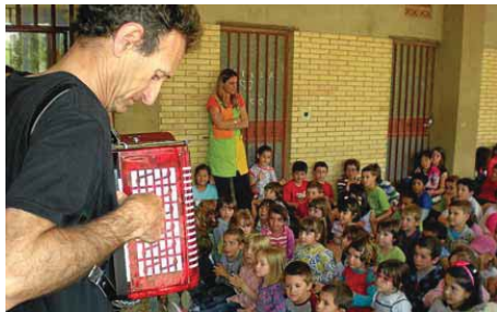
■ Actividad sobre instrumentos tradicionales con A Chamiera, en Ayerbe.

Superado el momento inicial de la sorpresa -algunos exclamaban: ¡'Y esto... de dónde es!, mientras otros respondían: «Es catalán», ¡no, no, aquí solo se habla castellano!-, los alumnos del Cándido Do-