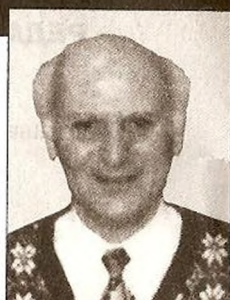
Амонашвили Шалва Александрович Учитель, Почетный член Р.А.О, г. Москва