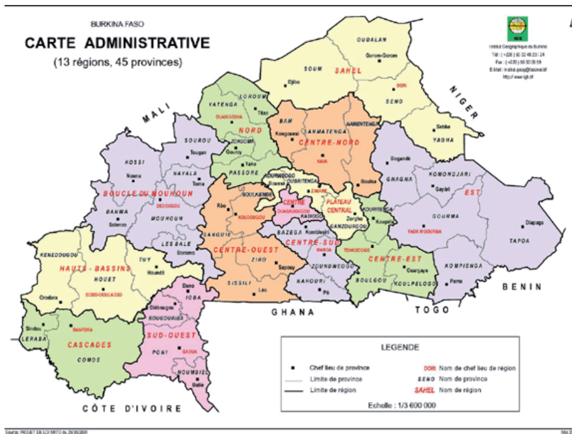
Tableau 1: Subdivisions administratives : Liste des régions, des provinces et des communes urbaines et rurales en 2016

Carte administrative, Régions, Provinces et chefs lieux de province