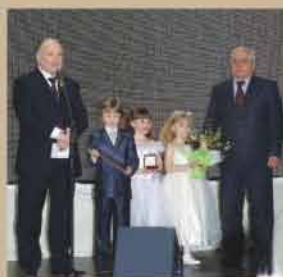
Н.Н. Губенко и В.А. Садовничий