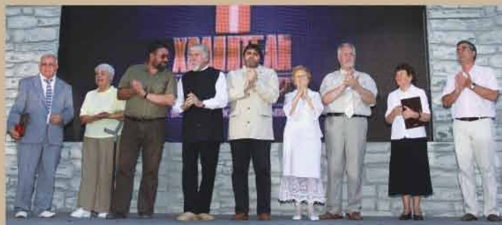
Лауреаты премии «Хранители наследия – 2010»