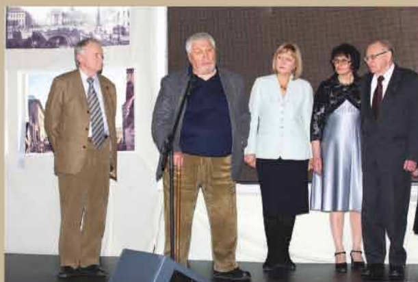
Лауреаты премии «Хранители наследия – 2009»