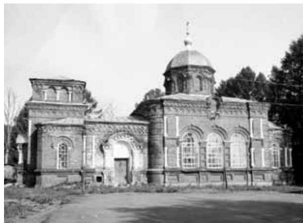
Церковь Николая Чудотворца, 1914-1917 гг. (Костромской р-н, с. Чернопенье)