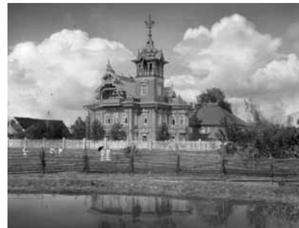
Терем, начало XX века

В 1942 году положение поменялось, и в Терем въехали правление совхоза, медпункт, клуб, почта, библиотека — всем нашлось место. Не смогли, правда, справиться с мудрёным печным отоплением. Сазонов в свое время заказал себе печки по финским каталогам. Говорили, что дымоходы были сложены так затейливо, что дым над крышей появлялся спустя 4 часа после того, как печи бывали затоплены. Все это пришло в негодность к сороковым годам,