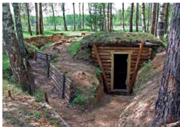
Блиндаж и окоп на переднем крае обороны советских войск («Павловский плацдарм»)

грамотами различных ведомств, медалями «60 лет Победы», «Патриот России», «В память о народном ополчении». В 2010 году ему присвоено звание «Заслуженный эколог Российской Федерации».