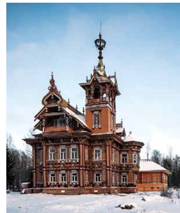
Терем, 2016 год

ские технологии и материалы: тёсанные бревна, дранки, войлок, бересту. Одновременно с реставрацией была проделана работа по созданию в брошенной деревне инфраструктуры. Проведена дорога, вода, электричество. Расчищены старые пруды. При поддержке программы благотворительного фонда Владимира Потанина «Меняющийся Музей в Меняющемся Мире» начались работы по созданию музея личных историй «Асташово и окрестности».