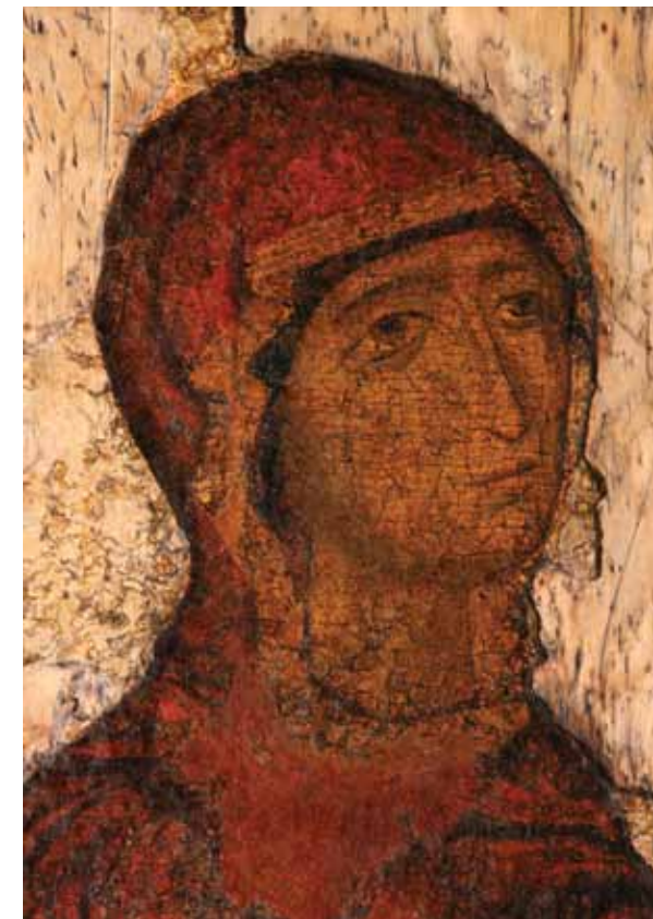
Икона «Богоматерь Боголюбская». Фрагмент. После реставрации. 2016.

Наличие фрагментов авторской живописи было зафиксировано еще в ходе реставрационных работ 1970-х годов, но доступные тогда средства не позволили довести работу до конца. Новые технологии, новые возможности позволили, по сути дела, завершить тот процесс, который вели несколько поколений реставраторов мастерских, организованных Игорем Грабарем, а затем реставрационного центра его имени, подытожить этот труд