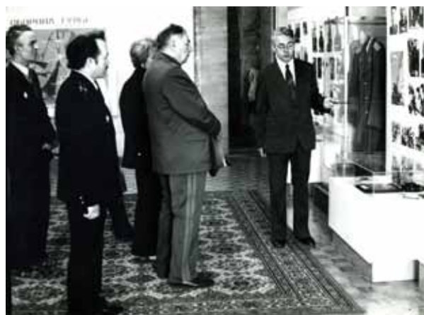
Экскурсия по выставке «Героическая оборона Тулы». В центре – трижды Герой Советского Союза маршал авиации А. И. Покрышкин. Экскурсию ведет В. И. Боть. (1982 г.)

большие работы по организации историко-архитектурного комплекса «Тульский кремль», а также появилась целая сеть районных краеведческих музеев.