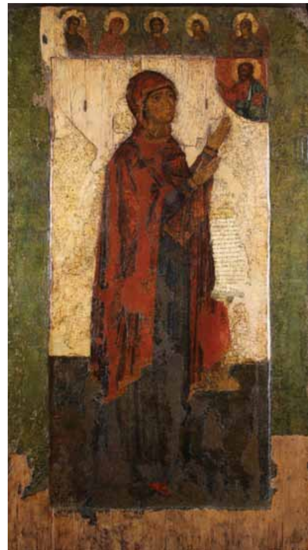
Икона «Богоматерь Боголюбская». Общий вид. После реставрации. 2016.

В результате комплексного исследования, включавшего, помимо традиционных методов — высокоточное 3D-сканирование и компьютерную томографию, и по ходу проведения антиаварийных работ выяснилось, что для укрепления живописи