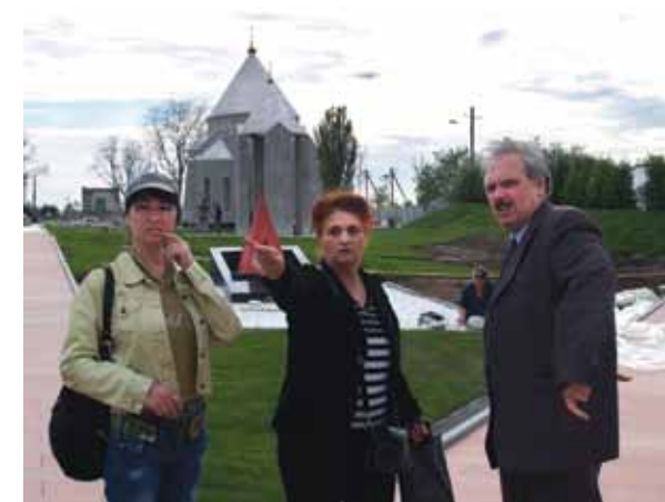
Сооружение мемориала в бывшем совхозе Красный

Принял активное участие в создании мемориала на месте концентрационного лагеря в бывшем совхозе «Красный» на территории Симферопольского района (2014-2015 гг.).