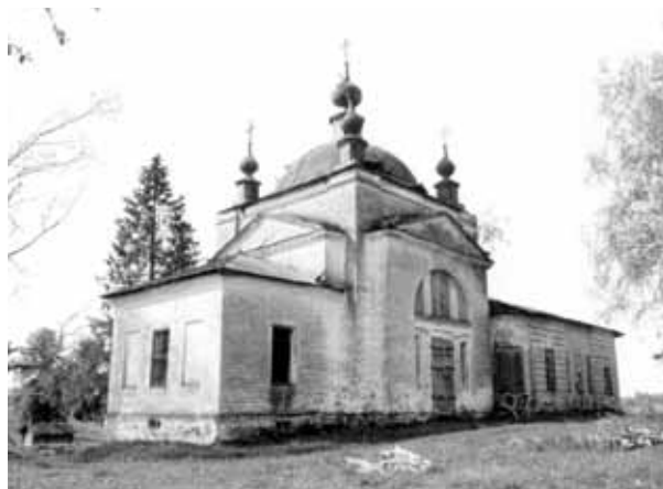
Церковь Успения, 1838 г. (Чухломский р-н, быв. с. Турдиево)

и библиографические источники, выявленные авторами в центральных и местных архивах, музеях, библиотеках. Параллельно этому обследованию в течение 10 лет совместно со специалистами в области садово-паркового искусства, архитекторами, историками и архивистами проводилось комплексные работы по выявлению,