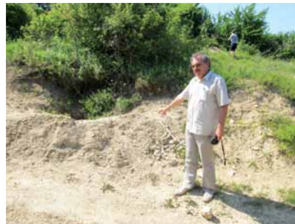
На месте грабительских раскопок некрополя у с. Опушки Симферопольского района

После принятия Республики Крым в состав Российской Федерации непосредственно участвовал в создании органа государственной власти Республики Крым в области сохранения, использования, популяризации и государственной охраны объектов культурного наследия (Государственного комитета по охране культурного наследия Республики Крым) и правовой базы для осуществления деятельности в указанной сфере. Является одним из разработчиков Закона Республики Крым «Об объектах культурного наследия в Республике Крым» (2014) и ряда других нормативных правовых актов по вопросам охраны культурного наследия в Республике Крым.