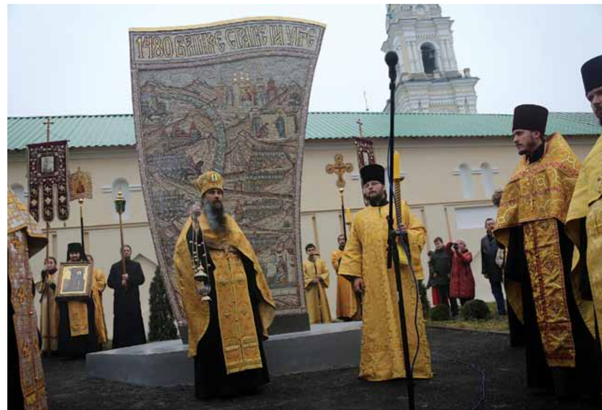
Праздник у стелы Свято-Тихонова монастыря

демонстрируют экскурсионные тропы создаваемого ландшафтного военно-мемориального музея «Угра-фронт»: плацдармы Красной Армии, полевой аэродром, рокадная дорога, командный пункт Западного фронта. Деятельность парка отмечена Почетным знаком военного историко-культурного