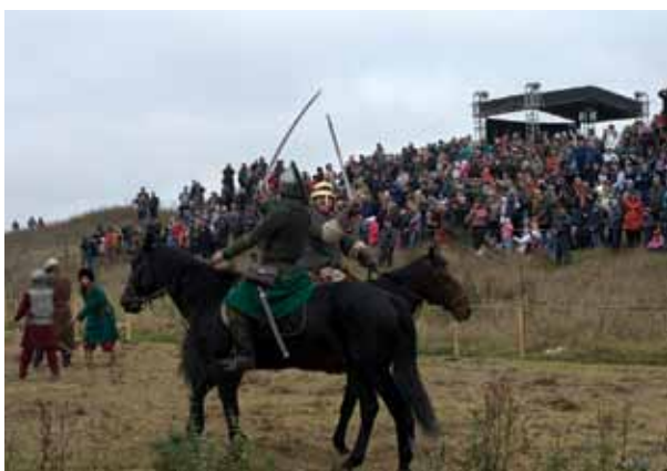
На Дне памяти Великого стояния на Угре 1480 года