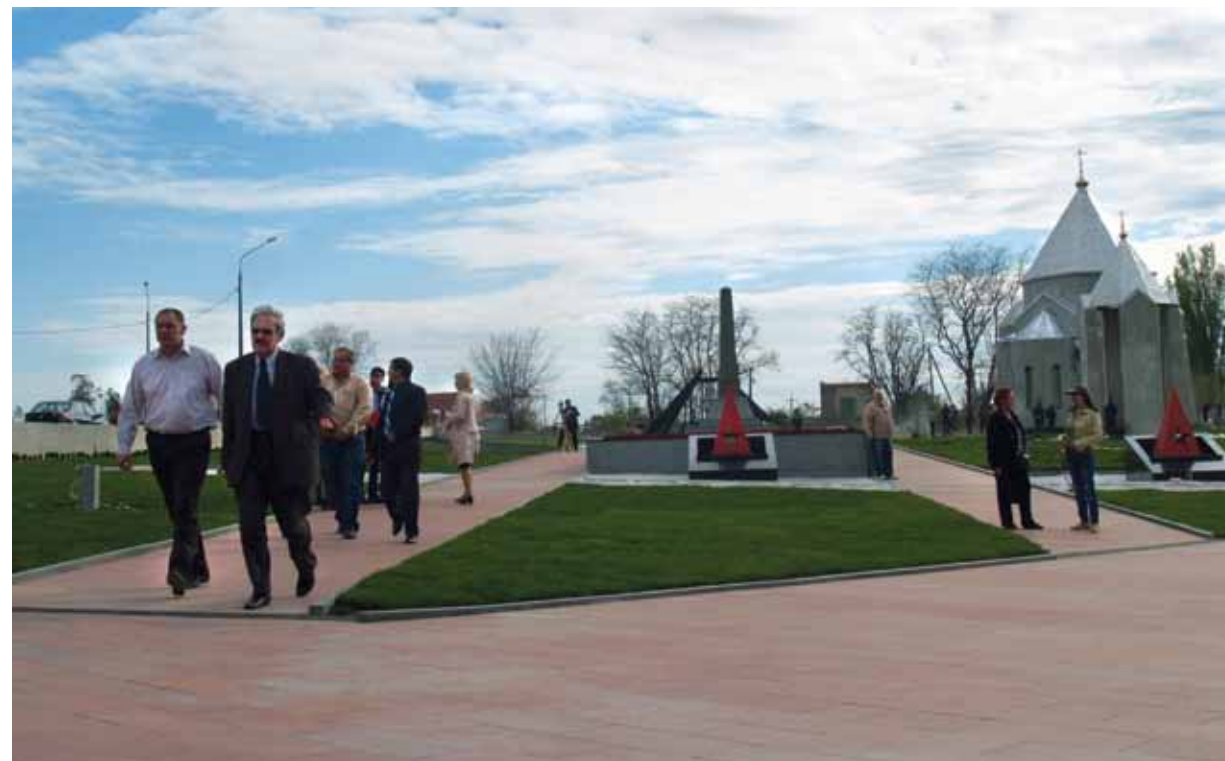
Мемориал в совхозе Красный

Лауреат премии Автономной Республики Крым (1998), премии Совета министров Автономной Республики Крым (2000). Магистр государственного