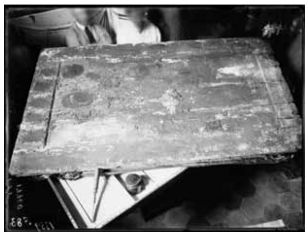
Икона «Богоматерь Боголюбская». После снятия оклада. 1918.

Вплоть до революции икона хранилась в Боголюбском монастыре. В 1918 году ее исследовала Комиссия по сохранению и реставрации древней живописи под руководством знаменитого искусствоведа Игоря Грабаря. По его словам, когда икона была освобождена от оклада, «глазам открылась картина ужасного разрушения: изъеденная древесным червем... доска большею частью обнажилась от левкаса и истлевшего холста и местами представляла собой труху, сыпавшуюся при малейшем прикосновении, на доске была найдена и живая личинка червя...» Тогда на месте утрат