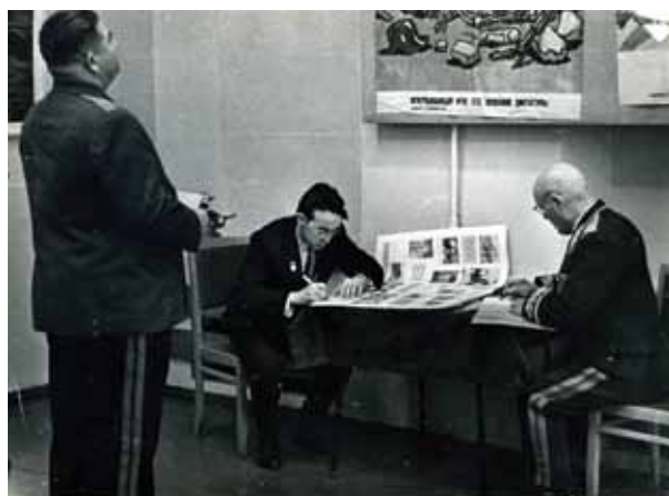
Встреча с Маршалом Советского Союза Ф. И. Голиковым и генералом армии А. Л. Гетманом в музее (декабрь 1966 г.)