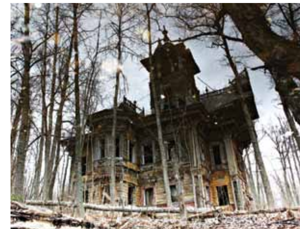
Терем, 2008 год

Восстановление терема началось в 2011 году и стало одним из самых сложных проектов в области деревянной реставрации в России. Терем был разобран, затем собран обратно с заменой 40% сгнивших брёвен. Изготовлены несколько тысяч деталей резьбы на замену утраченным. Восстановление некоторых элементов декора потребовало исследования старых фотографий, чертежей, следов, оставленных утерянными элементами резьбы на брёвнах сруба. Использовали историче-