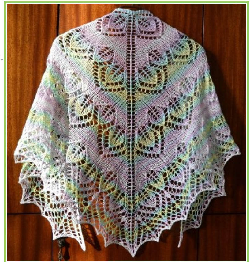
Шаль связана и сфотографирована Ю. Захлебиной

Образец: воспользуйтесь схемой В , свяжите пару раппортов в высоту без учета расширения шали, намочите и заблокируйте. Готовый образец используйте для расчета размеров шали.