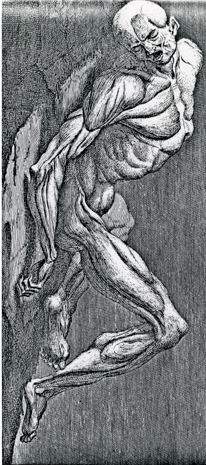
Cowper, William, 1666-1709. [Myotomia reformata] : [or an anatomical treatise on the muscles of the human body. To which is prefixed an introduction concerning muscular motion]. 1724