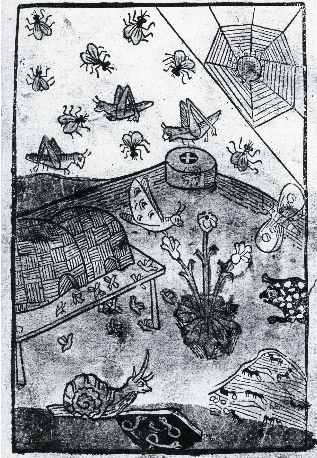
Konrad, von Megenberg, 1309-1374. Buch der Natur . 1482