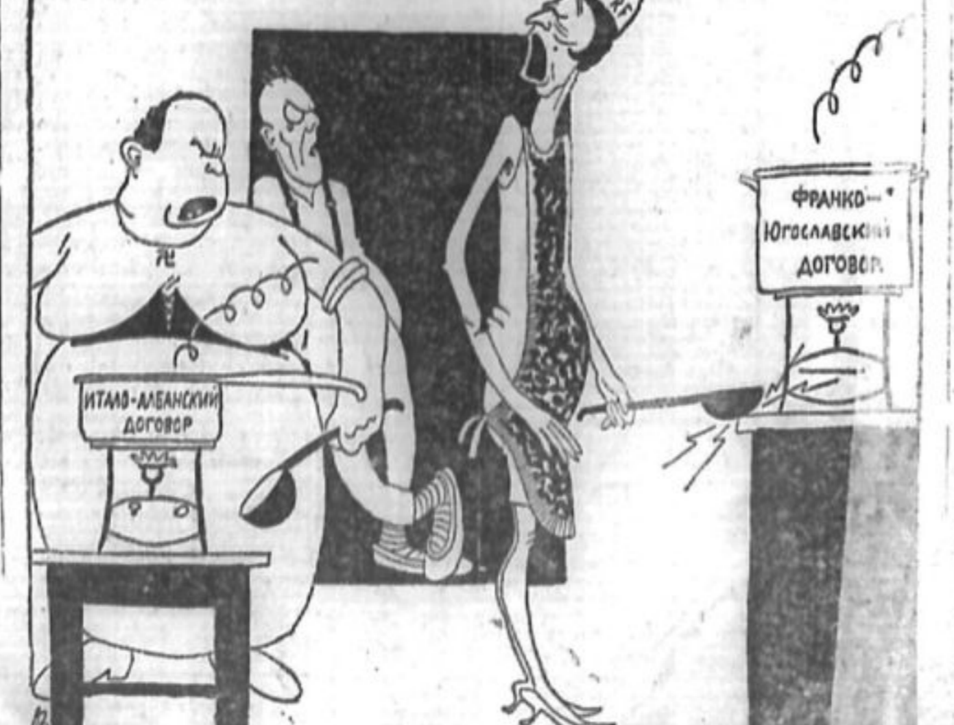
Средней силой можно ответить на смущения