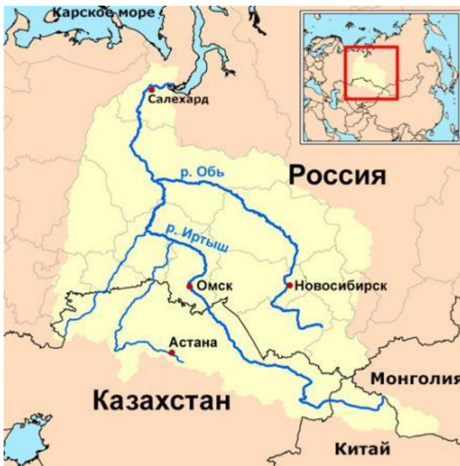
Рис. 1. Реки Обь, Иртыш, Ишим и Тобол

А теперь посмотрим туда, куда следует. В книге Бытие сказано (Быт. 2:8) и повторено (Быт. 3:24), что Едем – на востоке. В свою очередь данные ДНК-генеалогии указывают, что синдо-арийский (R1a) род возник в Южной Сибири. Именно там можно увидеть (см. карту на рис. 1) картину, схожую с библейским описанием райских рек. Мы знаем эти реки, как Обь, Иртыш, Ишим и Тобол. Древняя синдо-арийская этимология указанных русских гидронимов была раскрыта мною ранее (Афанасьев 2017: 166-171).