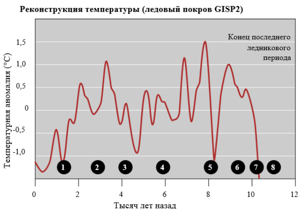
Рис. 3. Динамика температуры в голоцене

К концу VIII тыс. до н.э. эпохальное потепление достигло максимума (см. рис. 3: на графике палеотемператур указанный максимум обозначен цифрой 6) и закончилось таянием ледников на Севере со стоком холодной воды в Атлантику, что привело уже к двухвековому похолоданию в конце VII тыс. до н.э. (на графике указанная аномалия обозначена цифрой 5). По этой причине палеоклиматологи спорят, отсчитывать ли атлантический период со второй половины VIII тыс. до н.э. либо от 6000 гг. до н.э., когда закончилось похолодание. Но ведь аномальное похолодание произошло из-за таяния ледников при глобальном потеплении и может быть правильно понято только в этом контексте!