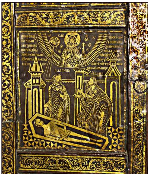
Рис. 4. Спор Аполлона с Платоном

Вместе с тем, в иконографии Керносовского изваяния можно распознать сокровенную символику летнего солнцестояния в астральном «доме» Близнецов. Но такое солнцестояние наблюдалось совсем не в эру Тельца, а в эру Рыб, начало которой отстояло от времени создания Керносовского идола не меньше чем на два с половиной тысячелетия! Таким образом, волхвы Древности предсказывали и готовили приход золотого века, когда солнце в зените будет освещать вселенную из астрального «дома» Близнецов – предвечных патронов синдо-арийского жречества. Ожидание небесного царства Близнецов отразилось также в обрядовом обычае древних греков приглашать Диоскуров к богато убранным столам во время летнего солнцестояния. Обряд явно архаичный, тогда как Диоскурам ещё только предстояло стать «хозяевами» летнего солнцестояния во II веке до н.э. Древнегреческий обычай стар, но Керносовский идол всяко старше – зашифрованное в его иконографии послание об особой роли в зодиакальном концерте созвездия Близнецов-Диоскуров является древнейшим свидетельством культа Великих Волхвов, хранителей божественной синдо-арийской речи и традиции.