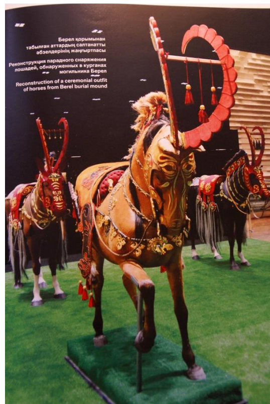
Рис. 6. Реконструкция парадного снаряжения лошадей, обнаруженных в курганах могильника Берел (Золото веков 2016)

Итак, рассмотренные нами памятники и свидетельства говорят о том, что синдо-арийская религиозная традиция была связана с поясом Зодиака, притом хранившие и передававшие эту традицию волхвы особо отмечали Близнецов и Козерога в качестве своих патрональных знаков-созвездий. Логично поэтому составить карту зодиакального цикла с указанием астральных «домов» – созвездий, на которые в определённые периоды времени приходились ежегодные астрономические события: весеннее