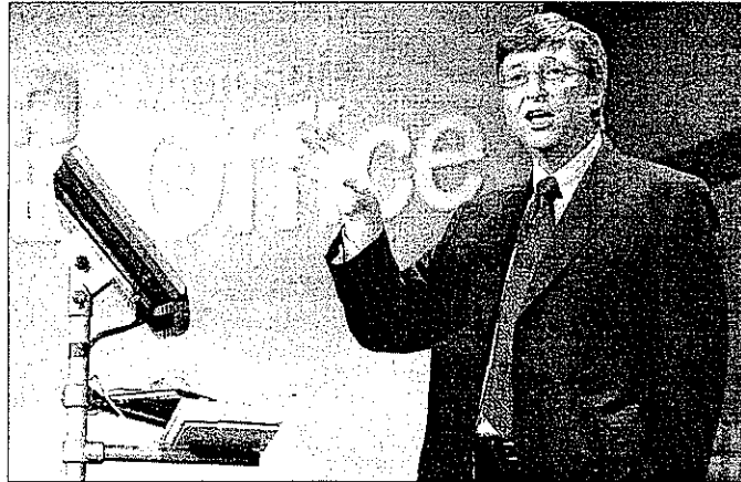
Bill Gates, presidente y fundador de Microsoft.

Avance El software libre, sin embargo, siguió avanzando. Empresas y administraciones públicas comenzaron a utilizar el sistema operativo de código abierto en lugar de Windows . Y entonces el gigante del software empezó a cambiar de estrategia, al ver a Linux como un elemento necesario en el mercado. "Microsoft comenzó a ver que el software libre podría servirle de argumento para defender ante las autoridades de la competencia que hay alternativas a Windows . Que no son un monopolio", explica Dans. Pero Linux sigue acercándose, pasito a pasito, a Microsoft. El pasado 17