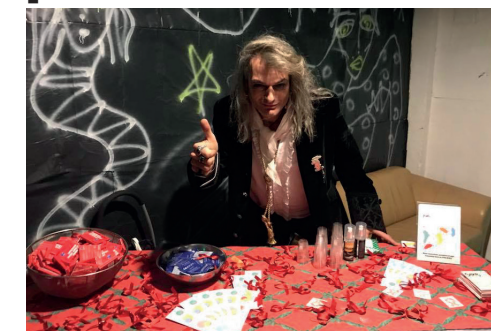
Le stand de PVA-Genève le 31 décembre 2017 à la soirée GENEVEGAS

E n 2018, encore plus que dans les années précédentes, nous avons choisi de mettre en place des actions de terrain lors des manifestations en plein air organisées dans notre ville. Comme nous l'avons fait l'année passée, par exemple, lors de la Rue est à vous des Pâquis, le Marché de Noël, les Fêtes de Genève et bien d'autres. Pour ce faire nous avons besoin de votre aide et de votre engagement.