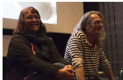
Nos Témoinant.e.s - 2016

En 2016 nous avons voulu mettre en avant un de nos projet phare: le « Projet Témoignage » avec la projection du film « Vivants » et l'intervention de deux de nos témoinant.e.s.