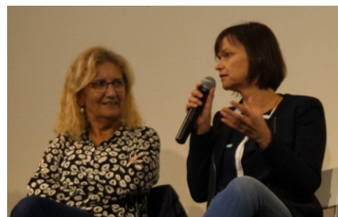
Le débat - 2018