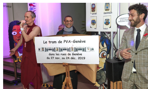
La présentation du tram PVA - 2019

Samedi 17 Octobre 2020 22h00 - 02h00 entrée libre Maison des Arts du Grütli - rue Général-Dufour 16, Genève