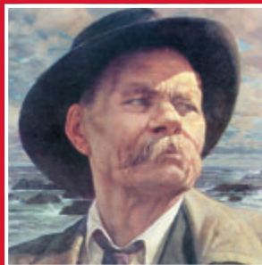
И. Бродский. Портрет М. Горького. 1937 г.

В 2022 году нашему журналу исполняется 95 лет.