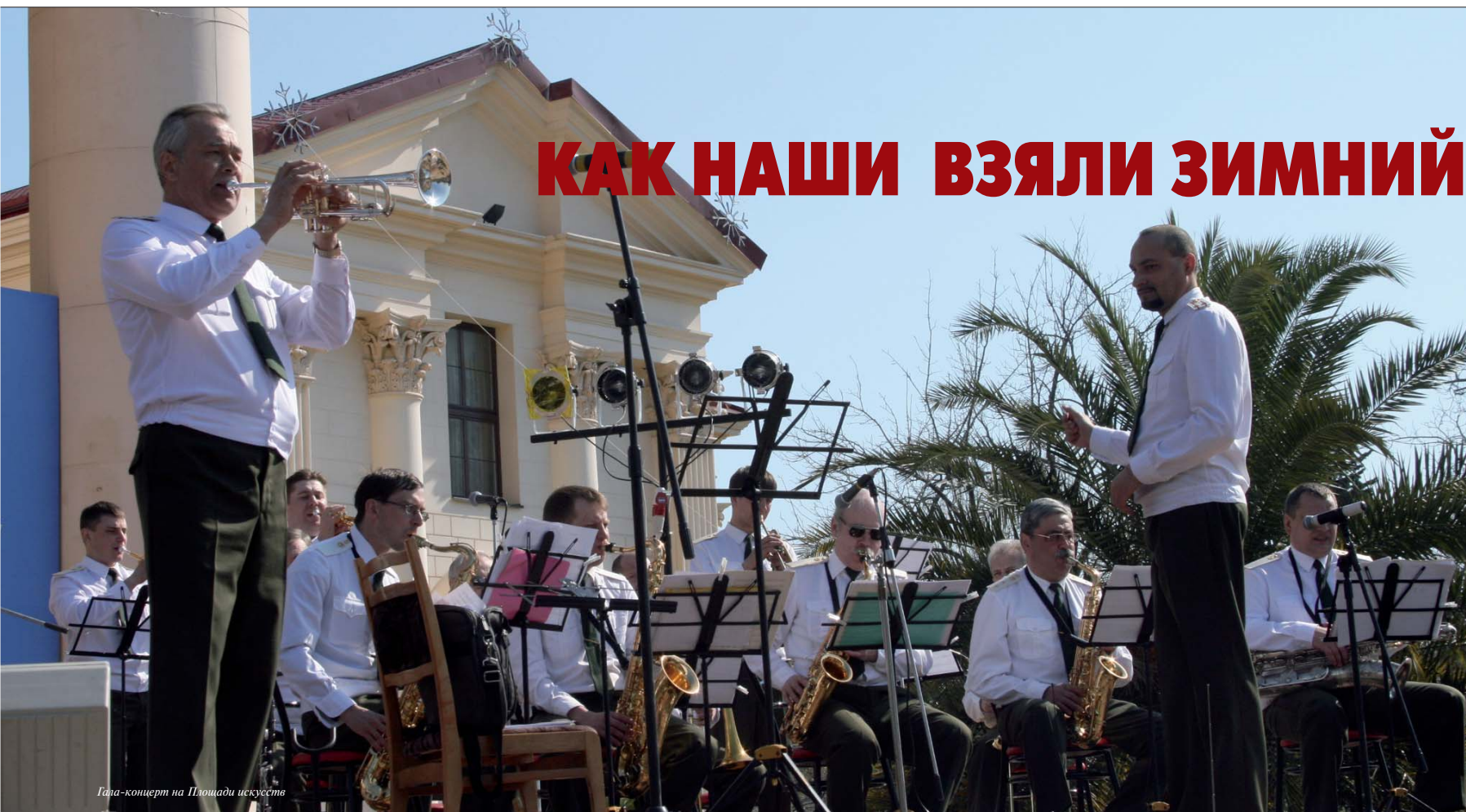
Гала-концерт на Площади искусств

“Музыка удваивает, утраивает армию, – говорил наш непобедимый генералиссимус Александр Суворов, – с крестом священника, развёрнутыми знамёнами и громогласной музыкой взял я Измаил”. Заметим, что слова “с крестом священника” после 1917 года в цитате этой непременно вымарывались. Нам же повезло в том, что приехали в Сочи именно 7 апреля, в Благовещение, и в Свято-Михайло-Архангельском соборе успели попросить архистратига Михаила о покровительстве.