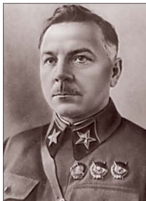
Маршал Советского Союза К.Е. Ворошилов. Возглавлял оборону Ленинграда с 10 июля по 12 сентября 1941 года, будучи главнокомандующим войсками Северо-Западного направления

Но это уже 2 сентября. Есть целый ряд документов той поры, которые свидетельствуют, что стойкий отпор на сестрорецком участке финны,