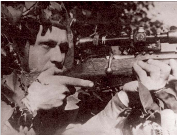
Снайпер 225-го полка конвоинных войск НКВД

Карельского укрепленного района (КАУР), проходившего по линии границы, 1939 года, государственной страны с Финляндией. К этому времени Выборгская группировка, состоявшая из остатков 43, 115 и 123-й стрелковых дивизий, пробилась в район Койвисто, откуда на кораблях и баржах была перевезена в Ленинград. Вскоре, пополненные и заново вооруженные, они заняли оборонительные позиции в укрепрайоне. В течение сентября эти дивизии во взаимодействии с силами Краснознаменного Балтийского флота и Ладожской военной флотилии отразили все попытки финских войск прорвать нашу оборону на рубеже Карельского укрепрайона и вынудили их перейти к обороне.