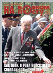
На 1-й странице обложки:

Редакция вправе сокращать и литературно обрабатывать принятые к публикации тексты. Редакция может публиковать материалы, не разделяя точку зрения авторов. Рукописи не рецензируются и не возвращаются. За достоверность фактов, имён собственных, неразглашение тайны отвечают авторы публикаций, за достоверность рекламных объявлений – рекламодатели, за качество печати – типография. Переписка с читателями ведётся только на страницах журнала.