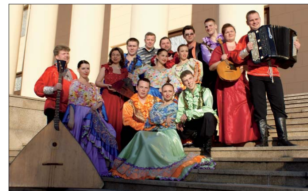
Лауреат Фестиваля ансамбль песни и пляски Северо-Западного регионального командования ВВ МВД России

Ещё не остыли переживания от фестивальных конкурсов, встреч, концертов, а наши друзья из "сборной музыкальной команды" уже обсуждали ближайшие планы: оркестрам предстояли предпарадные тренировки, ансамблям и солистам – репетиции новых программ к Дню Победы. Военная музыка, звучит!