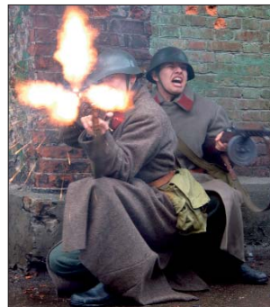
Диверсанты из “Бранденбурга”

тают умалчивать. Я вырос в Ростове, поэтому с детства знаю о подвиге бойцов-чекистов. Тот же Зелёный остров, где любят отдыхать ростовчане – это место жестокого боя. Там сейчас мемориал в честь погибших. Уверен, обществу необходимо знать правду о подвиге чекистов и бойцов войск НКВД. Для этого мы и работали над своим фильмом.