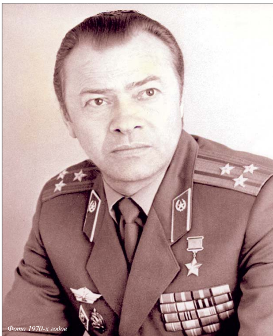
Фото 1970-х годов