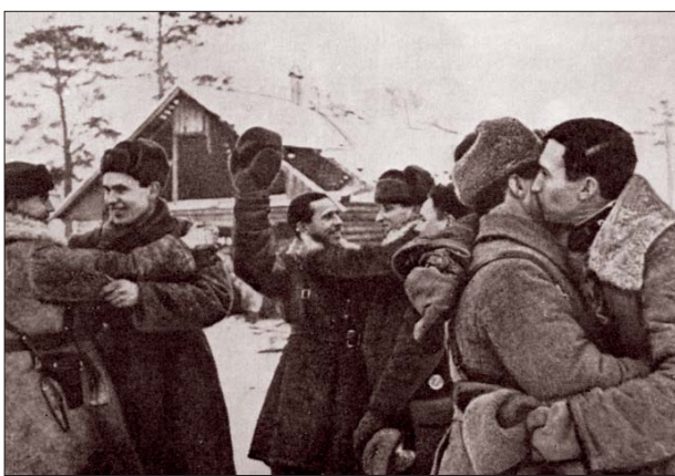
Блокада прорвана! Встреча воинов Ленинградского и Волховского фронтов

шени пожаров и эвакуации в бомбоубежища населения. Кроме этого они вносили и посильный материальный вклад в дело общей победы. С началом войны в церквях города и области по инициативе владыки Алексия был объявлен сбор средств для больных и раненых. Уже 8 августа прихожане самого большого действующего Князь-Владимирского собора города собрали 710 тысяч рублей. А к концу года во всех храмах было собрано 2 миллиона 144 тысячи рублей. Помимо этого верующие горожане уже в условиях окружения и голода продолжали сбор средств в фонд обороны, на строительство танковой колонны "Дмитрий Донской", авиаэскадрильи имени Александра Невского. Всего же за годы войны жители Ленинграда собрали более 8 миллионов рублей, за что удостоились благодарности Верховного Главнокомандующего И.В. Сталина, опубликованной в газете "Правда": "Прошу передать православному духовенству и верующим Ленинградской епархии... мой искренний привет и благодарность Красной Армии!"