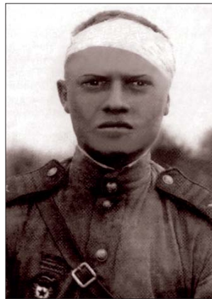
После очередного ранения

И уже в конце войны, за Одером, 22 марта произошёл такой случай. На НП, который находился в одном из домов, на чердаке была установлена стереотруба. Велось круглосуточное наблюдение за передним краем про-