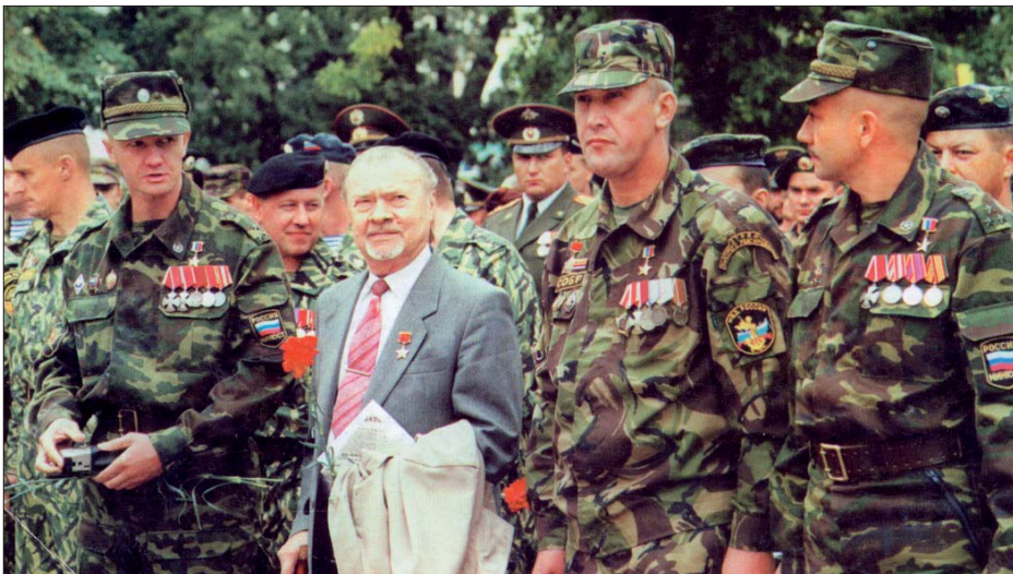
С Героями нынешних дней

На попытке, которая как раз везла хлеб в одну из танковых бригад нашего корпуса, попытка добраться до своих. Тут произошёл забавный эпизод.