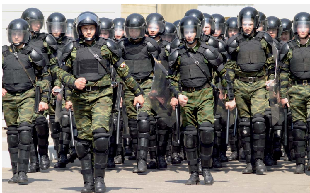
Добро должно быть с кулаками!

Задача наша состояла в том, чтобы держать под наблюдением колонну “троцкистов”. Маршрут движения пролегал по Тверской, в направлении Красной площади. По информации взаимодействующих с нами оперативников, наиболее и анархисты под предводительством “эргэсовцев”