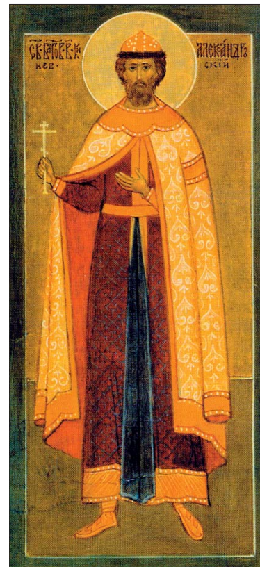
Икона Святого благоверного великого князя Александра Невского

Необходимо упомянуть, что православное духовенство, верующие ленинградцы, не забывая про Бога и заступничество сил Небесных, наряду со всеми жителями несли дежурство на крышах и чердаках во время бомбёжек, принимали участие в ту-