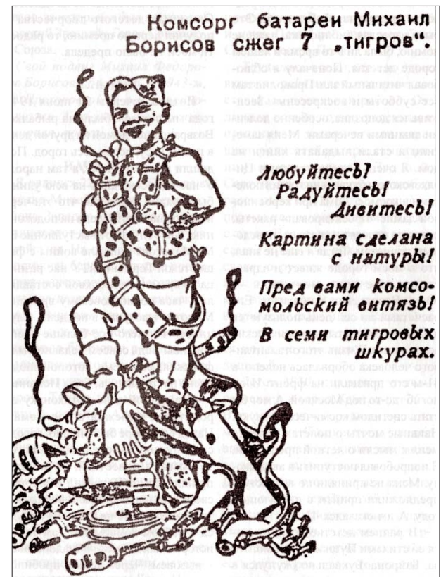
Шарж на солдата-героя. Газета “Комсомольская правда”, 1943 г.

Позже меня назначили наводчиком 82-мм миномёта. Я на всю жизнь полюбил этот вид оружия.