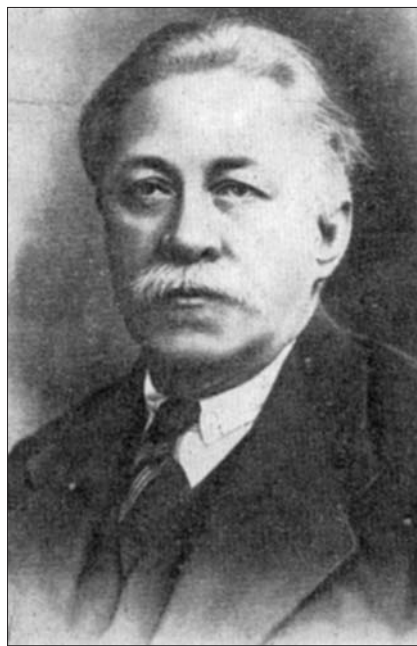
2. att. Pēteris Stučka.