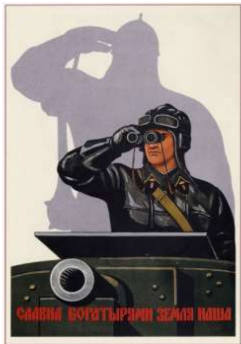
Рис. 1. Советский плакат военного времени.

В-третьих , «символ является подвижной системой взаимосвязанных функций» [3, 169]. Традиционно говорят об экспрессивной, репрезентативной и смысловой функциях символа. Посредством данных основных функций и реализуется роль символа в культуре, в формировании и функционировании исторической памяти.