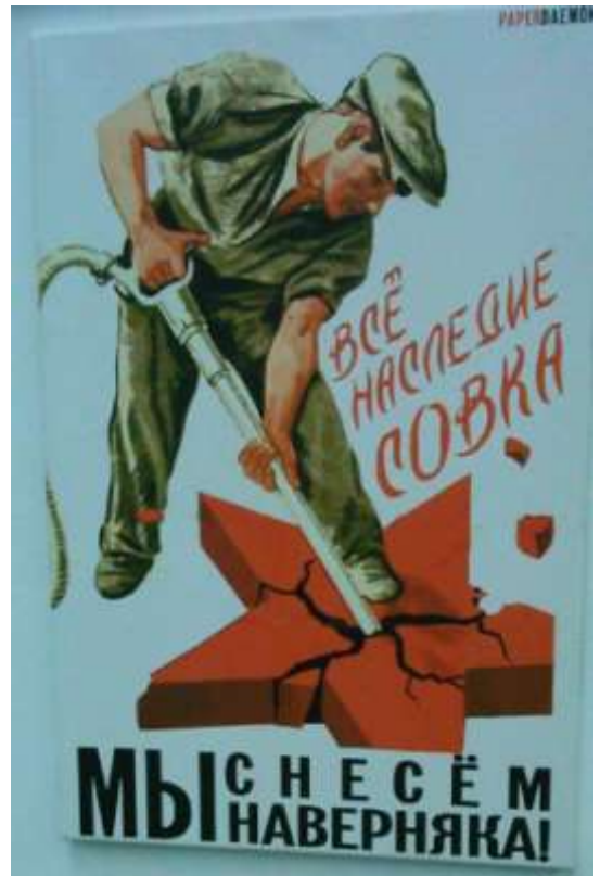
Рис. 2. Циничный призыв, обращенный к гражданам современной Украины.

Дискредитация символов. Этот прием носит более изощренный характер по сравнению с их простым уничтожением и запретом символов. В период горбачевской перестройки и постсоветскую эпоху многое было сделано для дискредитации советской символики вообще и советской военной символики, в частности. Например, «свастика» (символ фашистской Германии) и «серп и молот» (символ СССР) объявлялись в равной степени символами тоталитаризма. Красная звезда (символ Красной, а затем и Советской армии) характеризовалась как масонский знак.