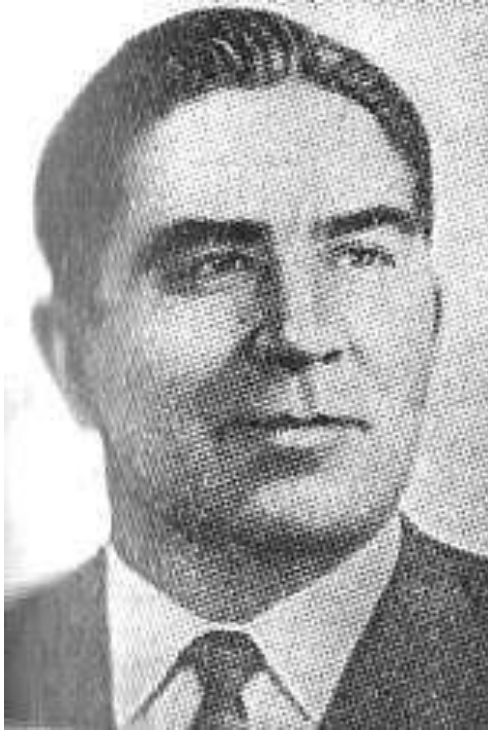
С.П. Тутученко – Герой Советского Союза.

В Спадщанском лесу под г. Путивль (Сумская область) на аллее Героев установлены бюсты героям-сибирякам С.П. Тутученко и А.Н. Ленкину.