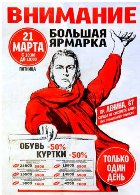
Рис. 3. Образец «творчества» отечественных деятелей «массовой культуры».

Справедливости ради следует отметить, что дискредитация символов государственного отличия началась еще в советское время и вызывалась бездумной раздачей государственных наград СССР как гражданам своей страны, так и представителям других государств. Так, в свое время присвоение высшей степени отличия СССР (звание «Герой Советского Союза») президенту Алжира Ахмеду бен Белле (1964) и президенту Египта Гамалю Абдель Насеру (1964) вызвало неодобрение в советском народе и породило целую серию анекдотов, куплетов и частушек. Апофеозом глупости и политической недалекости стало присвоение Л.И. Брежневу звания Маршала Советского Союза (1976) и награждение его Орденом Победы (1978). Подобного рода проявления имеют место в современной России.