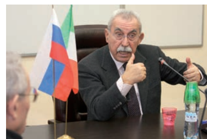
Визит итальянского журналиста и политического деятеля Джульетто Кьеза

В-третьих, выступления наших коллег на площадке «Чисто конкретной персоны»