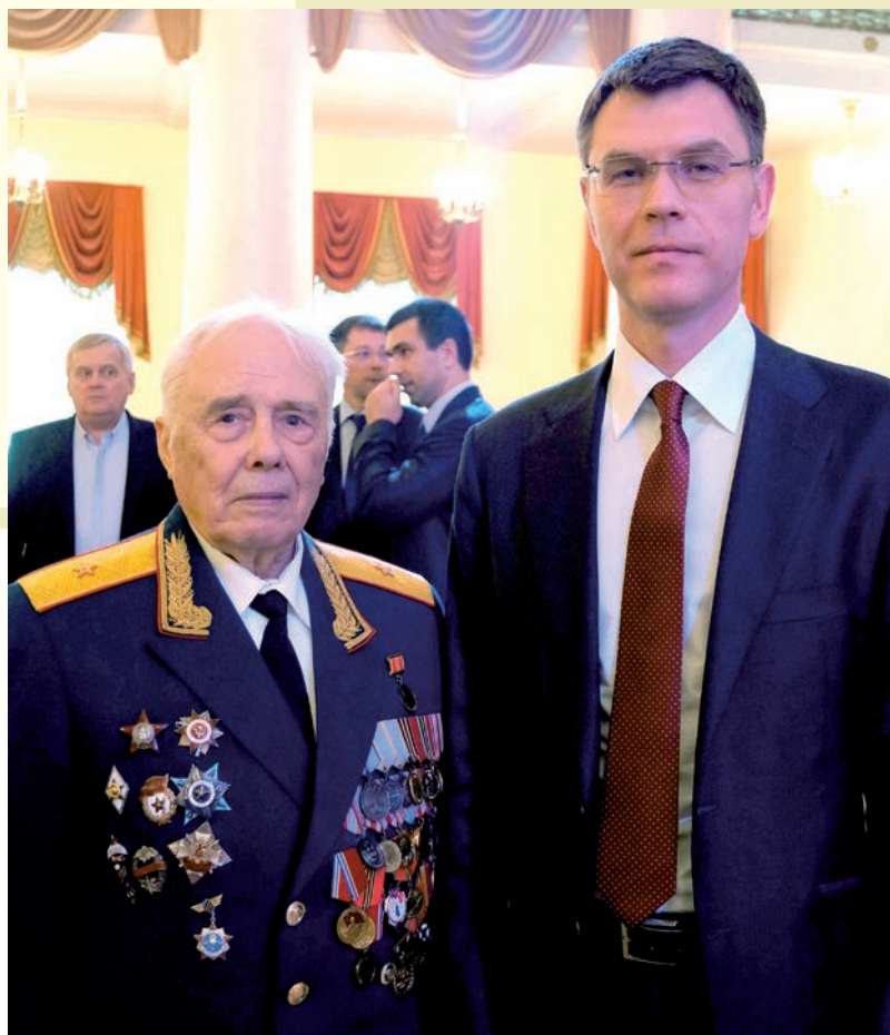
Советник при ректорате Финансового университета, генерал-майор в отставке С.М.Ермаков и выпускник университета, заместитель министра юстиции Российской Федерации Д.В.Аристов

29 апреля 2014 года участники Великой Отечественной войны и ветераны Финансового университета встречались в Культурном центре Вооруженных сил Российской Федерации с руководством Министерства обороны.