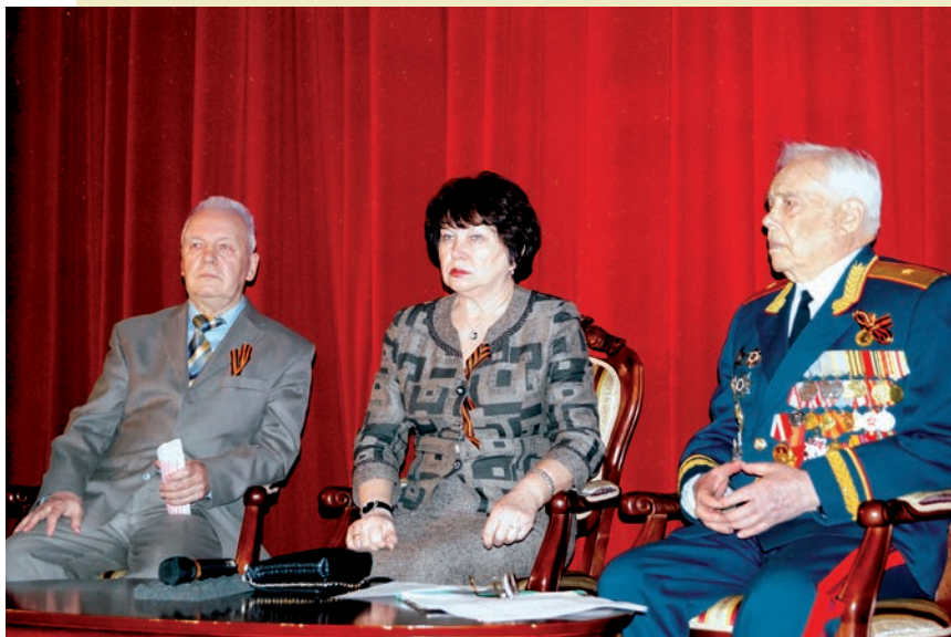
На встрече ветеранов в киноконцертном зале Финансового университета: руководители мероприятия

С искренней благодарностью ветеранам войны от студенчества Финуниверситета выступил студент