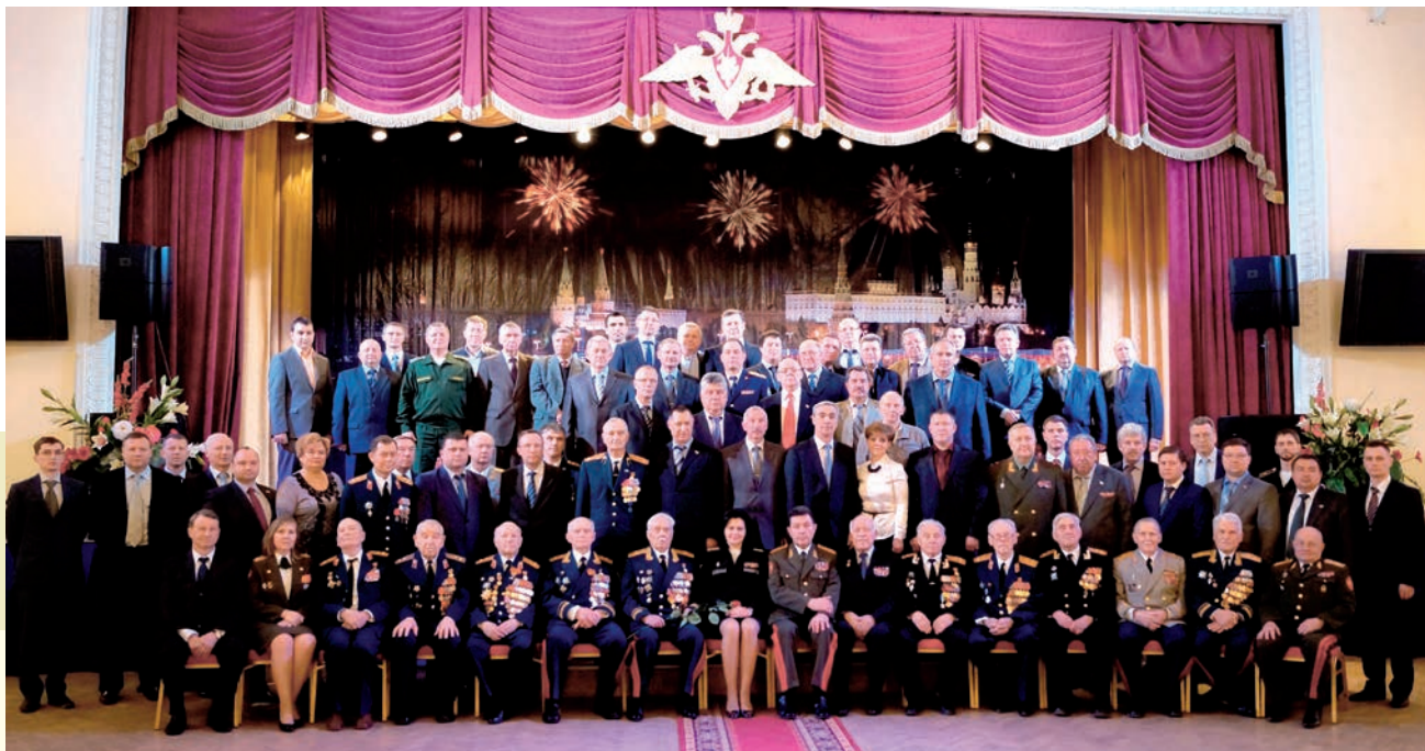
Ветераны – выпускники университета на встрече с заместителем министра обороны Российской Федерации Т.В.Шевцовой, посвященной 69-й годовщине со Дня Победы

29 апреля 2014 года участники Великой Отечественной войны и ветераны Финансового университета встречались в Культурном центре Вооруженных сил Российской Федерации с руководством Министерства обороны.