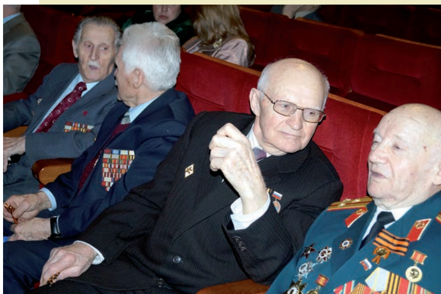
Участники Великой Отечественной войны, ветераны Финансового университета