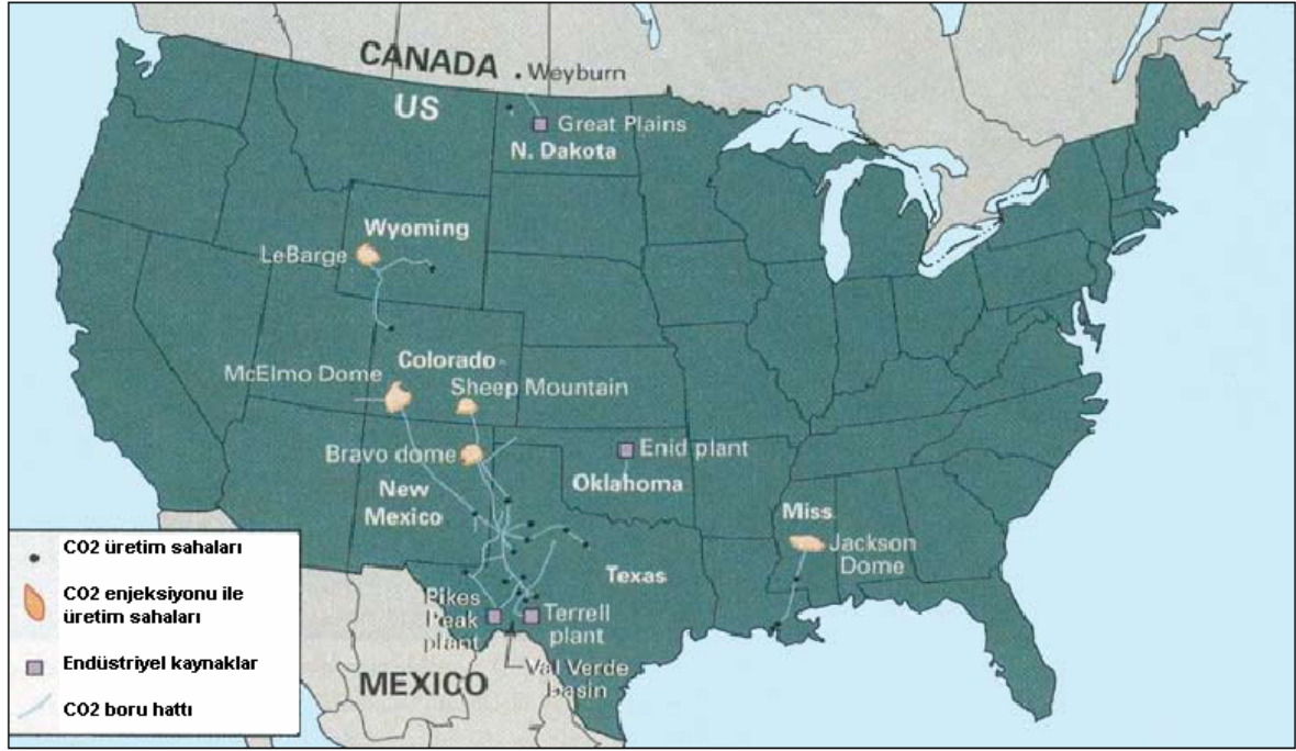
Şekil 4.1 Kuzey Amerika'daki CO2 boru hatları