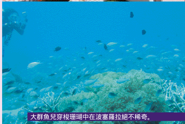
大群魚兒穿梭珊瑚中在波塞羅拉絕不稀奇。