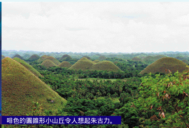
啡色的圓錐形小山丘令人想起朱古力。