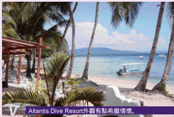
Altantis Dive Resort外觀有點希臘情懷。

10 米水深下是粉紅色的軟體珊瑚及碗形珊瑚 , 適合夜潛。水流一般較平靜 , 但偶然會有急流 , 水底視野約 20 米。