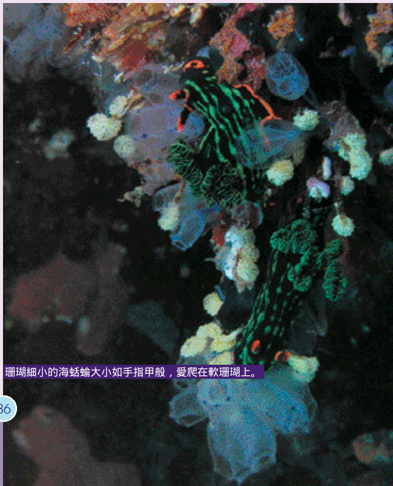
珊瑚細小的海蛞蝓大小如指甲般，愛爬在軟珊瑚上。

寶和島位於菲律賓中部，在宿霧島的右下方，除每年7至9月有時受到季候風、陣雨的影響外，全年均可潛水。水中景致變化多端，地形崎嶇多變化，有很多海底洞穴，斜坡、峭壁，珊瑚礁生態非常完整。只要沿岩壁前進，沿途豐富的海洋生態和巨型的海綿珊瑚都令你歎為觀止。總類繁多的熱帶海洋魚種徘徊於這個小島的周遭海域。這裡是菲律賓政府及國際海洋保護組織的保護區，往來這個區域的船隻必須領有執照，才能在這個海域行駛。有些潛水員就覺得無論珊瑚和魚類的大小、顏色在菲律賓的潛水點來說都屬最佳地點之一。