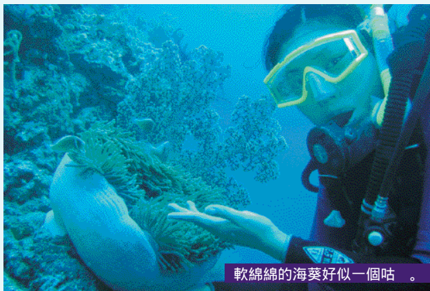
軟綿綿的海葵好似一個咕。

你還可以坐竹筏遊河道，聽聽傳統的菲律賓民歌。吃的菲律賓炸魚和地道菜可能不大合你口味，卻是當地很傳統的菜式。臨走前，別忘了買些紀念品回家做手信。