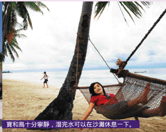
寶和島十分寧靜，潛完水可以在沙灘休息一下。

黑森林珊瑚都是海底的模特兒。Garden Eel Point圓鰻角，水深約30米的位置是一個斷崖，長滿各種的軟硬珊瑚，斜坡下是鰻魚聚居的地方，也有很多獅子魚游來遊去。