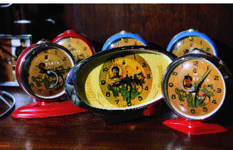
民革懷舊鐘$120-$170(明太祖)