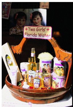
雙妹嘜產品 價錢由 $5至 $48.8不等 (小木作)

西貢原居民多為漁民，他們都信奉天后娘娘。於滿記甜品對面停車場的旁邊有一間天后古廟，香火鼎盛。