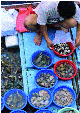
碼頭旁賣魚的小艇。

西貢美食遍佈全西貢區，最特色的是這 的美食絕不單調。海鮮、泰國菜、甜品、意大利菜、法國菜、咖啡店總之要乜有乜，最能滿足意見多多的一家大細。吃海鮮的話，近碼頭的全記、通記都很出名。這些海鮮酒家對烹調古怪海鮮別有一手，最具特色的有「海膽、海星蒸蛋白」，鮮甜美味，食後還可拿走海星回家煲湯，有下火清熱氣食療功效。