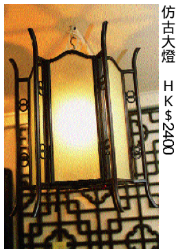
仿古大燈 HK $200