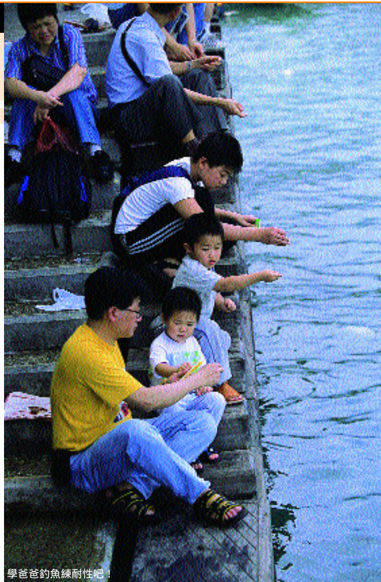
學爸爸釣魚練耐性吧！