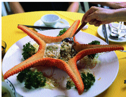
海膽、海星蒸蛋白$180入口甘香，皆因海膽的鮮甜帶起海星的卵的甘香，非常滑口。

乘車到達西貢，巴士、小巴總站就在西貢碼頭旁邊。你可先到海堤旁散散步，看人看海寫意到不得了。西貢碼頭每日有不少小艇停泊在碼頭旁，通常售賣深海大魚或各種奇怪海產。每朝早有許多人來到碼頭挑選海鮮，買回家烹調自製美食。有時候，小艇會售賣一些罕見的海產，如海星、狗爪螺等。平時小朋友在市區較少會看到，今次的遊程必定能令他們大開眼界。