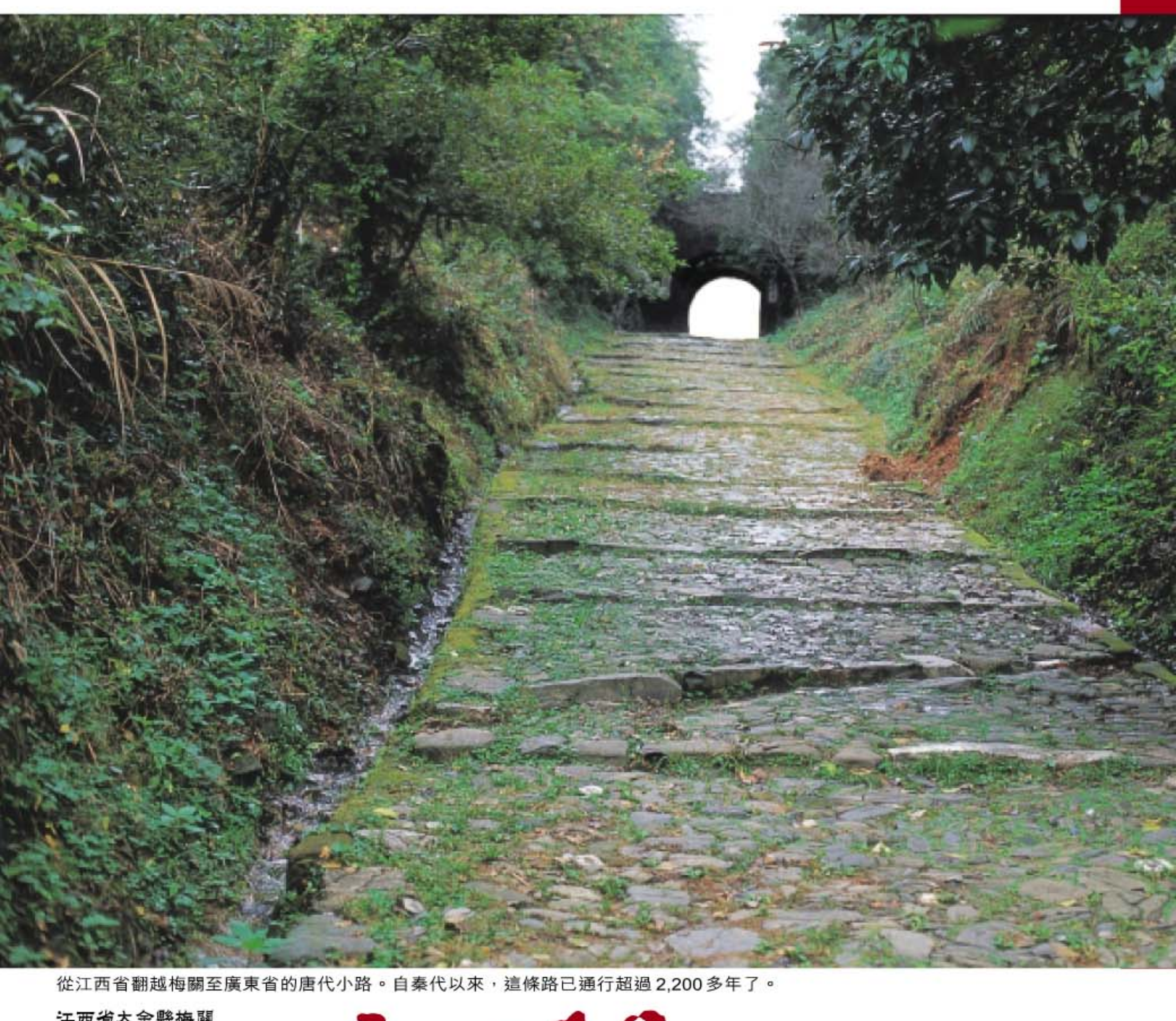
從江西省翻越梅關至廣東省的唐代小路。自秦代以來，這條路已通行超過2,200多年了。 江西省大余縣梅關