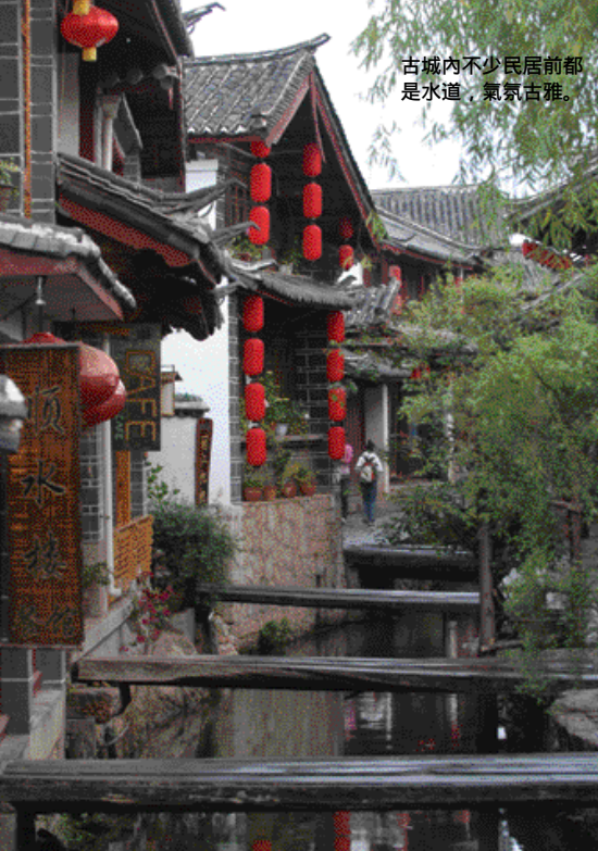
古城內不少民居前都是水道，氣氛古雅。