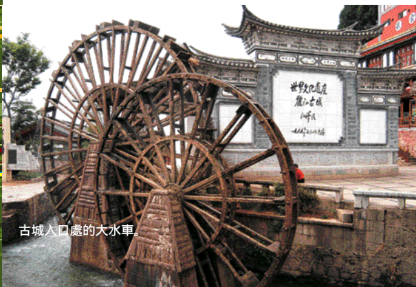
古城入口處的大水車。

在清晨遊人稀少之時，此時在古城漫遊，感覺特別舒服；而在晚上全城亮燈之後，又有另一番獨特氣氛，所以有人說要全面欣賞這個高原古城，最好是在不同時間來到，方能體會古城獨特的面貌。由於古城內被水道貫穿，所以就算因古城面積廣闊而迷路，只要找到水道依水流相反方向而行，便可回到古城的入口。