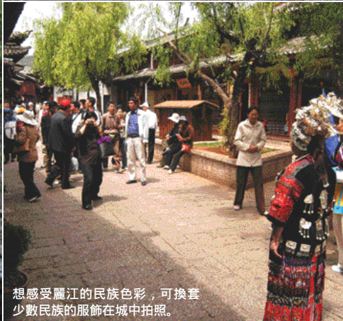
想感受麗江的民族色彩，可換套少數民族的服飾在城中拍照。

麗江古城是麗江以至雲南最具名氣的其中一個遊點。始建於1253年的麗江古城，由於外形似一大石硯，所以又名為大研鎮。偌大的古城內，到處都充滿古舊而雅致的氣息，縱橫交錯的石板小巷、貫穿城中的水道、古樸傳統的民居，再加上處處垂柳的優雅環境，古樸氣氛極為濃厚，在如此優雅的城中小巷穿插，讓人有墮進古代的感覺，確實是與別不同的感受。