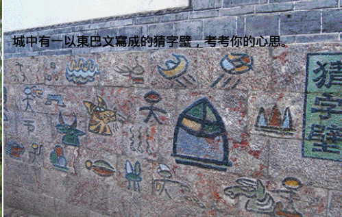
城中有一以東巴文寫成的猜字壁，考考你的心思。