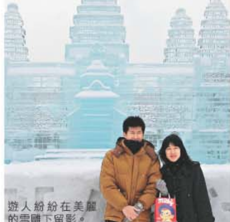
遊人紛紛在美麗的雪雕下留影。