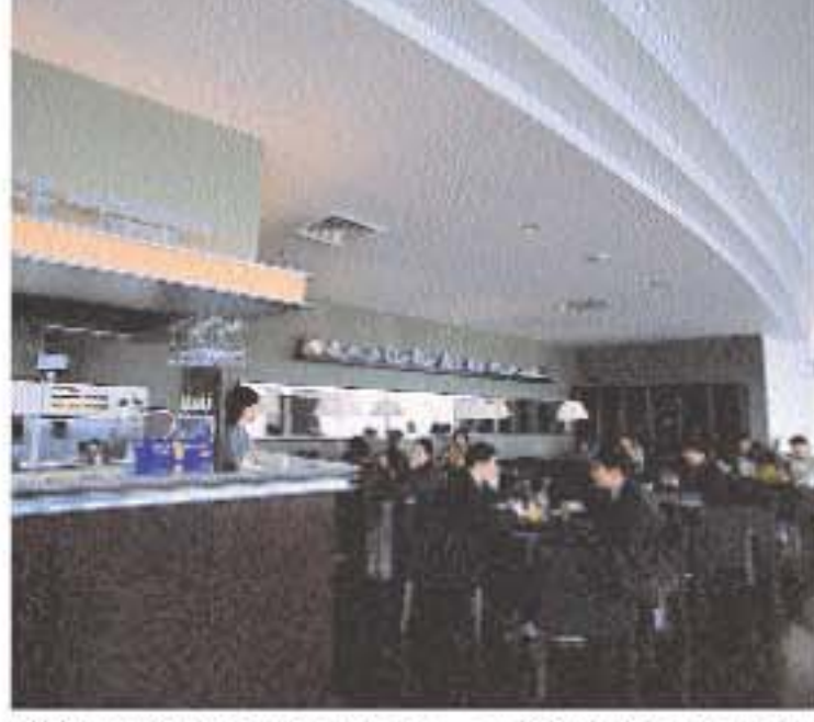
位於展望室內的咖啡閣，可讓遊客邊呷口咖啡欣賞札幌市景色。