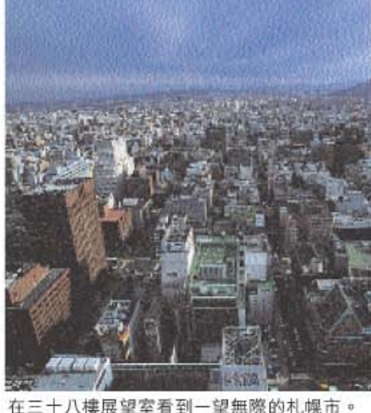
在三十八樓展望室看到一望無際的札幌市。