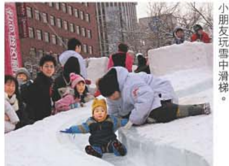
小朋友玩雪中滑梯。