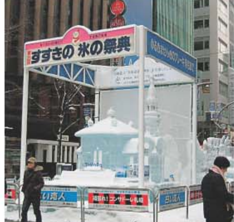
薄野會場相對面較較細，細規模的冰雕會擺放在主要街道上。