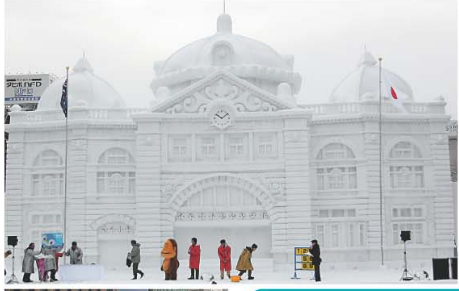
雪中舞臺會用來舉行歌舞表演。