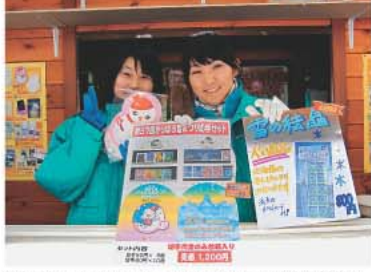
售賣紀念品的朋友，正在落地地推銷雪祭的特別版郵票。