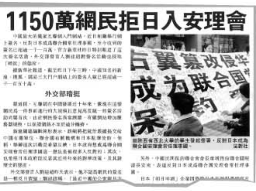
2005年3月30日 網民在互聯網上簽名，反對日本加入安理會。