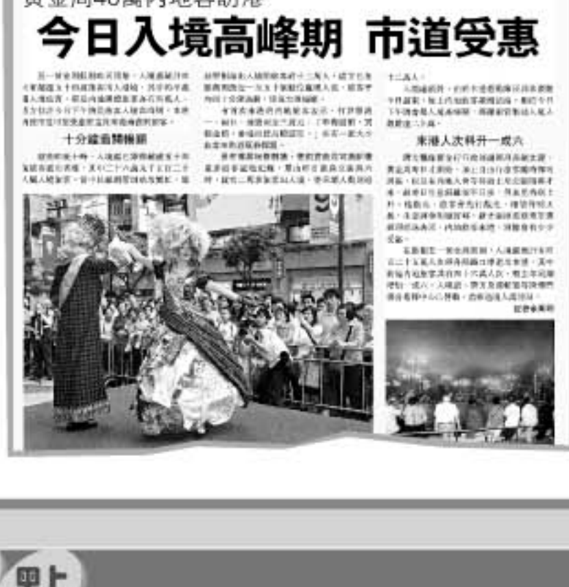
2005年5月2日 在「黄金周」的帶動下，預料內地客訪港人次會高達46萬。