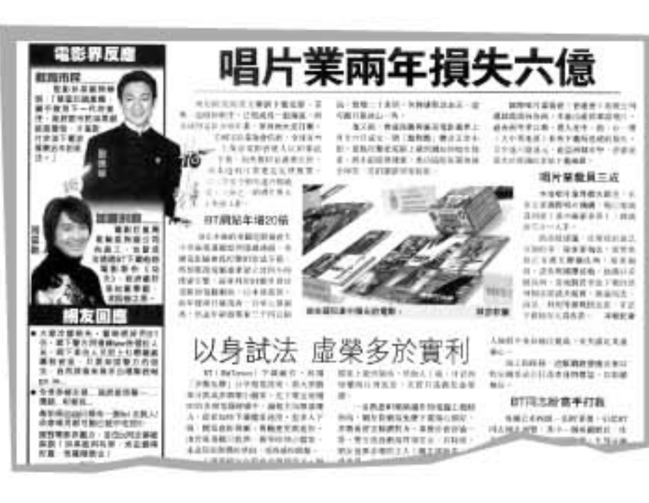
2005年1月14日 在網絡中以BT形式下載有版權的資訊，其實已屬於違法。