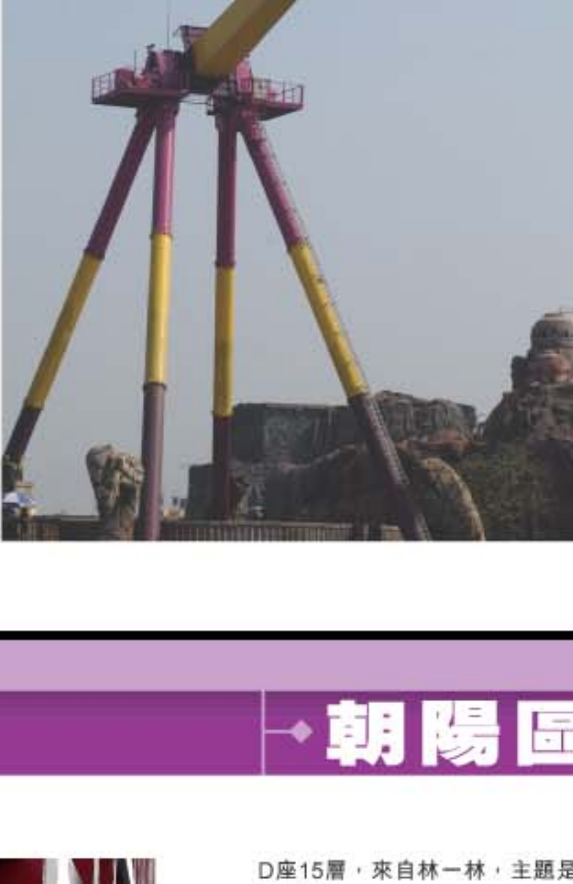
太陽神車，將你反轉再反轉，據稱是亞洲最大型機動遊戲。

不要以為到北京只是獨沽一味看古蹟、睇文物，想一家大小玩番一天半日，新鮮熱辣的北京歡樂谷絕對是必到一站。雖然深圳都有歡樂谷，不過這裡擁有新型的機動遊戲，最適合愛刺激一族。2006年7月開幕的北京歡樂谷佔地達100萬平方米，第一期只開放了56萬平方米；隨口迎接奧運，於2008年前會陸續擴展。已開放的樂園分為6區，分別為峽灣森林、阿特蘭蒂斯、失落瑪雅、愛琴港、香格里拉和螞蟻王國，其中愛琴港便是為呼應奧運而建，日後更會建奧林匹克體驗展館。