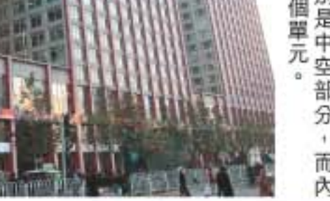
現代城的建築最特別的是中空部分，而內部結構便以四層為一個單元。