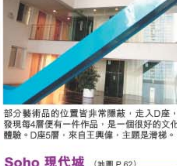
部分藝術品的位置皆非常隱蔽，走入D座，發現每4層便有一件作品，是一個很好的文化體驗。D座5層，來自王興偉，主題是滑梯。