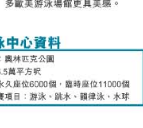
會發出藍光的「水立方」，比許多歐美游泳場館更具美感。

國家游泳中心有一個很別致的稱號「水立方」，因為這場館是中國首個採用「ETFE Pillows」材料的建築工程，這種獨特物料使場館外牆像刻有多個不規則的泡泡，加上物料本身透光，遠看就像一個裝滿水的立方體，故有「水立方」這別稱。