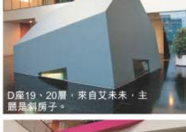
D座19、20層，來自艾未未，主題是斜房子。