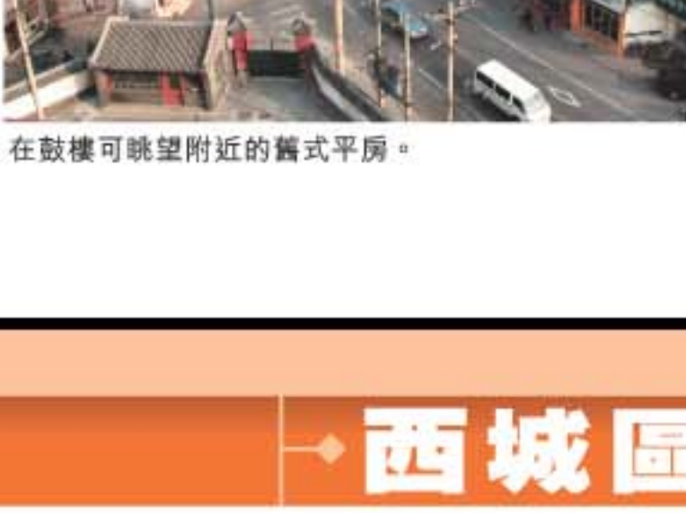
在鼓樓可眺望附近的舊式平房。