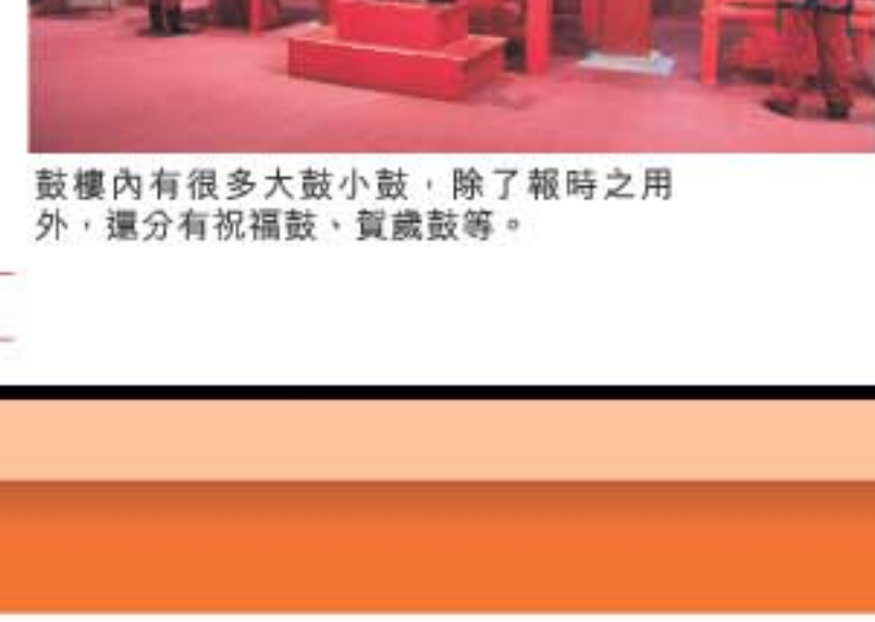
鼓樓內有很多大鼓小鼓，除了報時之用外，還分有祝福鼓、賀歲鼓等。