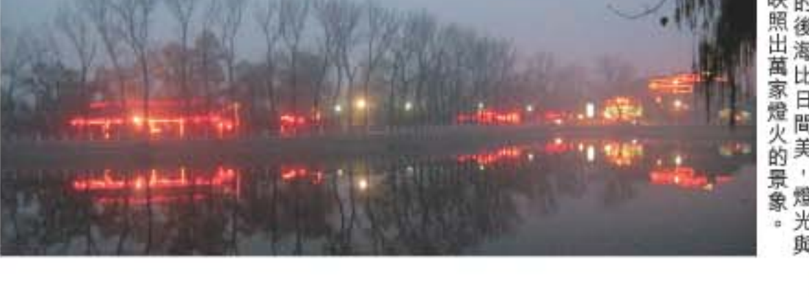
晚間的後海比日間美，燈光與湖水映照出滿家燈火的景象。