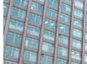
以不同色調作為建築的分野。

是Soho中國的第一個項目，位於北京中央商務區，中國國際貿易中心的東面，總建築面積為48萬平方米，有48間商舖、283間辦公室與1897間公寓。外表看來不算太特別，但最大的特色是要深入各樓層內，會發現它的獨特設計，再加上在部分樓層之中，收藏了13件不同類型的藝術作品，這些作品全都是來自中國國內著名藝術家的創作，不同於一般博物館的收藏，由構思、製作到完成，都與建築結構及空間有關連，以幽默且嘲諷的態度輕鬆地融入現代都市人的日常生活之中。我們大可以當作博物館看待呢！