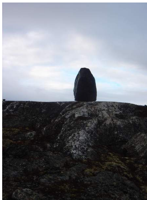
Фото 27. Менгир на Кольском полуострове

Далее, следует отметить, что в окрестностях поселка Донское, имеется большой каменный ящик, выстроенный из огромных мегалитов гранитного происхождения, объемом с трех этажный одноподъездный дом. С первого взгляда, подойдя к нему близко, кажется, что это просто нагромождение огромных камней, но, если отойти от него на расстояние хотя бы в 25-35 метров, то сразу впечатление, кардинально меняется, так как четко усматривается искусственно созданная конструкция вроде исполинского дольмена, или каменного ящика. Стены этого ящика составляют, примерно 10-12 м в высоту, и 4-5 м в ширину, и напоминают треугольники, прямоугольники и квадраты. На двух из них слабо улавливается нечто похожее на анфас лица человека. Один из камней стены, который стоит крайним слева в сторону запада, даже напоминает лицо каменных монстров с острова «Пасхи», но образ лица довольно сильно размыт временем и атмосферным воздействием, и поэтому, чтобы его разглядеть, следует некоторое время напряженно всматриваться. Стены каменного ящика покрыты двумя мегалитами естественного происхождения. На самом большом из них (в длину 10 м, шириной 7-8 м, толщиной до 1,5 метра, весом примерно 200 тонн), если смотреть со стороны реки, четко просматриваются чашечные углубления диаметром 50x50 см и глубиной до 40 см. Таких чашек