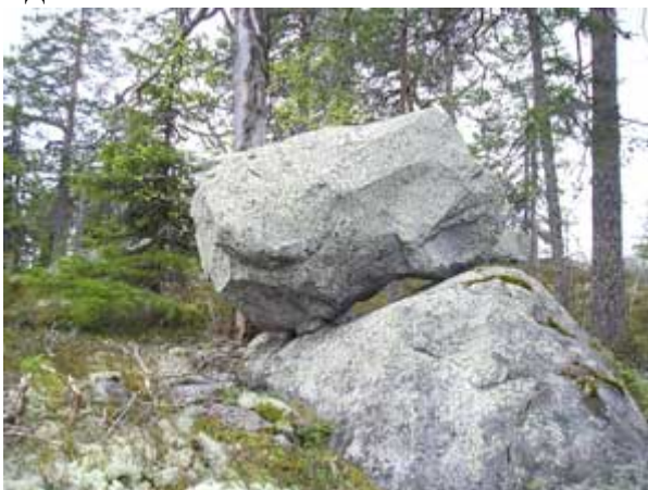
Фото 24 Сейд с Кольского полуострова.

Интерес представляет и способ установки менгиров на наклонной поверхности скал. Так, проанализировав порядок установки сейдов на наклонной поверхности в пределах Кольского полуострова (см. фото 24), мы столкнулись с таким же способом установки, но уже менгира, на вершине наклонной поверхности каменного мегакомплекса по близости с. Анадоль (см. фото 25). Из обеих фотографий усматривается, что остов камня, с низу как бы стесан в виде своеобразной дуги, а сам камень стоит на трех точках опоры (треножнике). Причем, технология установки данных каменных сооружений на Кольском полуострове и в окрестностях пос. Донское одинакова.