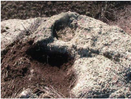
Фото 16. Чашечный жертвенник