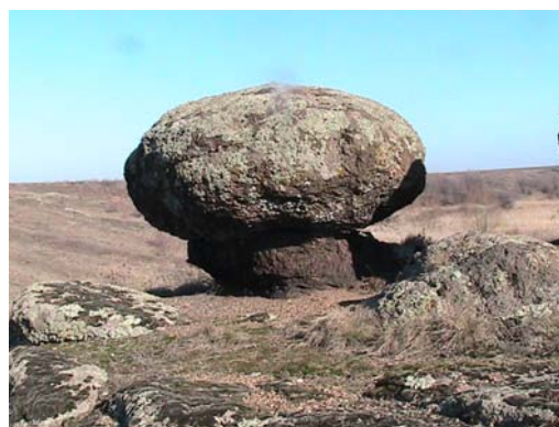
Фото 8. Сейд в окрестностях пос. Донское.

Описывая результаты нашего исследования, мы наткнулись на очень интересные артефакты Карелии и найденные в предместье пос. Донское, которые имеют сильное сходство между собой. А именно, это каменный колодец горы Воттоваара (см. фото 9), и то, что мы обнаружили в качестве жертвенника, выбитого на поверхности гранитной породы в Лагозиной балке пос. Донское (см. фото 10).