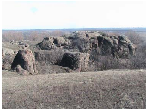
Фото 19. Менгир у с. Анадоль.

Представляет интерес еще одна ассоциация, это остров в Карелии (см. фото 20) и жертвенник в окрестностях Лагозиной балки пос. Донское (см. фото 21). Данный остров, по-видимому, при обзоре с определенного места, создает впечатление большой полусферы правильной формы. Каменный жертвенник в степной зоне Лагозиной балки, создает такое же впечатление, однако среди зеленеющей степи.