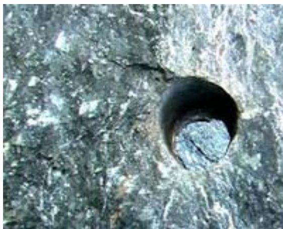
Фото 4. Каменные жертвенники Гипербореи.

В Донском комплексе, находится два огромных, тон по 150-200 овальных каменных валуна. Один из них распилен, кем и чем неизвестно. Однако следы распила видны четко. Отпиленный кусок валуна величиной с автомобиль Жигули и стоит рядом с основным валуном (см. фото 5). Подобная картина наблюдается и на горе Воттоваара, что находится в Карелии (см. фото 6). Там тоже кто-то распилил огромный каменный мегаблок.