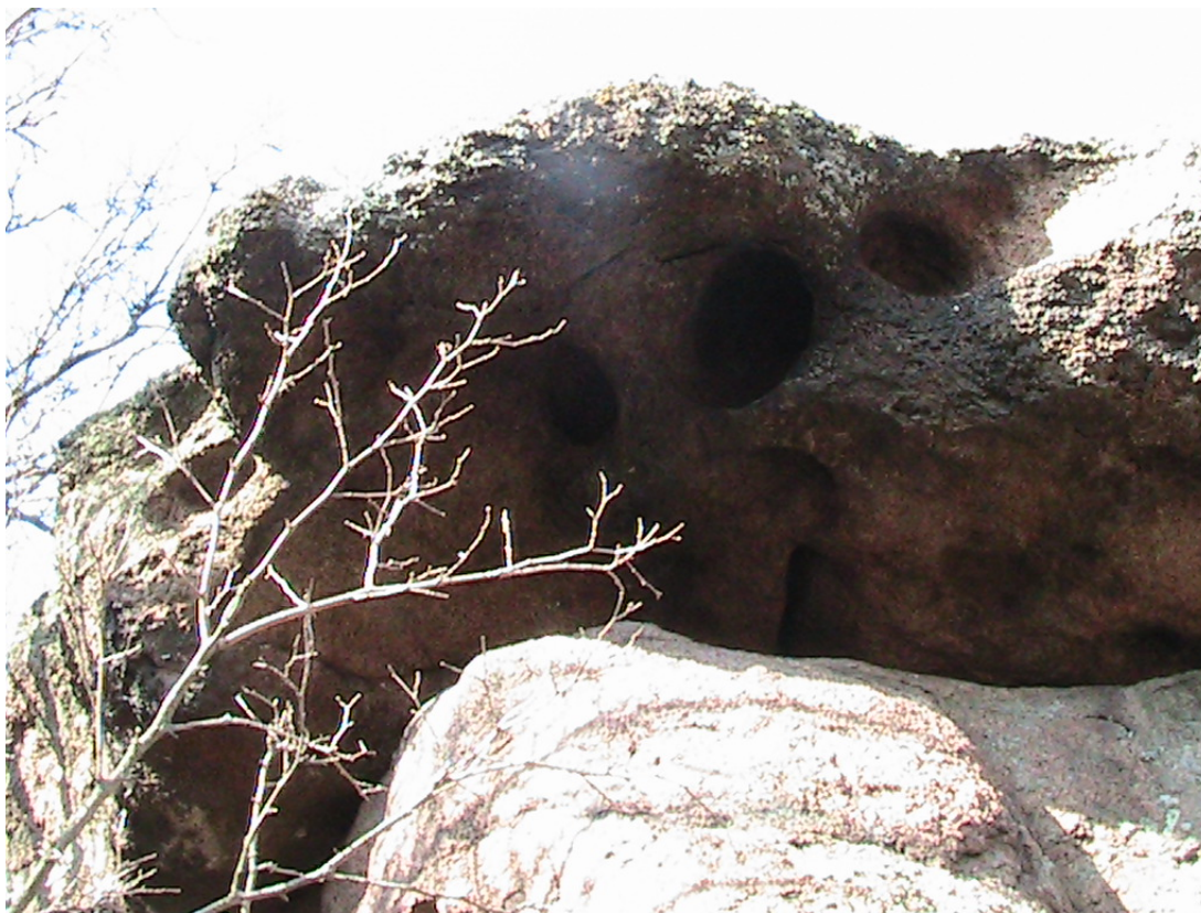
Фото 30. Монстр следящий за вашими действиями, и всегда готов....

Если смотреть на конструкцию с низу, то с верху на вас будет смотреть страшный монстр в виде человека с длинным носом и круглыми глазами (см. фото 30).