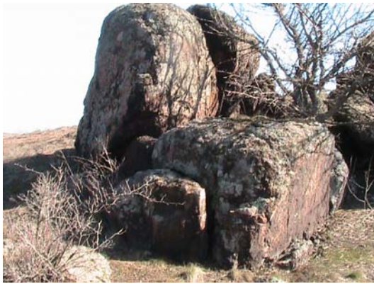
Фото 17. Жертвенник в виде двух менгиров и каменного блока в окрестностях пос. Донское

К сожалению, аналогов жертвеннику, изображенному на фото 17, мы в базе сети Интернет так и не нашли. Но радует другой факт, на одной из фото, Кольского полуострова, мы обнаружили два менгира в виде конусообразных мегалитов (см.18), такие же точно находятся и вблизи мегалитического комплекса у с. Анадоль, Волновихского района (см. фото19).