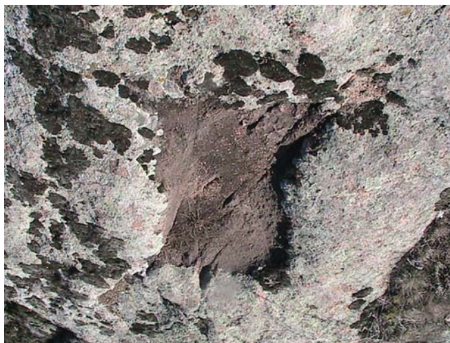
Фото 11. Жертвенники в Лагозиной балке пос. Донское (жертвенник 1).