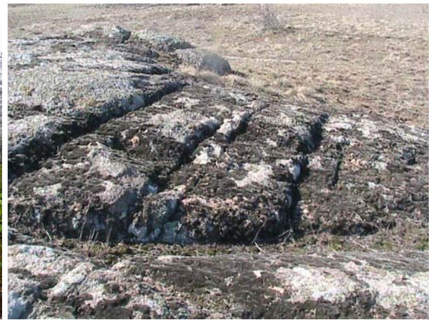
Фото 13. Ступени комплекса близ села Анадоль Волновахского района.