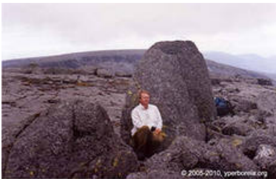
Фото 18. Менгир на Кольском полуострове

К сожалению, аналогов жертвеннику, изображенному на фото 17, мы в базе сети Интернет так и не нашли. Но радует другой факт, на одной из фото, Кольского полуострова, мы обнаружили два менгира в виде конусообразных мегалитов (см.18), такие же точно находятся и вблизи мегалитического комплекса у с. Анадоль, Волновихского района (см. фото19).