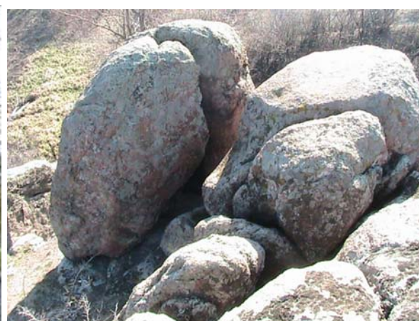
Фото 25. Одна из скал, что с лева, установлена так же как и сейд на Кольском полуострове.