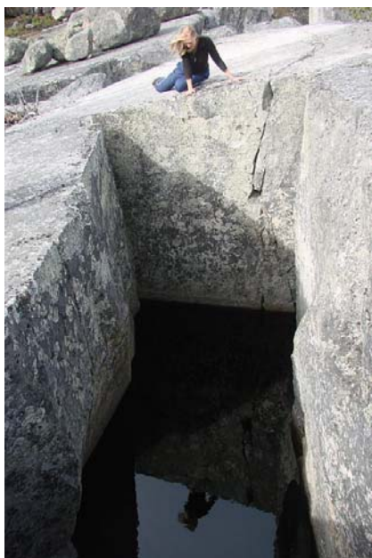
Фото 10. Колодец на горе Воттоваара