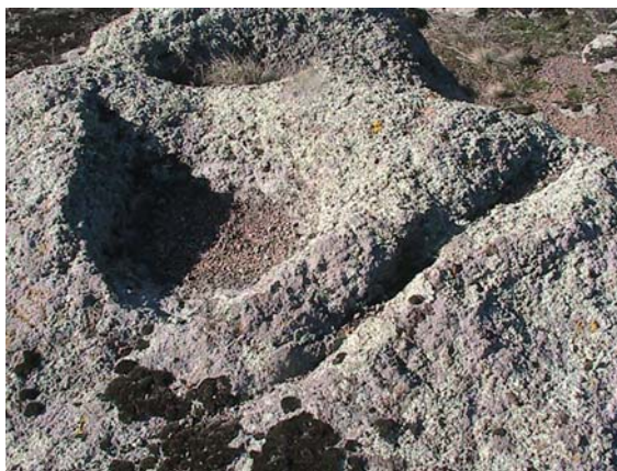
Фото 3. Каменные жертвенники в виде чашечных углублений в Лагозиной балке предместья пос. Донское.