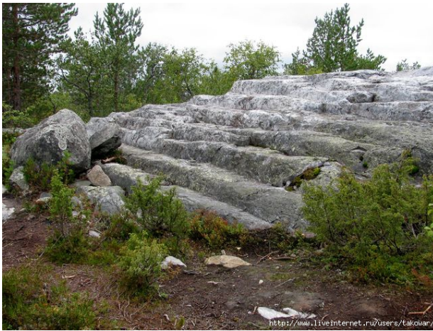
Фото 12. Ступени на горе Воттоваара