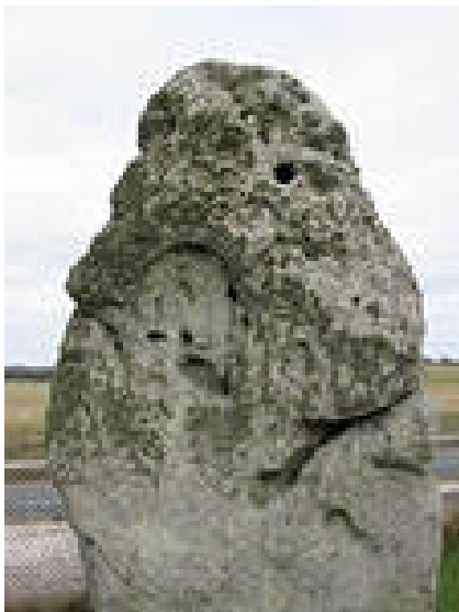
Фото 14. Менгир из кольского Полуострова.

Вот еще один пример похожих артефактов находящихся за тысячи километров друг от друга. А именно, менгир, обнаруженный на Кольском полуострове (см. фото 14), и менгир, обнаруженный нами в окрестности пос. Донское (см. фото 15), ну очень похожи.