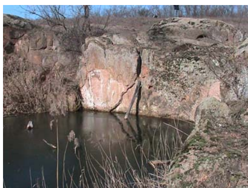
Фото 1. Сейдозеро Ловозёрского горного массива. Фото 2. Озерцо в Лагозиной балке пос. Донское