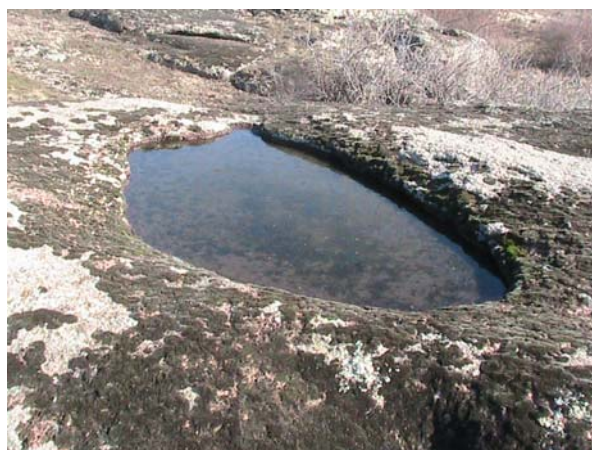
Фото 23. Жертвенник в виде наконечника в 2-х км. от петроглифа в окрестностях пос. Донское.

Интерес представляет и способ установки менгиров на наклонной поверхности скал. Так, проанализировав порядок установки сейдов на наклонной поверхности в пределах Кольского полуострова (см. фото 24), мы столкнулись с таким же способом установки, но уже менгира, на вершине наклонной поверхности каменного мегакомплекса по близости с. Анадоль (см. фото 25). Из обеих фотографий усматривается, что остов камня, с низу как бы стесан в виде своеобразной дуги, а сам камень стоит на трех точках опоры (треножнике). Причем, технология установки данных каменных сооружений на Кольском полуострове и в окрестностях пос. Донское одинакова.