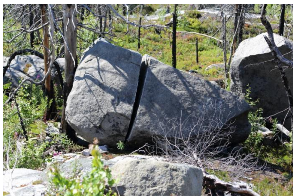
Фото 6. Распиленный мегаблок на горе Воттоваара