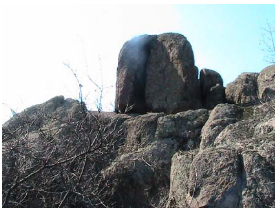
Фото 26. Менгир ниша с. Анадоль

Установленные скалы достаточно велики для обычного менгира, и достигают в высоту 5-6 метров, весят они наверное, не менее 40 тон каждая. Скалы установлены на самой вершине огромного каменного комплекса, в виде ниши, и направлены на восток. Если войти в эту нишу, то дождь, снег, солнце и ветер не будут мешать осуществлять наблюдения (см. фото 26). Интерес представляет и менгир, установленный на одном из возвышений Кольского полуострова, который внешне очень похож на нашу нишу (см. фото. 27).