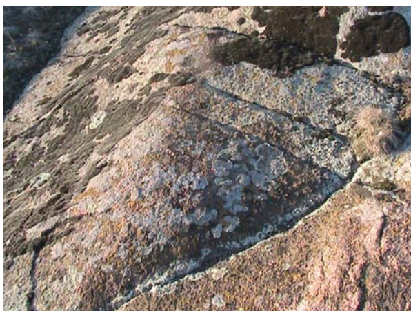
Фото 22. Петроглиф в виде наконечника

Кроме, того недалеко от этой полусферы, на выходящей из земли породы гранита, мы обнаружили петроглиф, по нашему мнению изображающий кремневый наконечник копья (см. фото 22). А в двух километрах от этого места, в районе каменного ящика (о котором речь пойдет ниже), чашечный жертвенник в виде точно такого же наконечника, только больших размеров (см. фото 23).