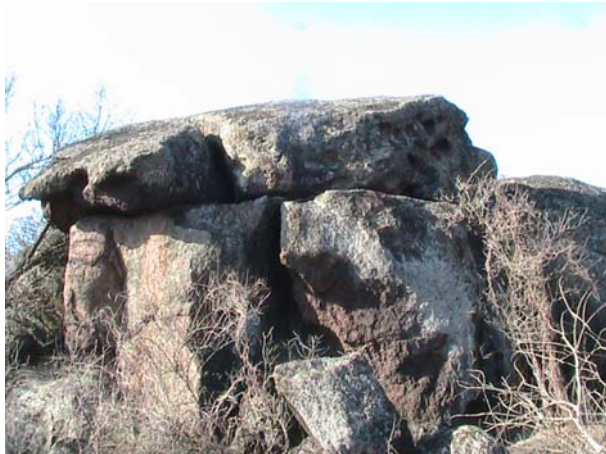
Фото 28. Если присмотреться, то можно увидеть с лева профиль лица, и прямо анфас лица.

там, около 20, размеры они имеют разные, но не менее 15x15 см (см. фото 28). Если смотреть на одну из плит с южной стороны, то конец этой плиты напоминает профиль головы человека (см. фото 29). Вторая плита лежит слева от главной, и имеет размер примерно в три раза меньший, чем основная.