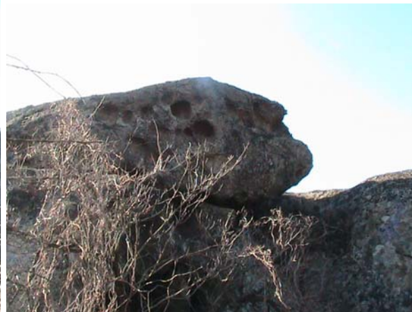
Фото 29. Верхний блок «ящика» напоминает профиль лица человека, там четко видны чашечные углубления.

Если смотреть на конструкцию с низу, то с верху на вас будет смотреть страшный монстр в виде человека с длинным носом и круглыми глазами (см. фото 30).