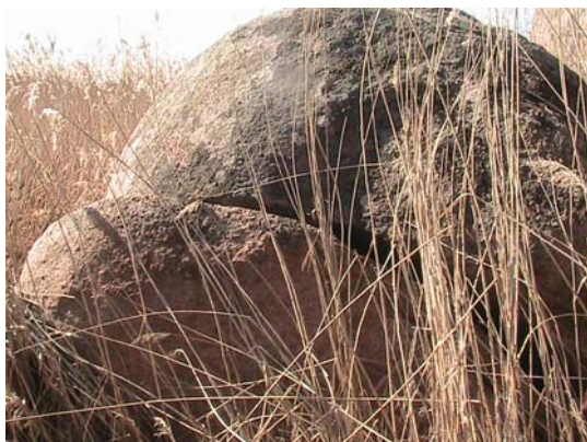
Фото 5. Распиленный каменный овал Лагозина балка пос. Донское.

(треножнике) или на одном, но меньшем по размерам, чем сам валун (см. фото 7). В окрестностях пос. Донское (в прилегающей балке, в которой ранее протекала полноводная река Калка), также имеются различного рода сейды, один из них мы хотим продемонстрировать читателю (см. фото 8).