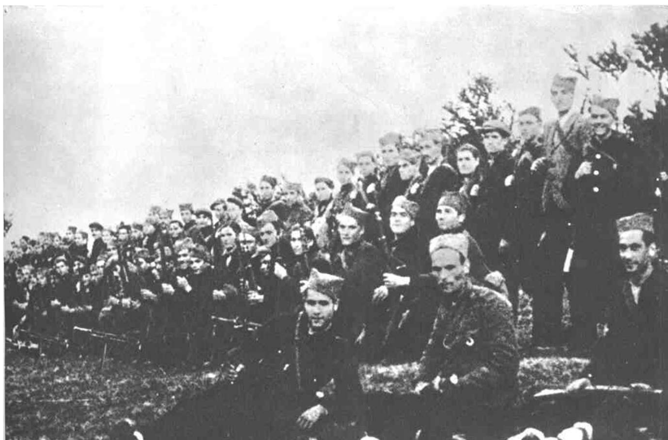
JABLANICKI NOP ODRED S JESENI 1941. GODINE