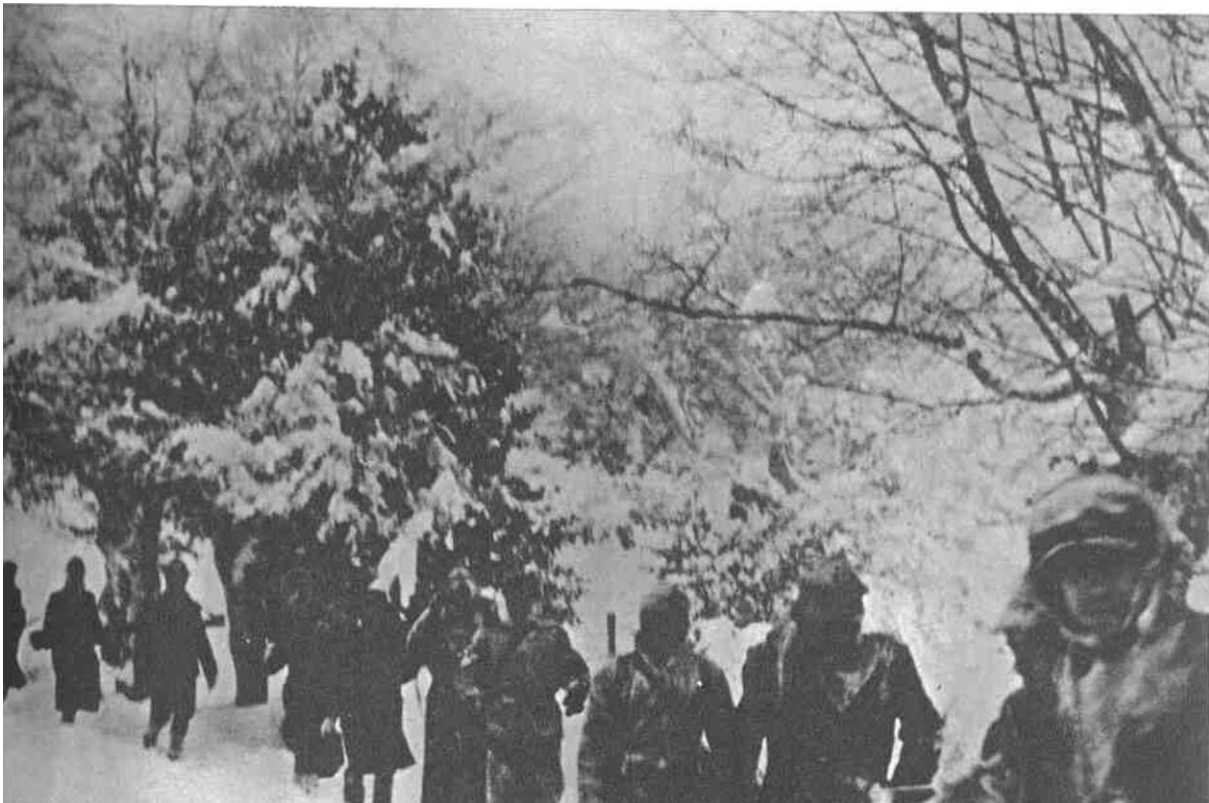
JEDINICE I. MAKEDONSKO-KOSOVSKJE UDARNE BRIGADE NA MARSU U FEBRUARSKOM POHODU