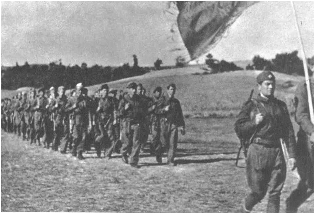
JEDINKI : MAKEDONSKE BRIGADE U REJONU I'KILEPA OKTOBRA 1944. GODINI: