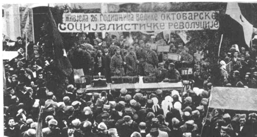
NARODNI ZBOR U HUE VLJIMA POVODOM PRO SLAVE 26 GODIŠNJICI OKTOBARSKE REVOLU- CIJE, NOVEMBRA 1943