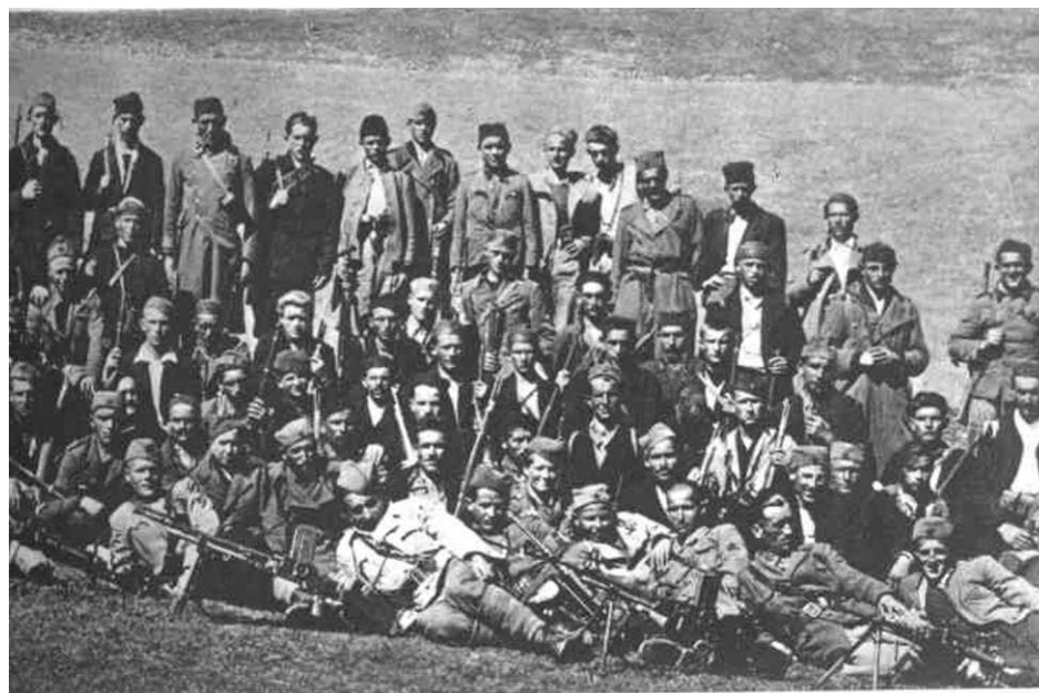
BJELOPOLJSKI PARTI- ZANSKI BATALJON NAKON FORMIRANJA. SRE DINOM 1943 GODINE