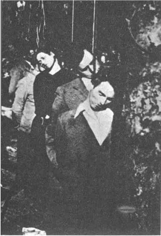
NEMACKI ZLOČIN U PANČEVU U LETO 1941 GODINE