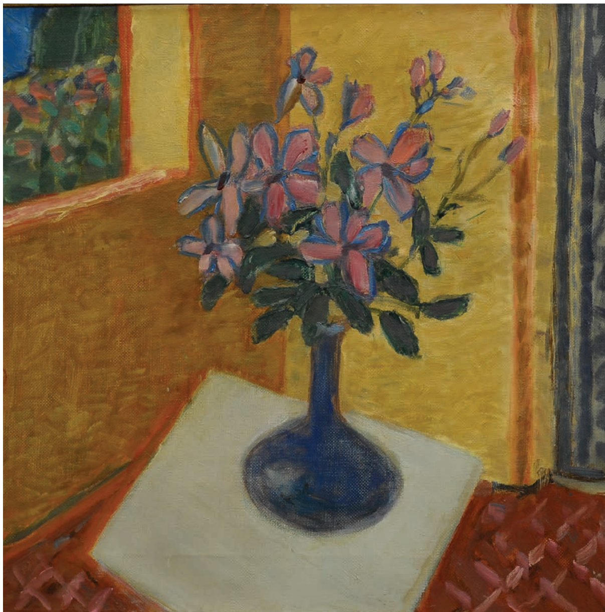
Юлия ГОРСКАЯ. Египетский букет. 2009. Холст, масло