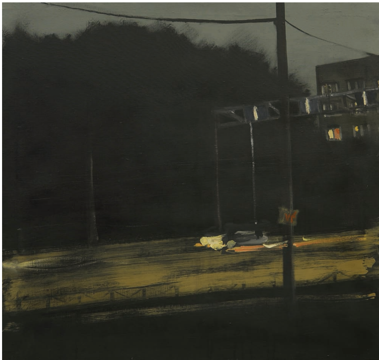
Илья ОРЛОВ. Огни. Из серии "Пр. Ветеранов". 2009. Холст, акрил, темпера