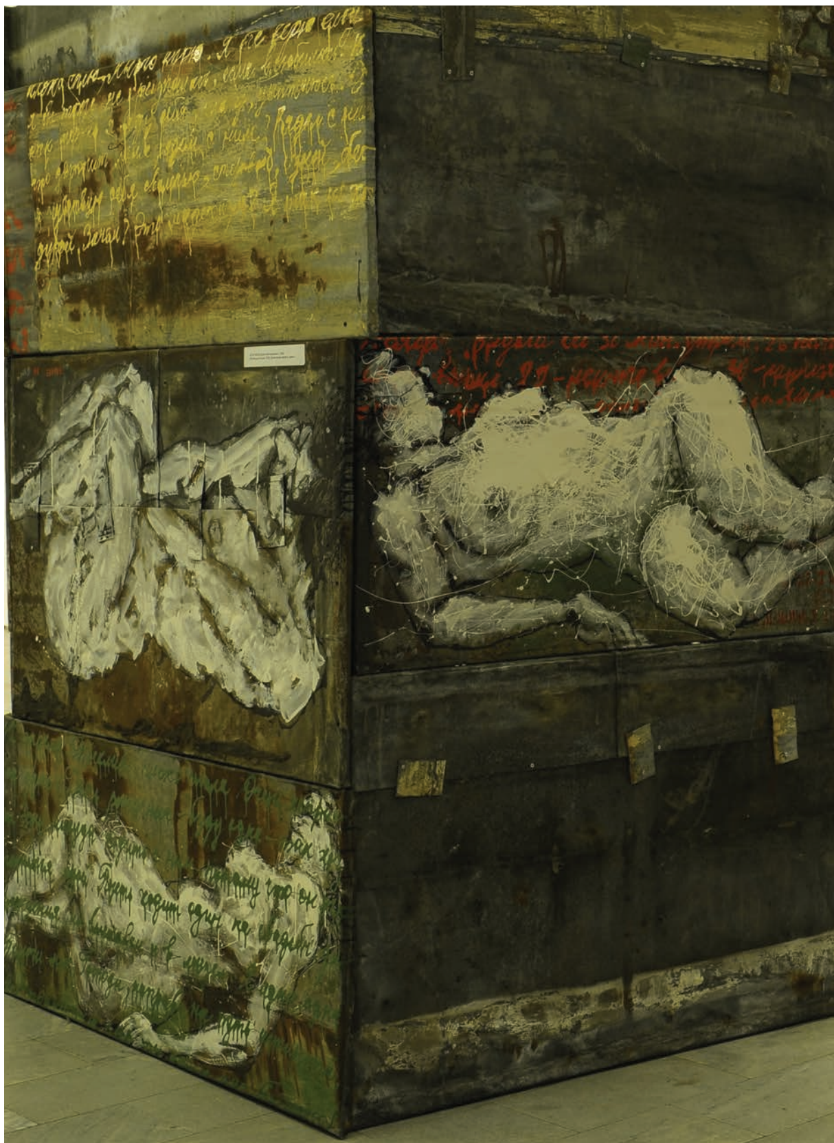
Юрий ШТАПАКОВ. Интимные письма. 2009. Инсталляция