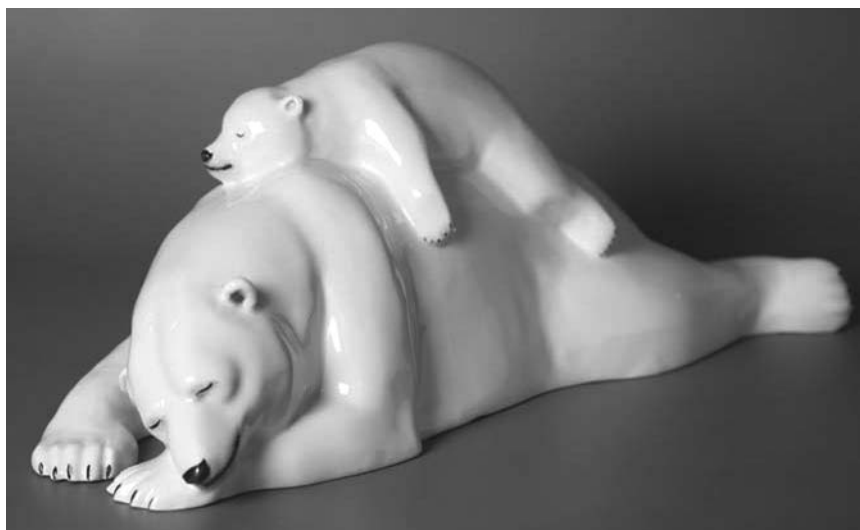
Марина НИКОЛЬСКАЯ Медведица с медвежонком 2009. Фарфор, надглаз. росп.