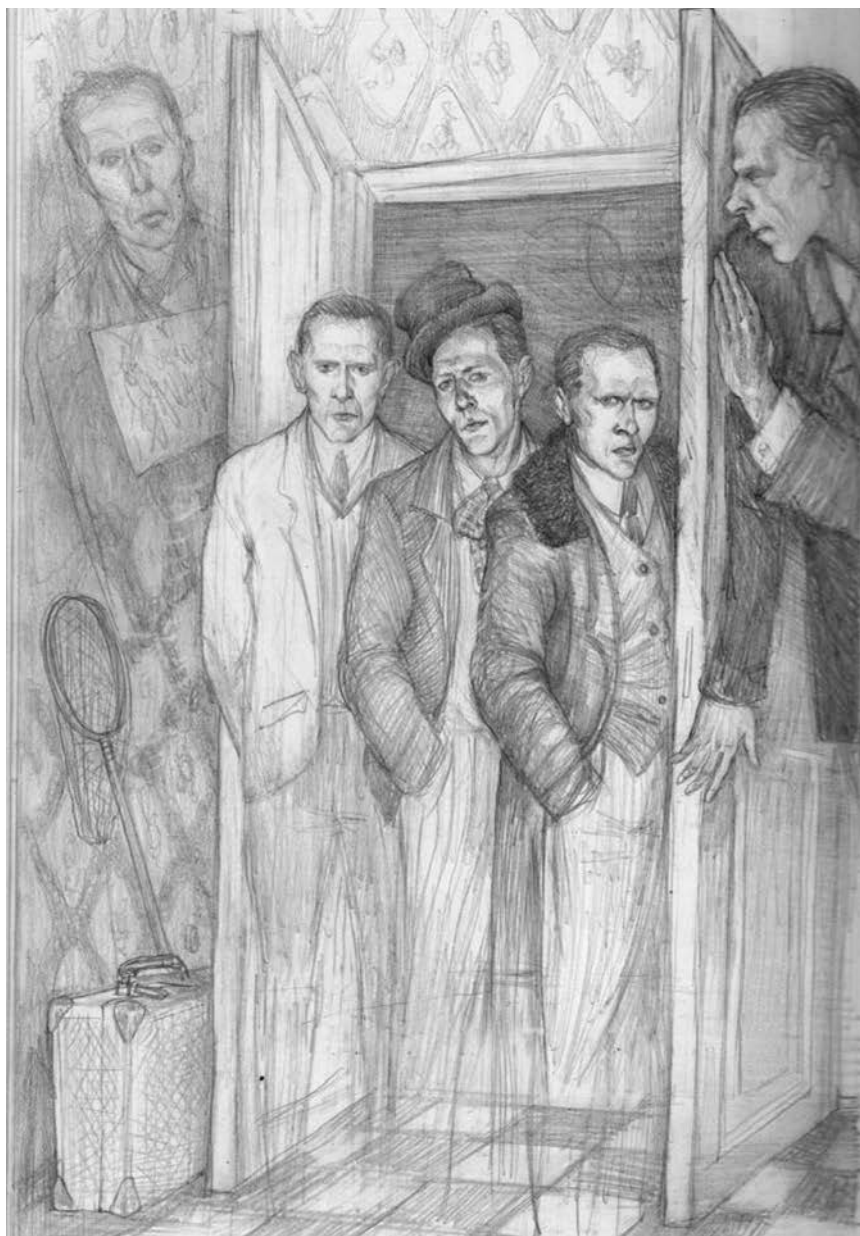
Юлия ГОРБАНЬ. Хармс. "Случай" 2009. Б., карандаш