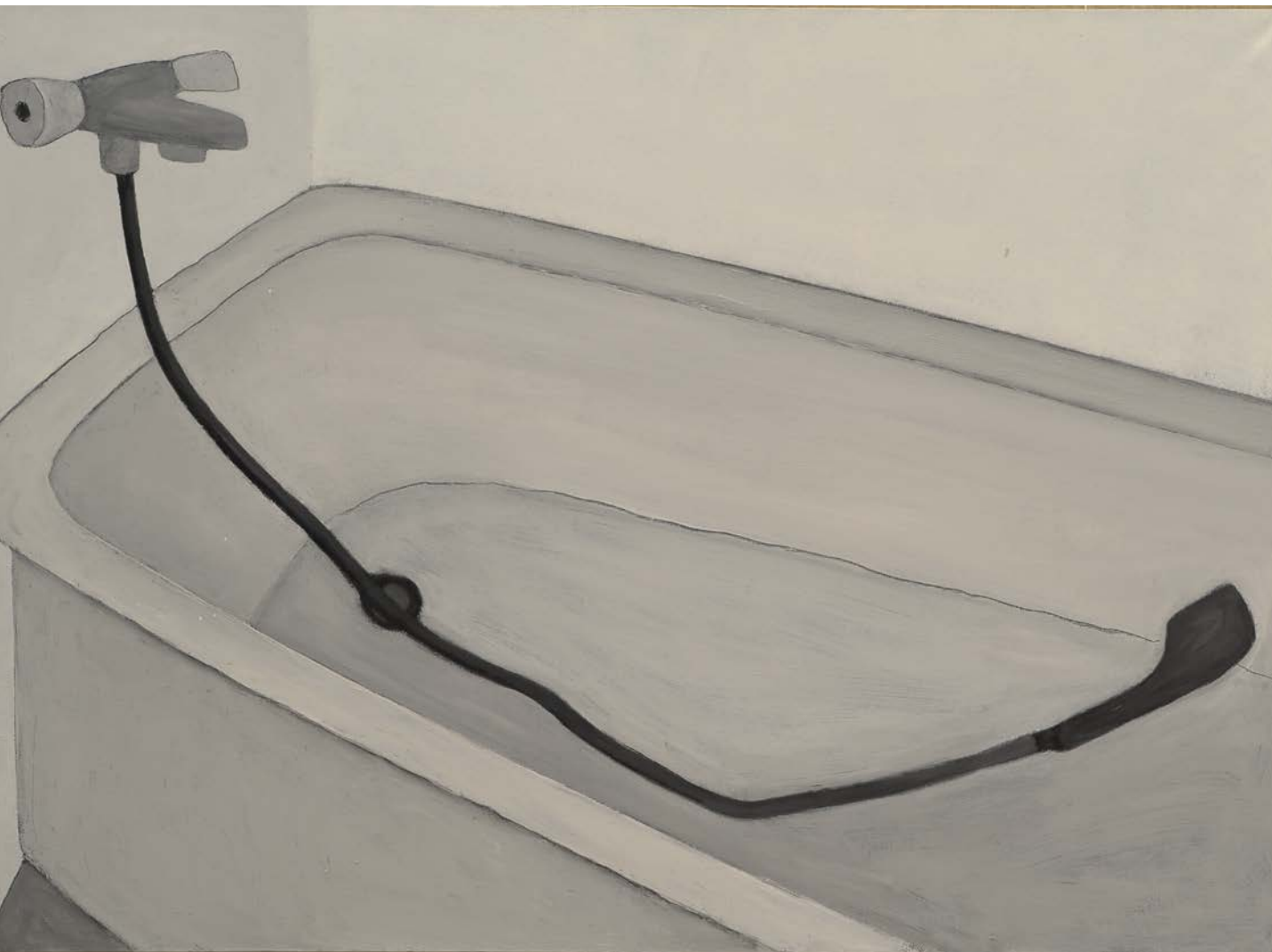
Анна ЖЕЛУДЬ. Ванная. 2009. Холст, масло