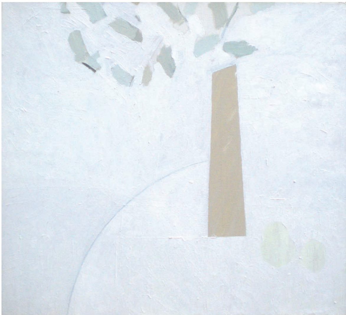
Владимир ГАРДЕ. Букет. 2009. Холст, масло