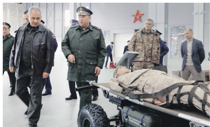
Министру обороны Сергею Шойгу показали новую технику, в том числе броневик для спецназа (17 апреля, парк «Патриот»)

Владимир Путин потребовал быстрее завершить все необходимые действия для ввода в строй второй очереди космодрома «Восточный». «Нужно всё сдавать и оформлять документы, нечего бояться. Всё работает, всё нормально. Надо довести до конца», — сказал он.