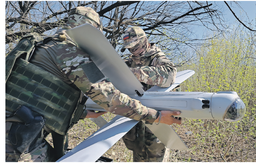
Дмитрий Астрахань / Известия

Разведчики выслеживали «Абрамс», обнаруживали места их стоянок, заправок и маршруты передвижения. 02 →