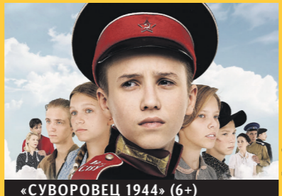
«СУВОРОВЕЦ 1944» (6+)

«Суворовец 1944» — ещё один пример того, что региональное кино активно про- рывается в большой прокат. Сценарий