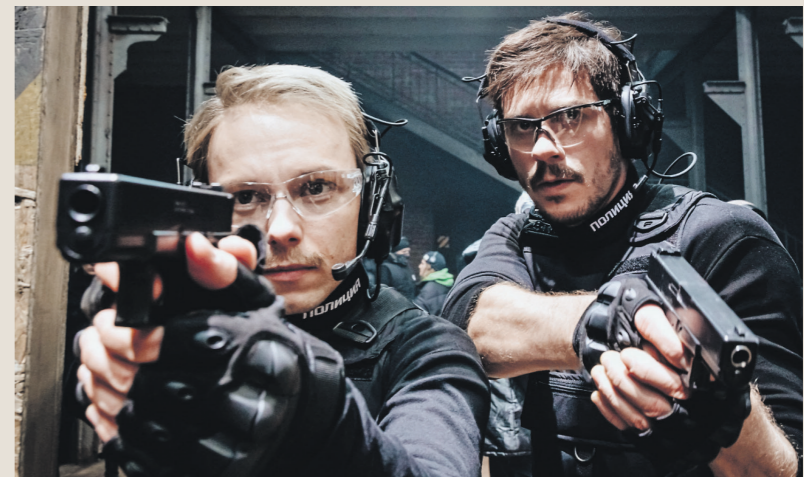
Первый квест, скорее всего, будет посвящён фильму «Майор Гром»

— Например, в московском «Союзмультпарке» можно посетить нору Кролика из «Винни Пуха» или же попрыгать по крышам с Карлсоном. Также у «Союзмультфильма» был опыт создания квеста. В 2021 году начал свою работу квест на основе мультсериала «Приключения Пети и Волка» — проекта для подростковой аудитории, построенного на сочетании современных реалий Санкт-Петербурга, народного фольклора, литературных произведений и хорошего чувства юмора. В пространстве вагона-контейнера было представлено несколько тематически оформленных комнат, где посетители помогали героям разгадывать загадки, — поделился с «Ивестиями» в «Союзмультфильме».