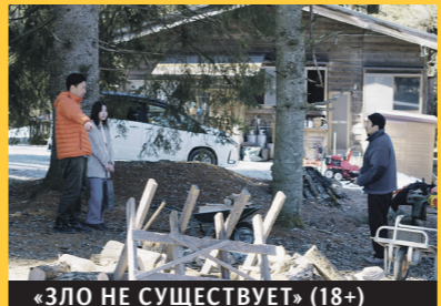
«ЗЛО НЕ СУЩЕСТВУЕТ» (18+)

Гармоничная жизнь деревушки вблизи Токио с чистой родниковой водой и заповедным лесом под угрозой. Столичный магнат задумал построить на этом месте глэмпинговый комплекс. Участок куплен, потенциальная прибыль просчитана. Осталась формальная встреча с теми, чья жизнь в посёлке тесно связана с его уникальными ресурсами. Натиску капиталистов природа сопротивляется вместе с жителями этого уловного анклава. Фильмы Хамагути медитативные и аскетичные, но всё же требующие вы-