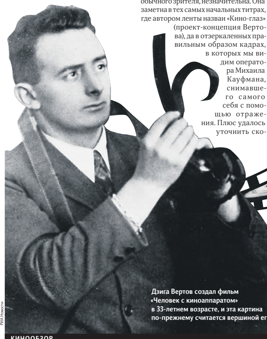
Дзига Вертов создал фильм «Человек с киноаппаратом» в 33-летнем возрасте, и эта картина по-прежнему считается вершиной его творчества