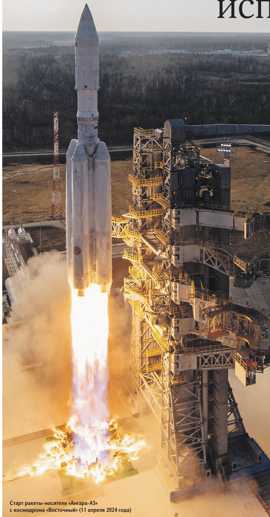
Старт ракеты-носителя «Ангара-А5» с космодрома «Восточный» (11 апреля 2024 года)

«Ангара» — семейство российских ракет-носителей от лёгкого до сверхтяжёлого класса. Они имеют унифицированную конструкцию и оснащены экологически безопасными жидкостными кислородно-керосиновыми двигателями. Носители различаются количеством универсальных ракетных модулей (УРМ). Так, лёгкая «Ангара-1.2» состоит из УРМ-1 с двигателем РД-191 на первой ступени и УРМ-2 с двигателем РД-0124А на второй. Она способна вывести в космос до 3,5 т нагрузки. Тяжёлая «Ангара-А5» имеет пять УРМ-1 на первой ступени, один УРМ-1 — на второй и один УРМ-2 — на третьей. Её грузоподъёмность — до 24,5 т. Также разрабатывается модернизированная версия «Ангары-А5М», которая сможет вывести на низкую околоземную орбиту до 27,5 т, и сверхтяжёлая модификация — «Ангара-А5В» грузоподъёмностью 37,5 т.