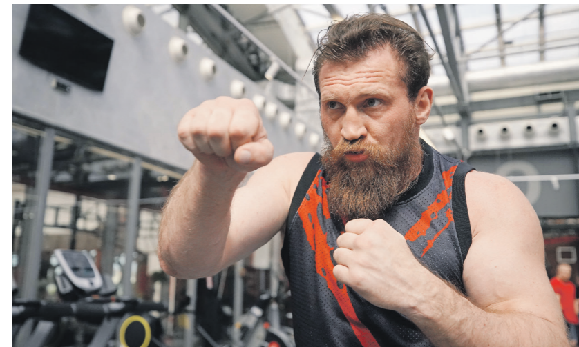
Эксперты отмечают высокую зрелищность поединков Дмитрия Кудряшова