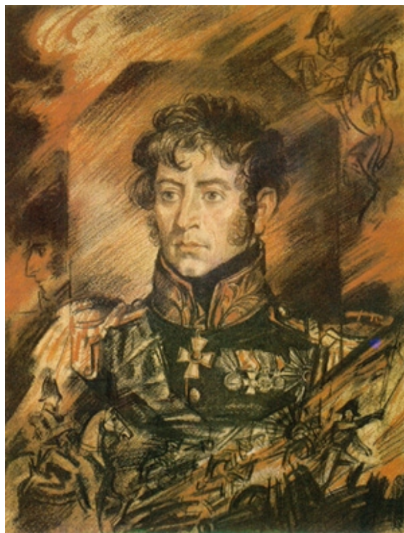
Ю. Иванов. Милорадович