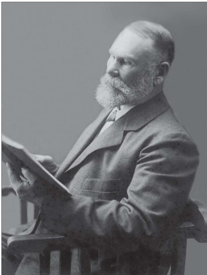
СТЕПАН ДМИТРИЕВИЧ ЯХОНТОВ (1853 –1942)