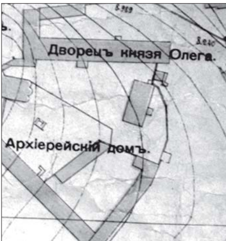
Илл. 1. План г. Рязани 1909 г. В.Н. Галактионова (фрагмент). Подробный нивелирный план губернского города с примечаниями межевого и главного городского инженеров, цветной, выпущен в типографии В. Рихтера в Москве. РИАМЗ. КП-15512

Если стоять на позиции историзма и терминологической корректности, исключительно важно проводить различие – «Архиерейский дом» и здание современного Дворца Олега. Помимо того, что Дворец