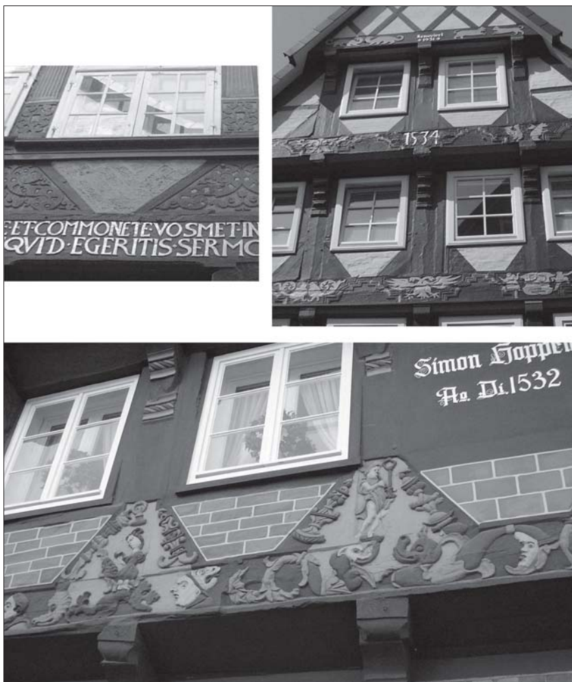
Илл. 4. Фахверковая архитектура Целле