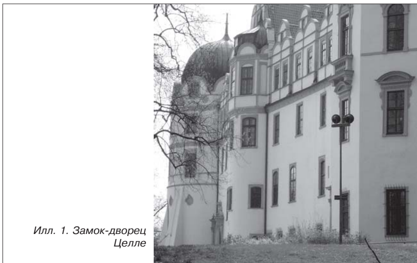
Илл. 1. Замок-дворец Целле

О выставках в немецких музеях в целом можно сказать следующее. На выставке, судя по всему, замкнута практически вся работа средне-статистического немецкого музея, зачастую за счет развития науки, за счет комплексного научного изучения коллекций. В этом смысле российский музей, хочется верить, пока еще могут видеть свое определенное преимущество. Второй момент в том, что приоритет отдается тем из них, которые ориентированы более на концепцию, нежели на объект. Иными словами, большое значение при создании выставок уделяют дизайнерскому оформлению. Теоретической базой подобного подхода является представление о том, что четко продуманное оформление каждый раз должно подготавливать посетителя к неожиданности от встречи с объектами прошлого. Музейные предметы несут дух эпох, не похожих