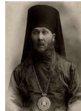
Мефодий, епископ Оренбургский и Тургайский

Возможно, близость к церковным кругам дала возможность Уварову подарить свои ноты новому оренбургскому владыке. Напомним: в дарственной надписи имеется дата — 27 сентября 1914 года. Епископ Мефодий (Герасимов) прибыл в Оренбург двумя месяцами ранее — 30 июля 1914 года. В сентябре он вполне мог инспектировать духовные учебные заведения.