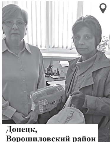
Донецк, Ворошиловский район

Жизнь прожить, как известно, не поле перейти. В жизни иногда наступает момент, когда в твоей помощи остро нуждается близкий человек, а помочь нечем. Поэто-