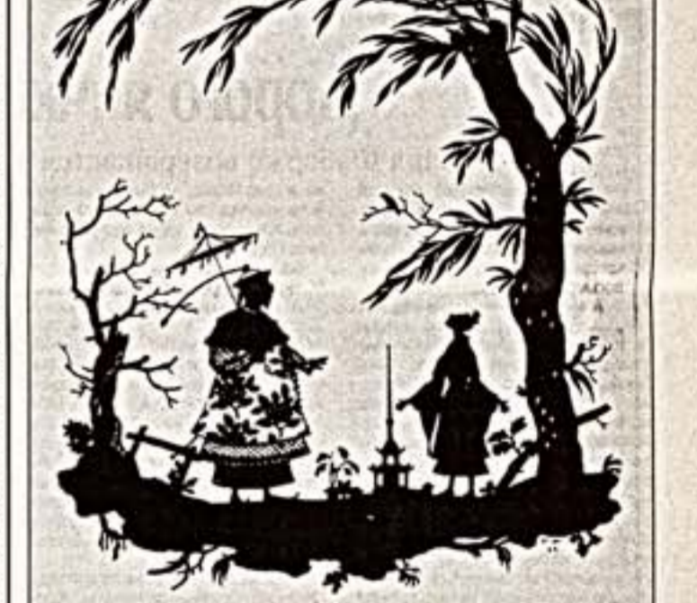
Г. Нарбут. Иллюстрация к сказке Г.-Х. Андерсена "Соловей". 1912 г.