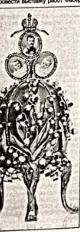
Слева: "Ландыш". Справа: "Коронация"