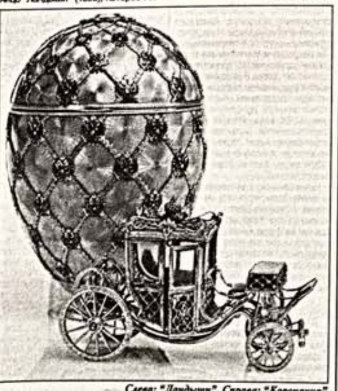
Слева: "Ландыш". Справа: "Коронация"

лила Малого театра три спектакля по А.Н.Островскому - "Трудовой хлеб", "Пугачёв" и "Дань на дне".