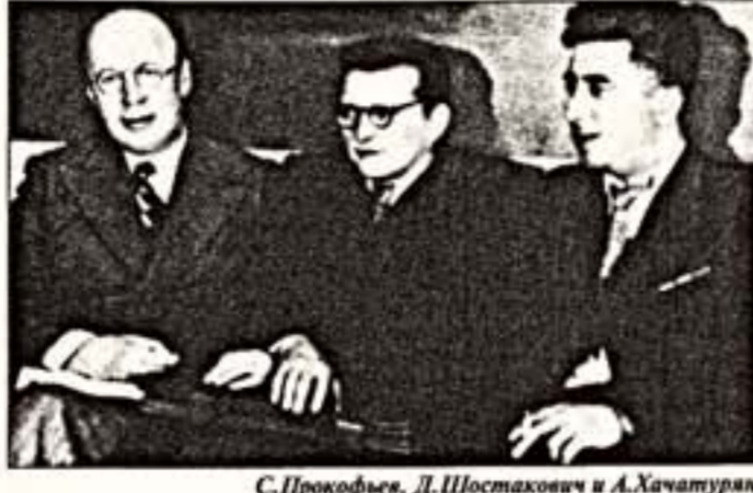
С. Прокофьев, Д. Шостакович и А. Хачатурян

Что такое формализм, или Как готовилось постановление 1948 года