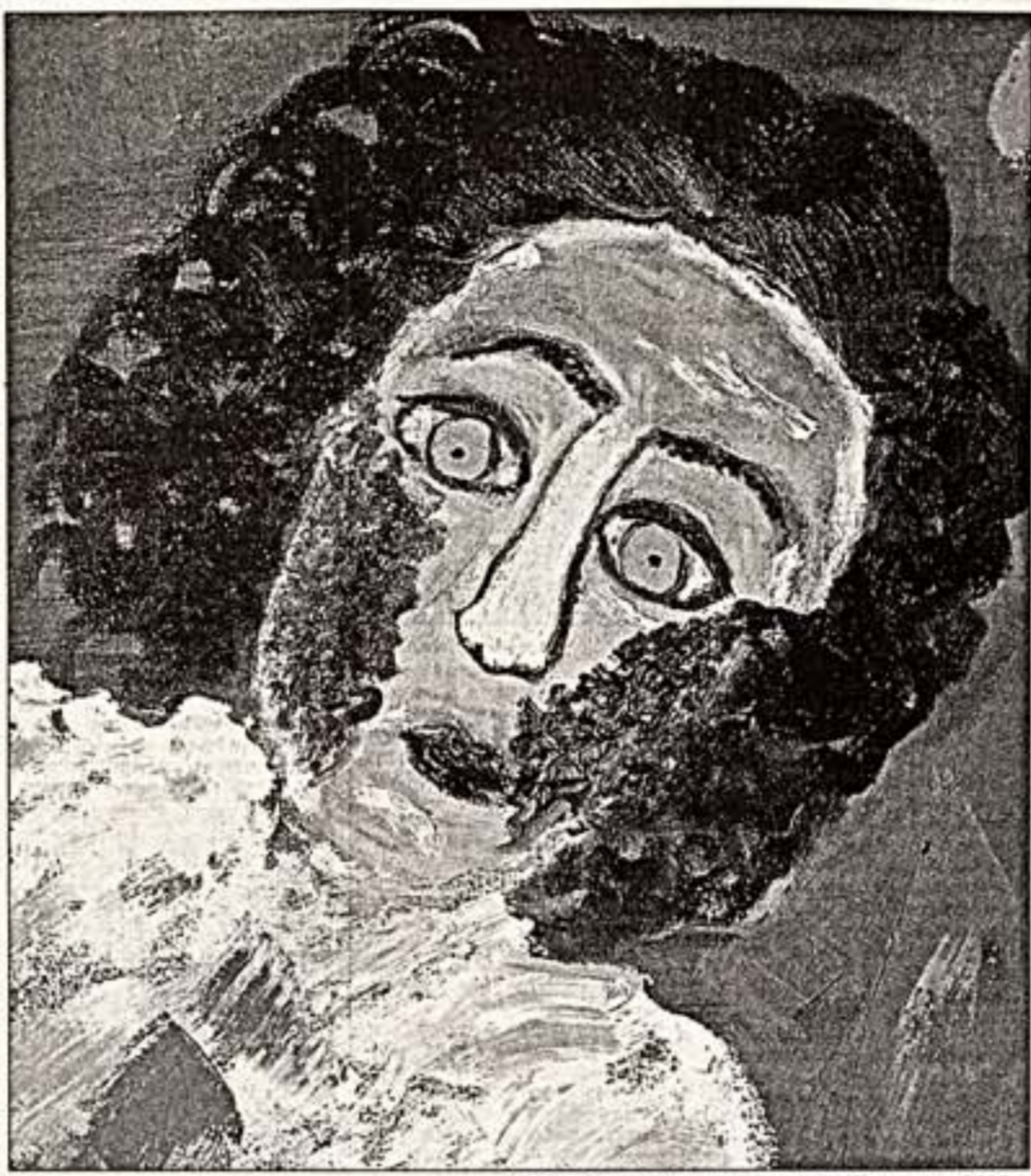
К. Медведева. "Пушкин. Бельмо...". Фрагмент. 2001 г.