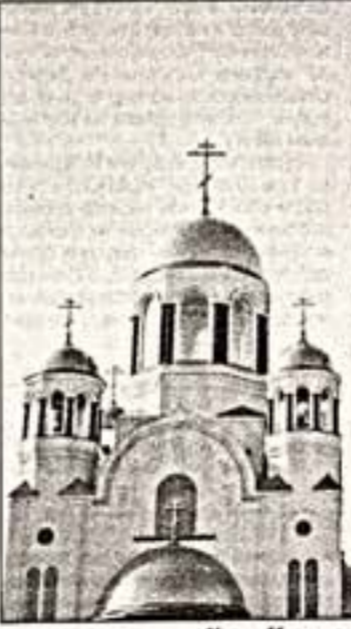
Храм Царственных мучеников в Екатеринбурге

Понятно, что после такой “ноты” просмотр фильма можно было бы благополучно завершить, потому что обещанная “великая тайна” уже раскрыта, а ничего более таинственного в России, чем “заговор” против нее “вольных камнезаказов”, быть не может.