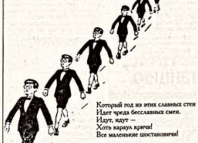
Который год из этих славных стен Идут черда бесславных стен...