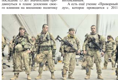
Сотни грузинских военнослужащих прошли боевую обкатку в Афганистане.

Что же касается Грузии, которая, напомним, является единственной страной Закавказья, граничащей со всеми регионами российского Северного Кавказа от Краснодарского края до Дагестана, то здесь ситуация иная. Штаб-квартира Североатлантического альянса удалось за последние 15 лет значительно продвинуться в плане усиления своего влияния на внешнею политику