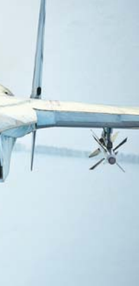
В плановом порядке идёт обновление авиапарка ВКС.