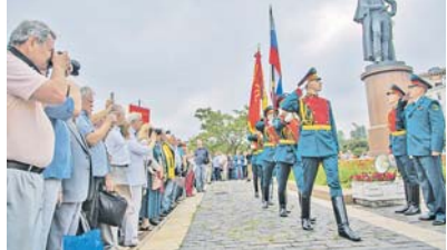
Торжественный вынос знамён в честь юбилея ТВОКУ.

по случаю 100-летнего юбилея ТВОКУ в Москве. На построении выпускников училища, которое состоялось на Суворовской пло-