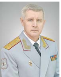
Генерал-майор Игорь КОЛЕСНИКОВ.

Значительно повышают требования к подготовке специалистов наших подвижных подразделений опасные условия перевозимых боеприпасов, а также условия выполнения боевой задачи, когда воздействие противника и разрушения в результате боевых действий дорожной инфраструктуре требуют от личного состава подразделений транспортной транспортировки высочайшего уровня водительского мастерства, навыков самостоятельного выполнения задач боевого обеспечения, а также умения выполнения технологических операций по погрузке и