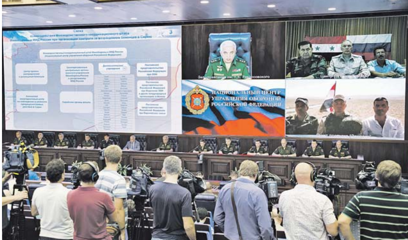
Вырабатывается стратегия координации действий в Сирийской Арабской Республике.

вместо с российским Центром по примерно равной доли сторон практически завершена работа по определению возможности размещения беженцев на территории страны. По предварительной оцен-