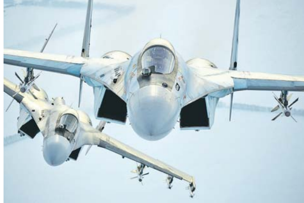
В плановом порядке идёт обновление авиапарка ВКС.

В дополнение к трём новым боевым кораблям, о которых в начале заседания сообщил министр обороны, в состав Военно-морского флота в этом году приняты два судна обеспечения и один фрегат.