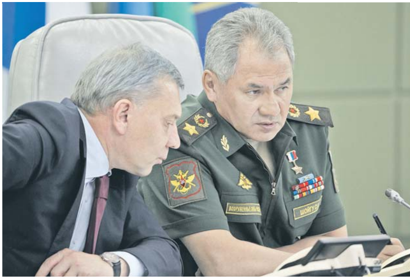
В ходе обсуждения приоритетных задач Единого дня приёмки военной продукции.

Что касается объектов капитального строительства, то, по