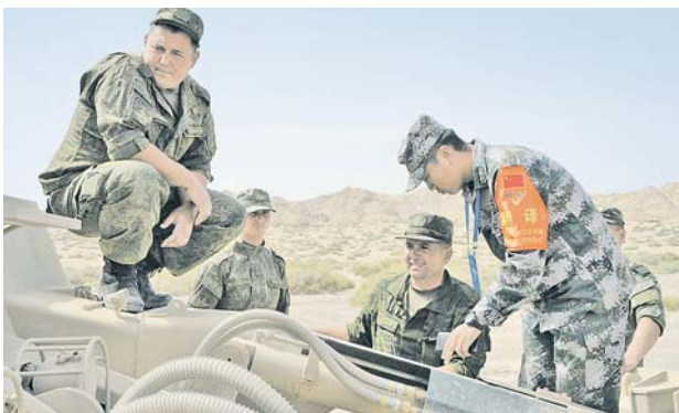
Полигон Корла (КНР)

зационном уровне. После торжественного приветствия провучал Российской гимн, во время исполнения которого солдаты почетного караула армии Китая подняли флаг Российской Федерации.