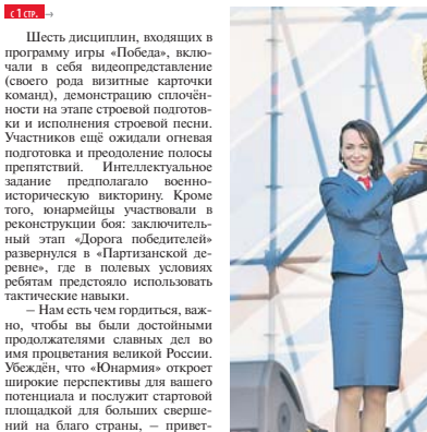
Вручение Кубка выигравшей команде из Волгоградской области.

Шесть дисциплин, входящих в программу игры «Победа», включали в себя видеопредавление (своего рода визитные карточки команд), демонстрацию сплочённости на этапе строевой подготовки и испытания участников в реконструкции боя: заключительный этап «Дорога победителей» развернулся в «Партизанской деревне», где в полевых условиях ребятам предстояло использовать тактические навыки.