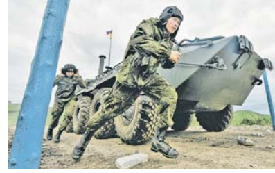
Идёт отработка нормативов на местности.

На всех этапах подразделения будут действовать в сложной обстановке, имитирующей огневое и химическое воздействие противника, минирование местности