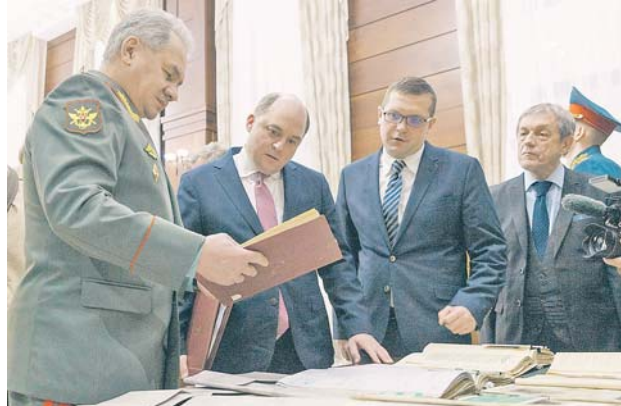
Сергей Шойгу и Бен Уоллес в ходе встречи в Минобороны России.