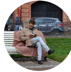
Борис Д. Оруэлл «1984»