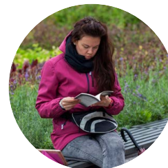
Динара С. Сонтаг «Смотрим на чужие страдания»

Цитата: «видимое обидимое невидимое неврдимое всякое и обратимое забродившее в воздухе задержавшееся в пути зажатое в зубах словodelo словодерево одеревеневшее одержавшее неодержавленное удержавшееся на весу хранимое в тайных»