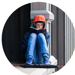
Иван С. В. Долинин, Д. Северюхин «Преодоление немоты»

Цитата: «События памяти изменяют то, как мы помним прошлое, воображаем его, говорим о нем. Они перформативны в точном смысле этого слова, но это особый класс речевых актов: они изменяют прошлое. Поскольку это так, к событиям памяти можно применить теорию коммуникативного действия Юргена Хабермаса. Энергия события памяти зависит, во-первых, от его претензий на истинность: воспринимают ли это событие как правдивое описание прошлого? Во-вторых, она зависит от его претензий на оригинальность: воспринимают ли это событие как новое и отличное от общепринятой трактовки прошлого? И в-третьих, она зависит от его претензии на идентичность: считает ли общество данное событие памяти связанным с глубокими уровнями идентичности? Изменяют ли саму идентичность данной группы ее изменившиеся представления о прошлом?»