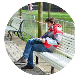
Иван Н. А. Соколов «Мифы об эволюции человека»

Цитата: «Таким образом, распространенное утверждение, будто эволюция человека закончилась, не соответствует действительности. Мы продолжаем меняться.»