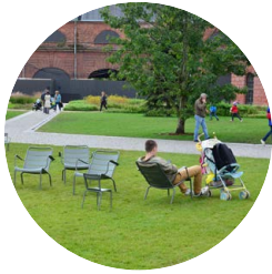
Игорь А. Чехов «Вишнёвый сад»