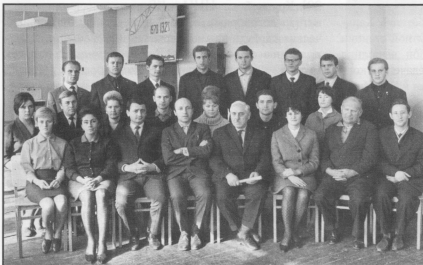
Рис. 6. Сотрудники Проблемной лаборатории судовой холодильной техники и прикладной термодинамики ОИИМФ (1967 г.) вместе с профессором Я.З. Казавчинским (пятый в первом ряду слева направо)

Яков Захарович тяжело переживал отрыв от