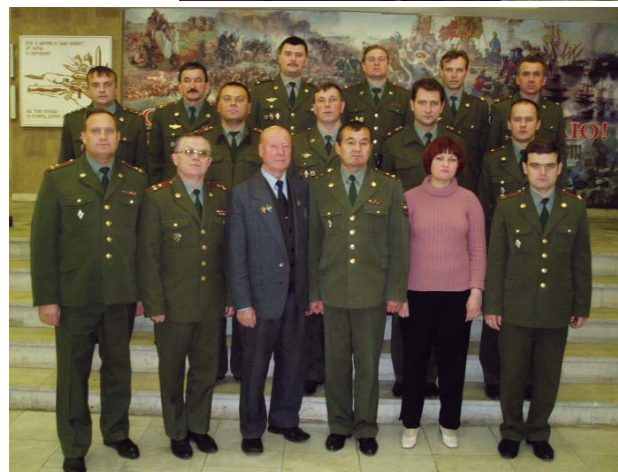
Коллектив кафедры, 2005 год

— Институту-у-ут! Р-р-равняйся. Под знамя — смир-р-рно! Р-р-равнение на — лево! Воздух содрогнулся от звуков "Встречного марша". С левого фланга на плац, печатая шаг, выходит знаменная группа. Алое полотнище Боевого знамени института торжественно плывет над застывшим строем. Степенно, в такт движения знамени колышется российский триколор, который несут следом. Сегодня Пермскому военному институту внутренних войск МВД России — четверть века.