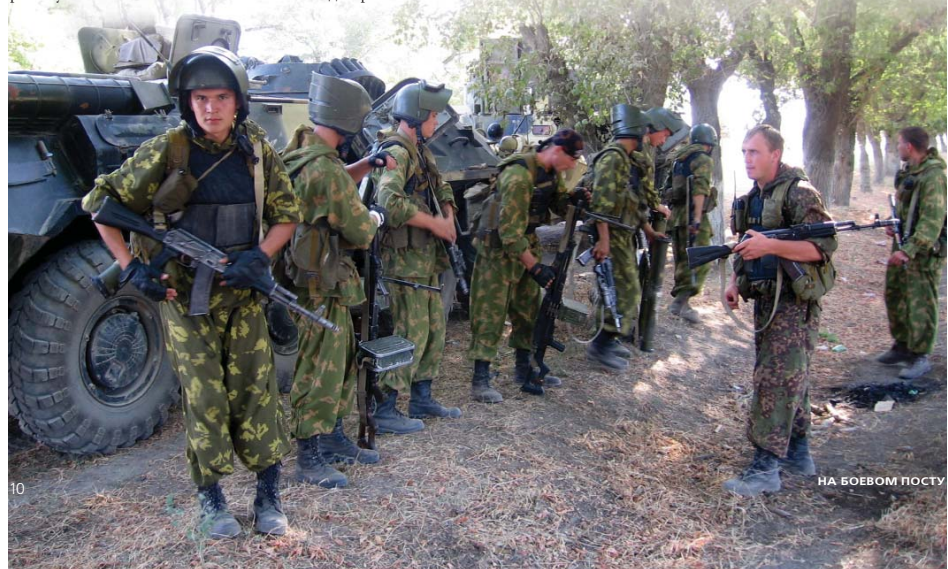
НА БОЕВОМ ПОСТУ

Раззолотила, багрянцем раскрасила осень деревья. По редакционному заданию еду в Тверской специальный моторизованный батальон и, глядя в окно электрички на “пышное природы увяданье”, все думаю: чем прославлена область, где предстоит работать? В подразделении просветили: “Пушкин впервые вышел из Москвы не куда-нибудь, а в Тверь”. Снижал вест в ресторанчике гостиницы Гальяни и особенно душевно едал макароны с сыром. Понравилось Александру Сергеевичу блюдо — родилась рифма: