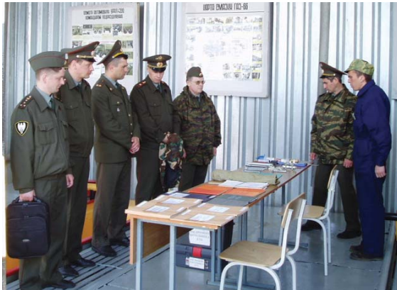
На занятиях по инженерному обеспечению

го искусства. Прорыв в развитии этого важного вида обеспечения внутренних войск не мог не сказаться на образовательном процессе. За относительно короткий срок на кафедре переработали учебные программы, тематические планы, учебно-методические материалы по преподаваемым дисциплинам, перестроили весь учебный процесс в соответствии с требованиями времени.