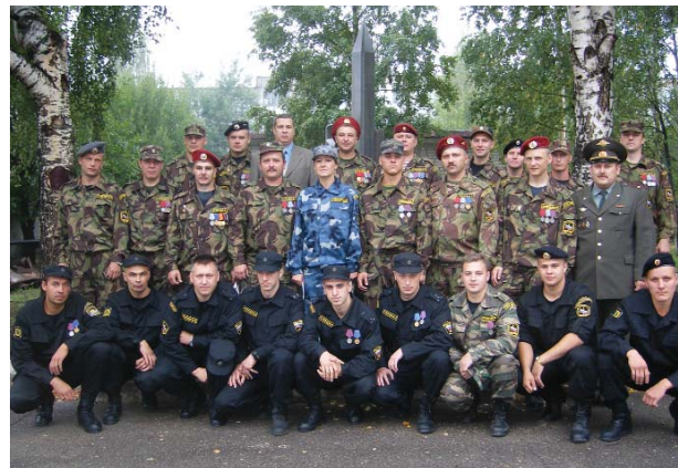
Сотрудники ОМЧН в свой профессиональный праздник — День спецназа. Кострома, 29 августа 2006 г.

Прошло время. В канун нового 2003 года спецназовцы осматривали подвальное помещение в одном из домов в Старых Атагах. По оперативной информации, там находился тайник с оружием. При попытке войти в здание по сотрудникам милиции был открыт плотный огонь из автоматов. Подобрались поближе, один из спецназовцев бросил в подвал гранату. Во время того боя удалось уничтожить нескольких бандитов.