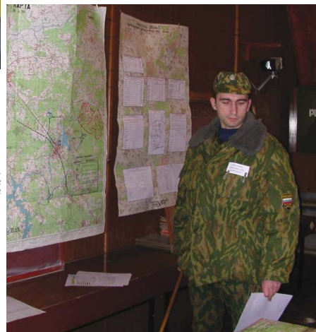
На командно-штабном учении