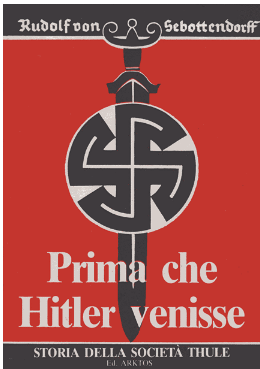
Обложка современного итальянского издания.