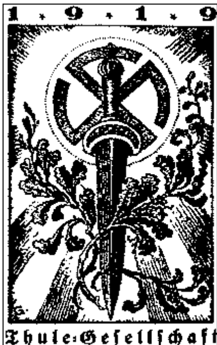
Обложка настенного календаря Thulegesellschaft за 1919 год

(По материалам книг Рудольфа фон Зеботтендорфа "Прежде чем пришел Гитлер" и Мигеля Серрано "Адольф Гитлер, Последний Аватара")