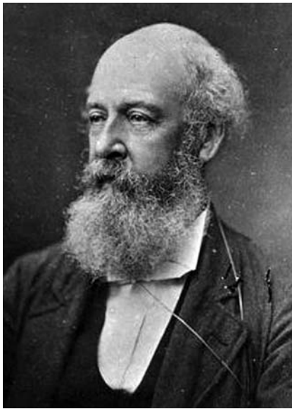
Abb. 1 Portrait von Charles Badham (1780–1845).