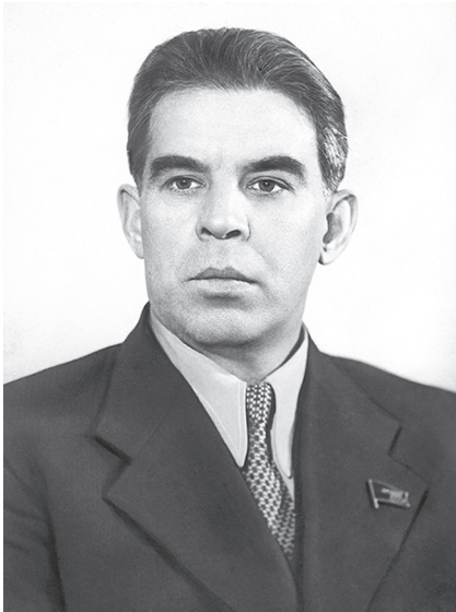
П.С. Попков, первый секретарь Ленинградского обкома и Ленинградского горкома ВКП(б)