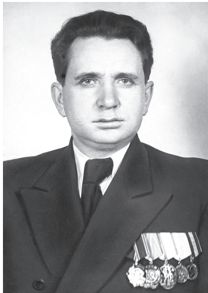
П.Г. Лазутин, председатель Ленинградского горисполкома