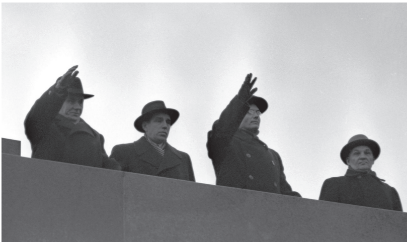
А.Н. Косыгин, А.А. Кузнецов, М.А. Суслов и М.Ф. Шкирятов на трибуне Мавзолея во время празднования 31-й годовщины Октябрьской социалистической революции. Москва. 7 ноября 1948 г.