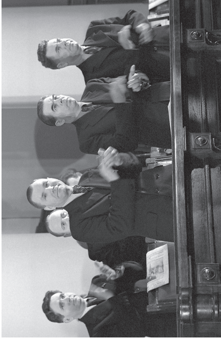
П.Г. Лазутин, Я.Ф. Капустин, П.С. Попков и первый секретарь ЦК ВЛКСМ Н.А. Михайлов в президиуме X Ленинградской областной и VIII Ленинградской городской объединённой конференции ВЛКСМ. Ленинград. Январь 1949 г.