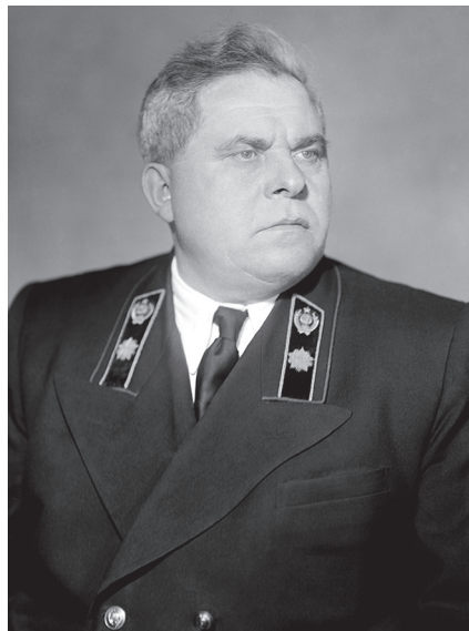
А.Г. Зверев, министр финансов СССР