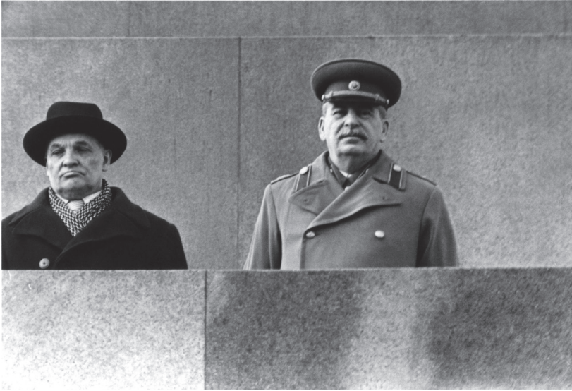
И.В. Сталин и М.Ф. Шкирятов на трибуне Мавзолея во время парада на Красной площади. Москва. 1945–1948 гг.