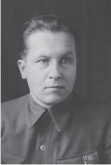
В.М. Андрианов, первый секретарь Свердловского обкома и Свердловского горкома ВКП(б)