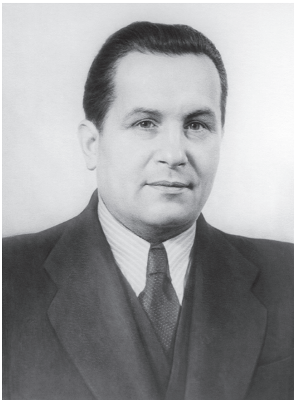
В.М. Андрианов, первый секретарь Ленинградского обкома ВКП(б)