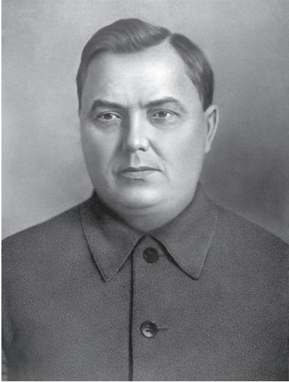
Г.М. Маленков, второй секретарь ЦК ВКП(б), член Политбюро ЦК ВКП(б)