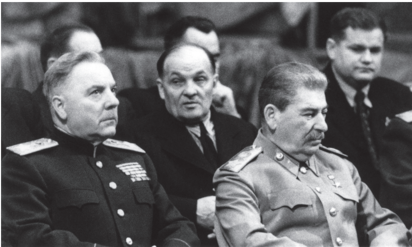
К.Е. Ворошилов, М.Ф. Шкирятов, И.В. Сталин и другие в Большом театре в президиуме торжественно-траурного заседания, посвящённого 25-й годовщине со дня смерти В.И. Ленина. Москва. 21 января 1949 г.