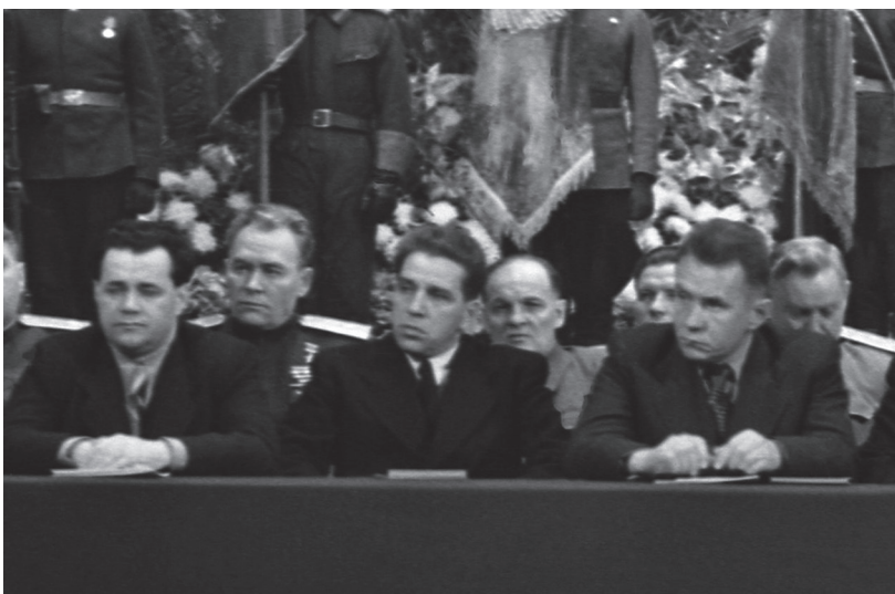
Н.С. Патолитчев, А.А. Кузнецов и А.Н. Косыгин в первом ряду президиума торжественного заседания, посвящённого 29-й годовщине Октябрьской социалистической революции. Москва. 6 ноября 1946 г.