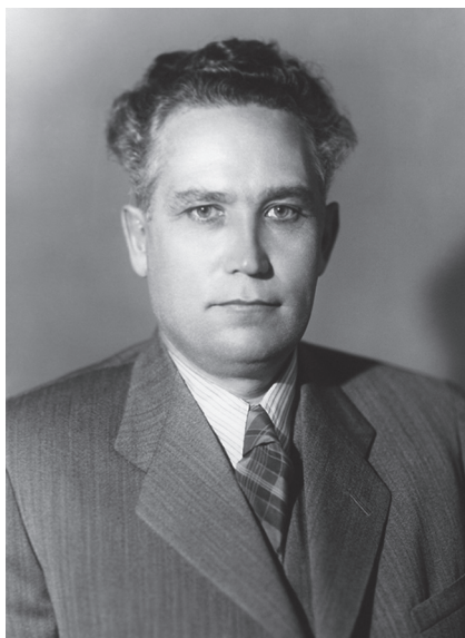
Ф.Р. Козлов, первый секретарь Ленинградского горкома ВКП(б)