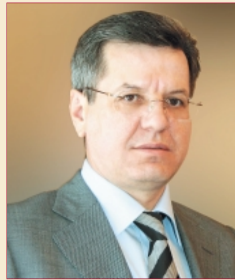
Александр Жилкин, губернатор Астраханской области

В перспективе планируется создание в приграничных зонах Казахстана и России нескольких международных центров приграничного сотрудничества. Выгоды, которые получат казахстанские и российские предприниматели в результате их создания, очевидны. Это, во-первых, упрощение административных процедур, связанных с приобретением и вывозом товаров (таможенное оформление, сертификация, ветеринарный, фитосанитарный контроль и т.д.), во-вторых, возможность открытия производства товаров и услуг с использованием преференций, предоставляемых в соответствии с национальным законодательством, в-третьих, сокращение финансовых затрат, в том числе транспортных издержек.