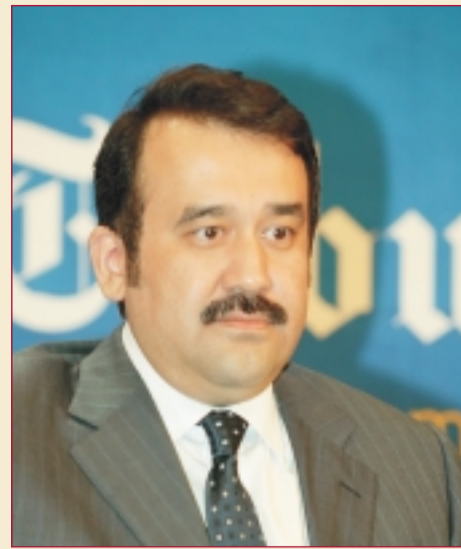
Карим МАСИМОВ, заместитель премьер-министра, министра экономики и бюджетного планирования Республики Казахстан

В своем ежегодном послании народу страны в марте 2006 года Президент Казахстана Нурсултан Назарбаев обратил особое внимание на приоритетность развития сотрудничества с Российской Федерацией: Россия была и остается одним из важнейших стратегических партнеров Казахстана на международной арене, более того — приоритетным партнером, добрым другом и соседом.