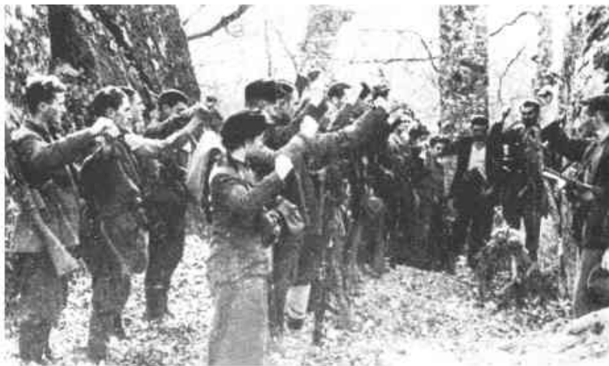
Партизанская клятва. 1943 г.