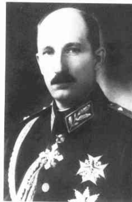
Царь Борис III