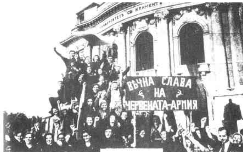
Жители Софии приветствуют Красную армию. Сентябрь, 1944 г.