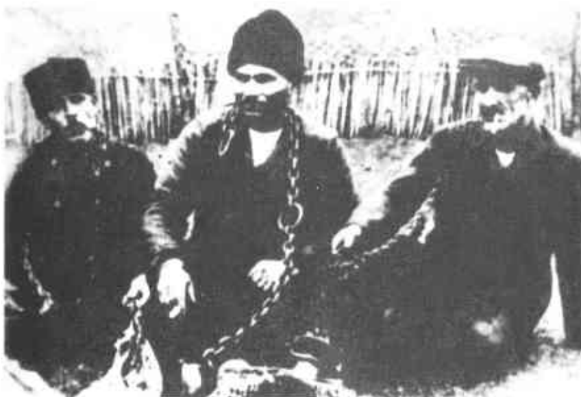
Арестованные крестьяне – участники Июньского восстания 1923 года