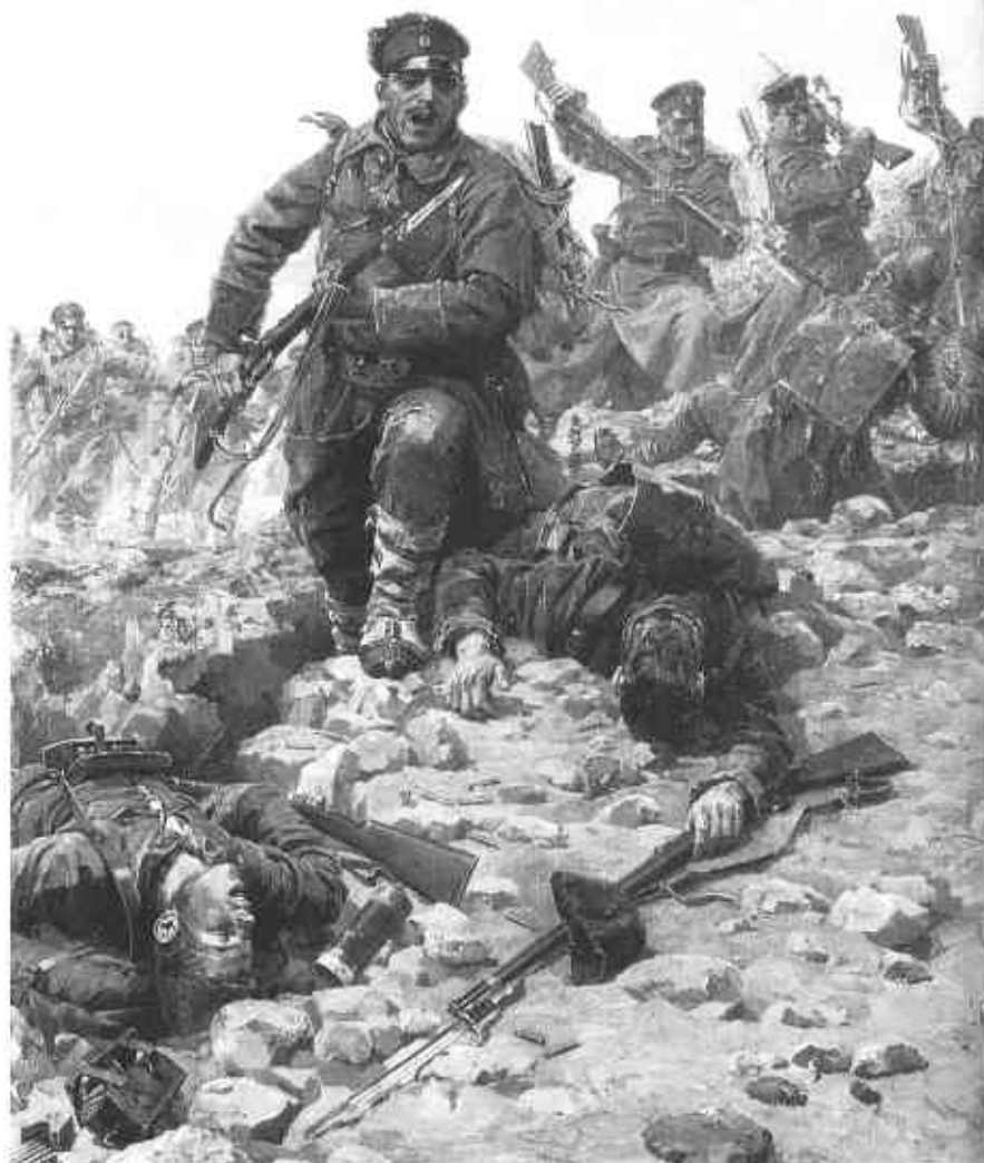
Картина болгарского художника Ярослава Вешина "Атака" (1913 г.)