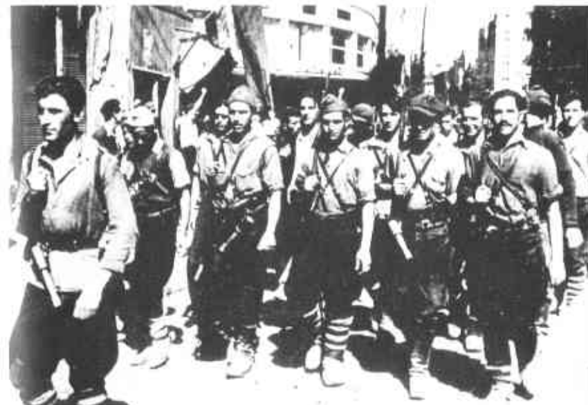
Партизаны спускаются с гор