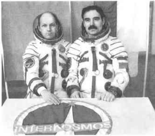
Советско-болгарский космический экипаж: Н. Рукавишников и Г. Иванов. Апрель 1979 г.