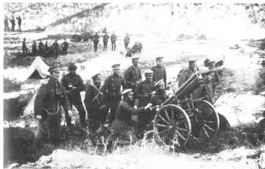
На Салоникском фронте первой мировой войны