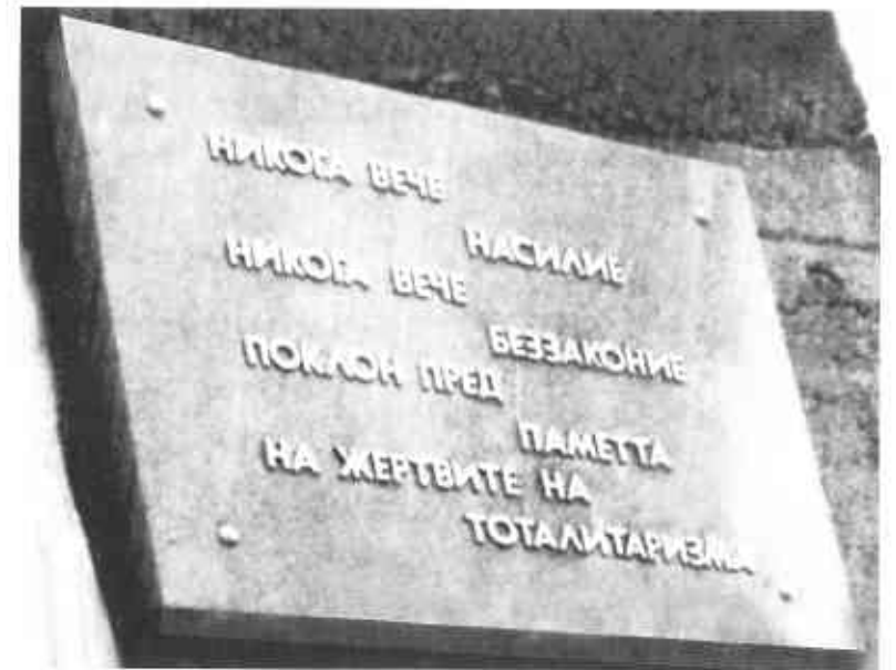
Памятная доска жертвам тоталитаризма. 1990 г.