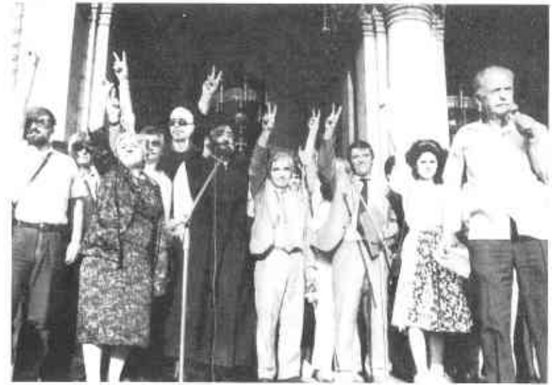
Новая политическая элита (после 10 ноября 1989 г.). В центре – Ж. Желев