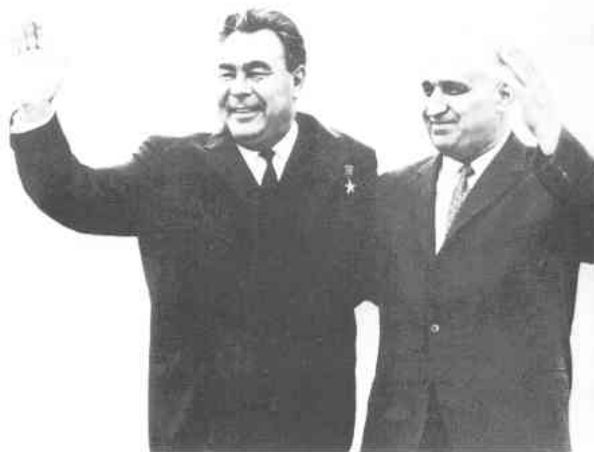
Дружба двух генсеков: Леонид Брежнев и Тодор Живков