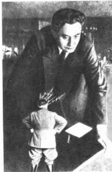
Лейпцигский процесс: Димитров против Геринга (фотоколлаж Джоа Хартфилда)