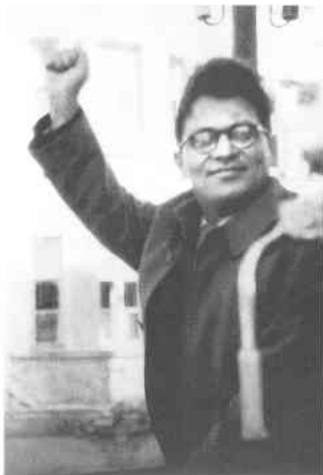
Трайчо Костов на митинге. Ноябрь 1945 г.