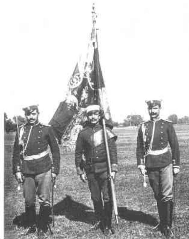
Знамя 21-го пехотного полка. Октябрь 1912 г.