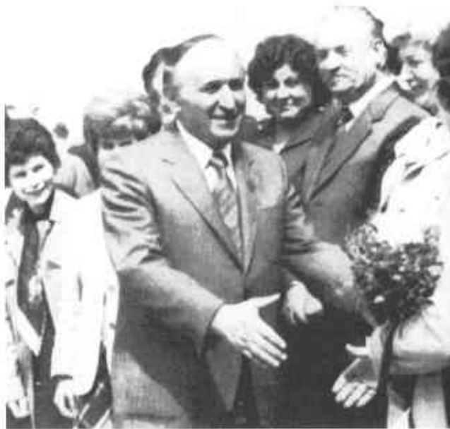
Живков любил "общаться" с народом