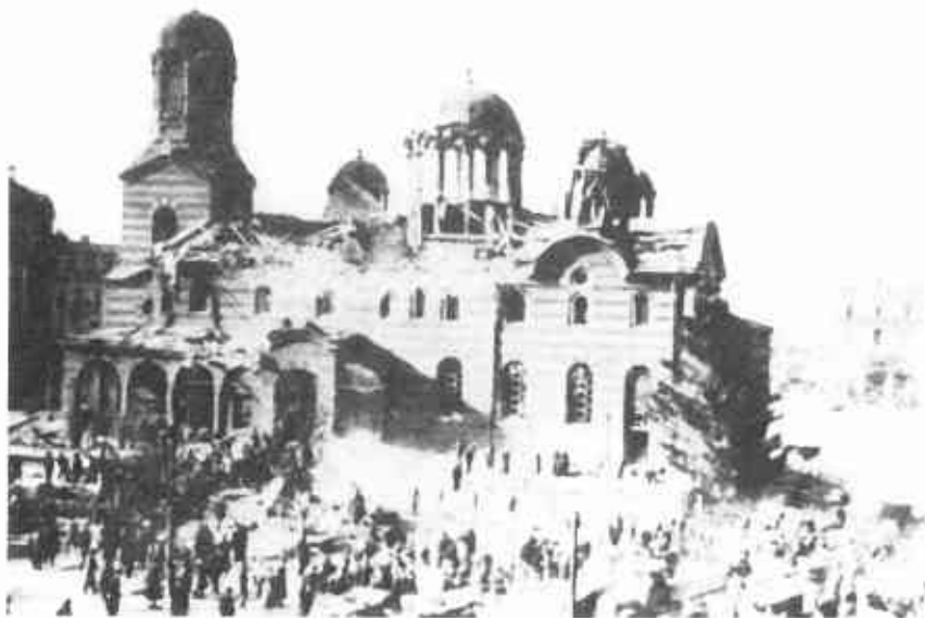
Софийский собор "Святого Воскресения" после удара 16 апреля 1925 г.

Имя Цанкова стало для мировой демократической общественности символом кровавого террора