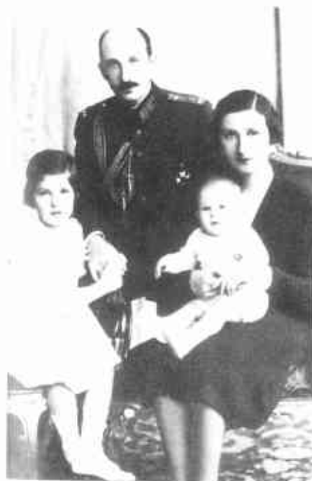
Царская семья: Борис III, царица Иоанна, престопреемник Симеон Тырговский и дочь Мария-Луиза