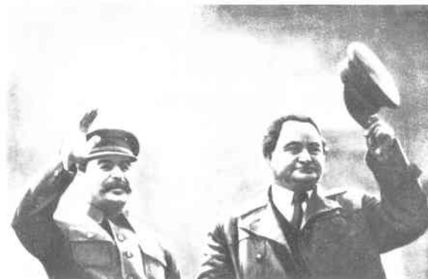
Сталин и Димитров на трибуне Мавзолея Ленина