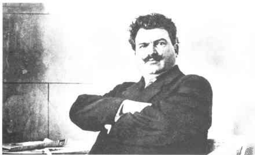
Александр Стамболийский – “земельческий” премьер