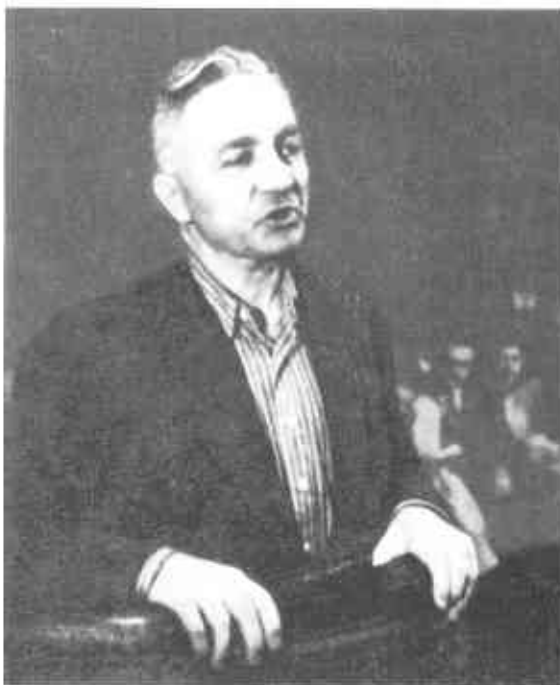
Никола Панков – лидер антикоммунистической оппозиции. Август 1947 г.