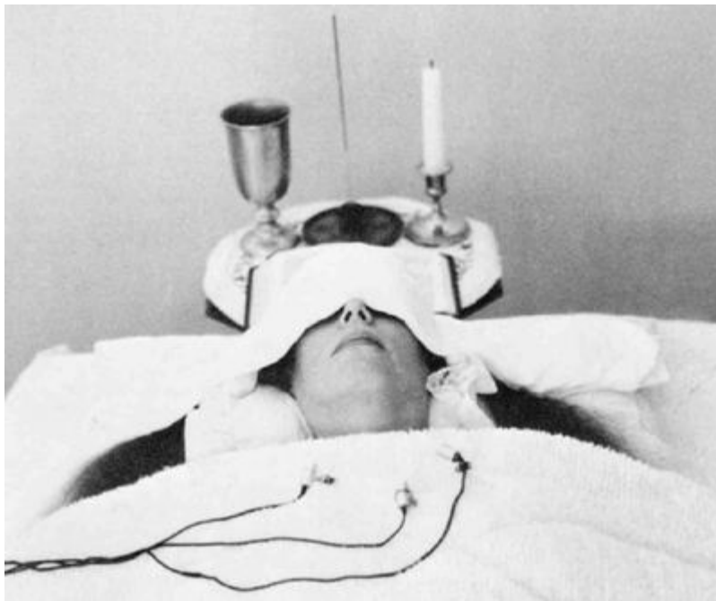
Ра, сеанс 2, 20 января 1981 года: "Инструмент укрепило бы белое одеяние. Инструмент должен быть укрыт, лежать ничком, глаза накрыты белым". 9 июня 1982 года.