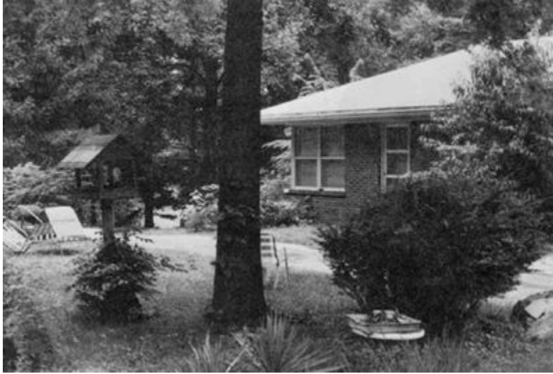
Внешний вид комнаты Ра: дверь и угловые окна комнаты, в которой с января 1981 года происходили сеансы с Ра. 9 июня 1982 года.