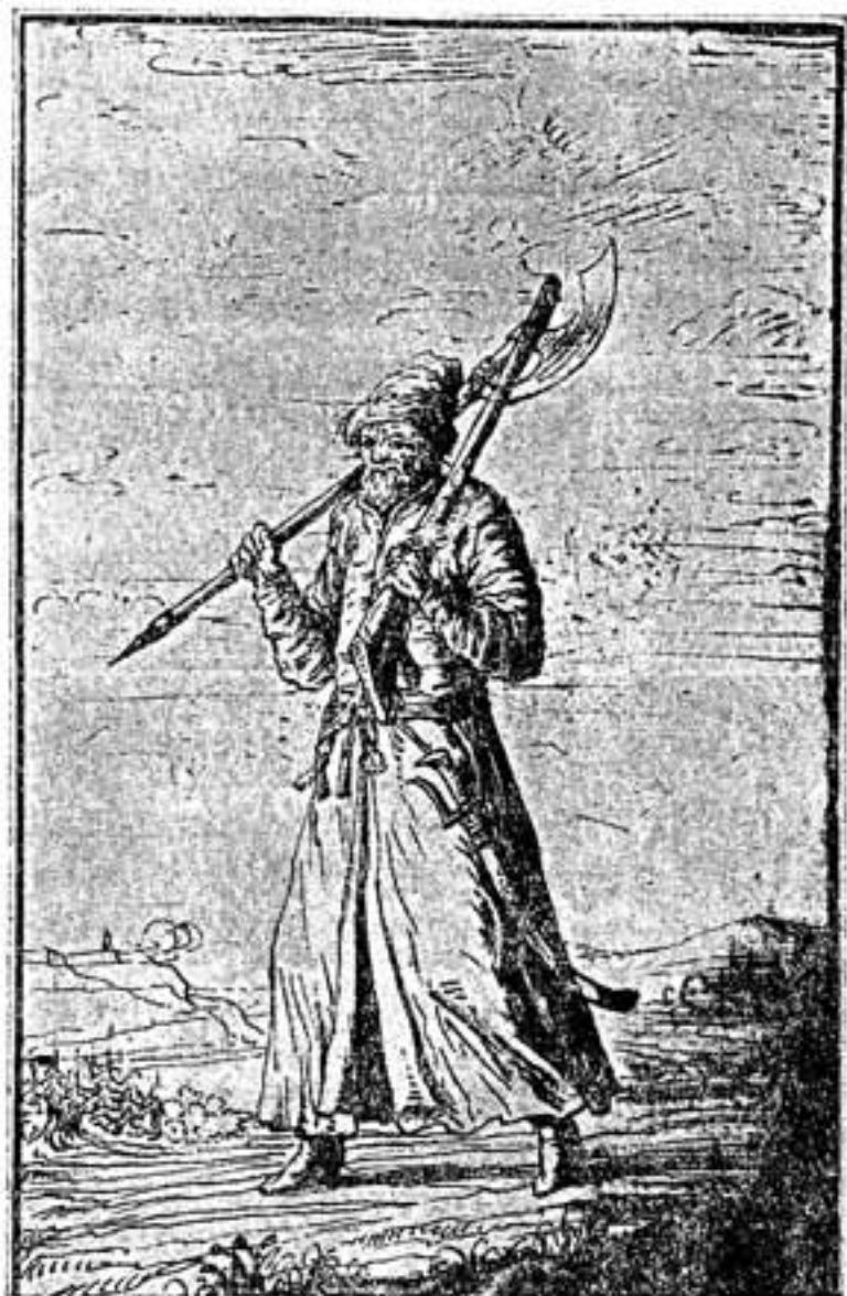
Рис. 7. Стрелец. (Зарисовка из альбома Пальмквиста).

Много позднее, рассказывая о стрельцах, Манштейн пишет: «их ближе всего можно сравнить с янычарами, они держались одинакового с ними порядка в сражении и имели почти одинаковые с ними преимущества» 36 . С другой стороны, к этому сопоставлению приходит и Крижанич, который, ориентируясь на русского читателя, называет янычар стрельцами. Я предполагаю, что основанием для этого сближения могло быть не только положение стрельцов в государстве в последний период их существования, но и тот факт, что янычары, которые были все сна-