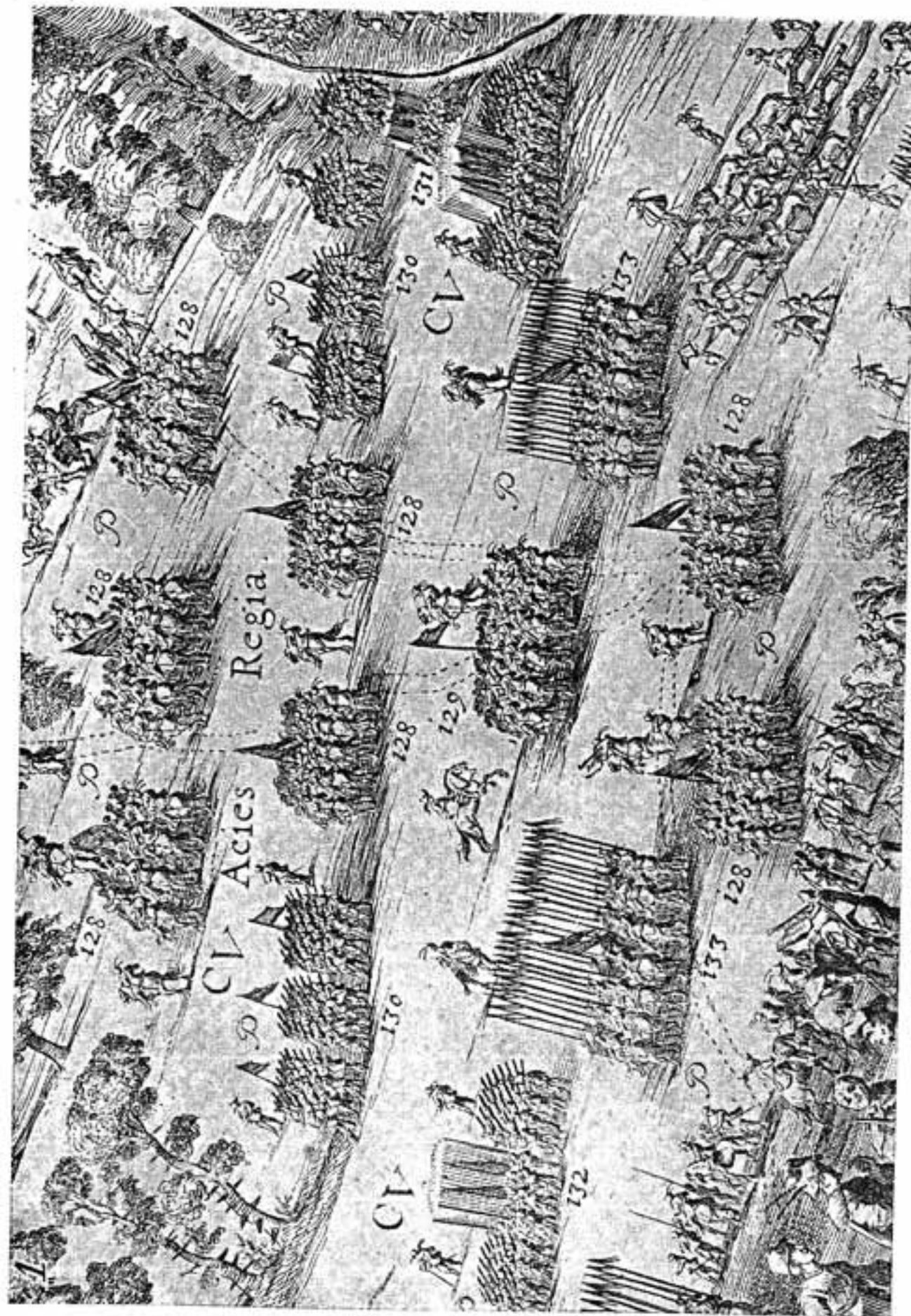
Рис. 8. Стрельцы (№ 130), дворянская конница (№№ 128, 129) и войска иноземного строя. (Рисунки на плане, гравиров. Гондиусом).

Итак, несмотря на отдельные факты отступления от норм и на использование стрельцами в некоторых случаях гранат и холодного колющего или рубящего оружия, мы можем повторить на основании сделанного обзора, что основное оружие стрельца на всем протяжении истории этого войска — это ручная пищаль, самопал или мушкет, под каким бы из этих имен оно не выступало 41 . Но это оружие само не оставалось в течение этого времени неизменным. В XVII веке происходит постепенное вытеснение мушкетов с жагрой и фитилем мушкетами с кремневым замком. Этот процесс, оставивший свои следы в источниках, но не отмеченный в литературе, не миновал и стрельцов.