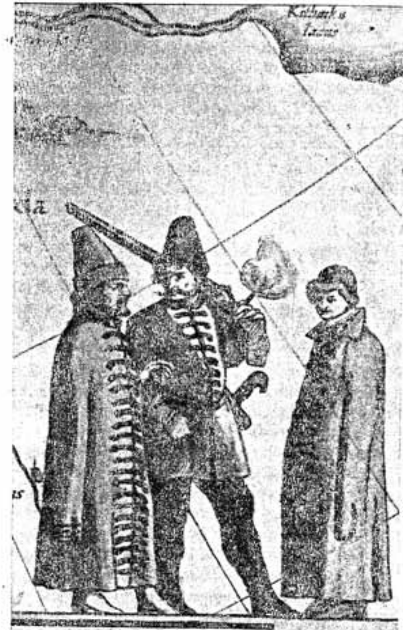
Рис. 6. Фигура стрельца (средняя из трех) с фитильным мушкетом на плече. (Изображение на карте царевича Федора Годунова).

Актный материал можно дополнить иконографическим. На многочисленных миниатюрах Никоновской летописи и Царственной книги, иллюстрирующих события 1550-х годов и начала 60-х годов, мы видим воинов с ручными пищалами, несущими на плече в походе это оружие