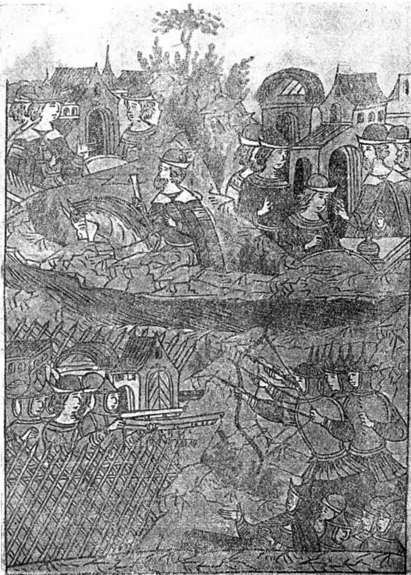
Рис. 5. Стрельцы стреляют из-за ограды из спис. (Миниатюра из Никоновской летописи).

снабженных вместо мушкетов оружием на древках. Это не основное, а вспомогательное вооружение, выдача которого вызвана определенными потребностями момента. Интересно отметить, что оно значится в припасах, оставленных в Рыльске, среди которых мушкеты вовсе не фигурируют. Подобные сведения мы имеем для того же 1679 г., т. е. времени после падения Чигирина, когда ожидалось наступление турок на Украину, и относительно припасов отправляемых туда стрелецких приказов Сем. Грибоедова, Карандеева, Дохтурова, Парасукова, Бугайского и Бренковского (два последних — сводные приказы низовых стрельцов).