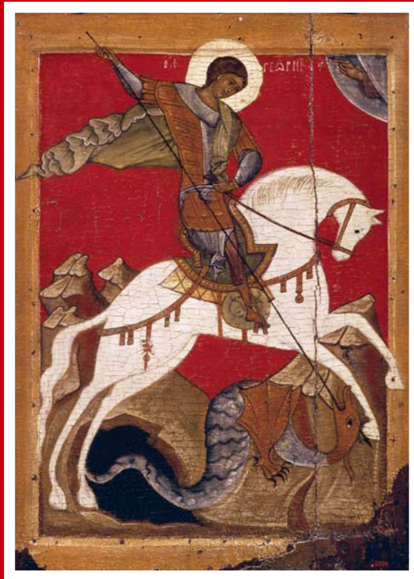
Икона святого великомученика Георгия Победоносца