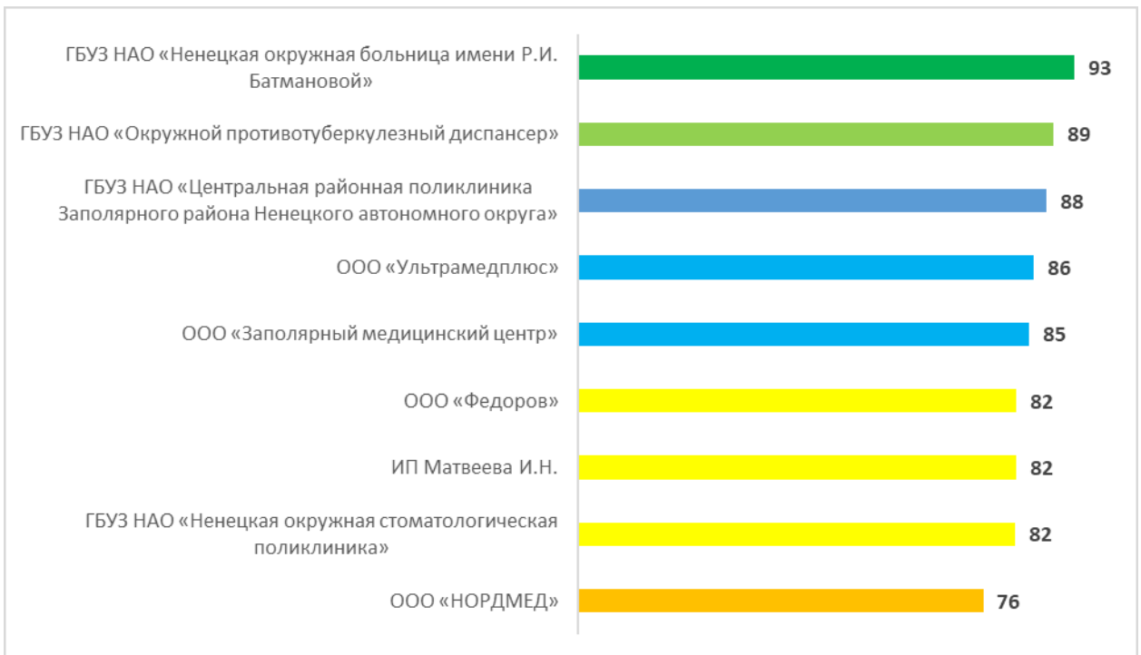
Рисунок – 5 Рейтинг организаций по критерию «Доброжелательность, вежливость работников организаций», в баллах