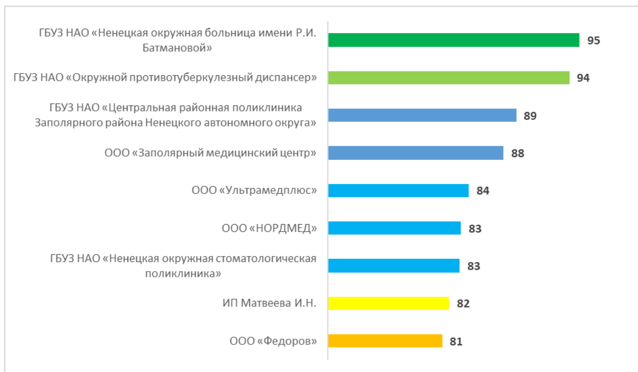
Рисунок – 1 Общий рейтинг по средней оценке медицинских организаций, в баллах