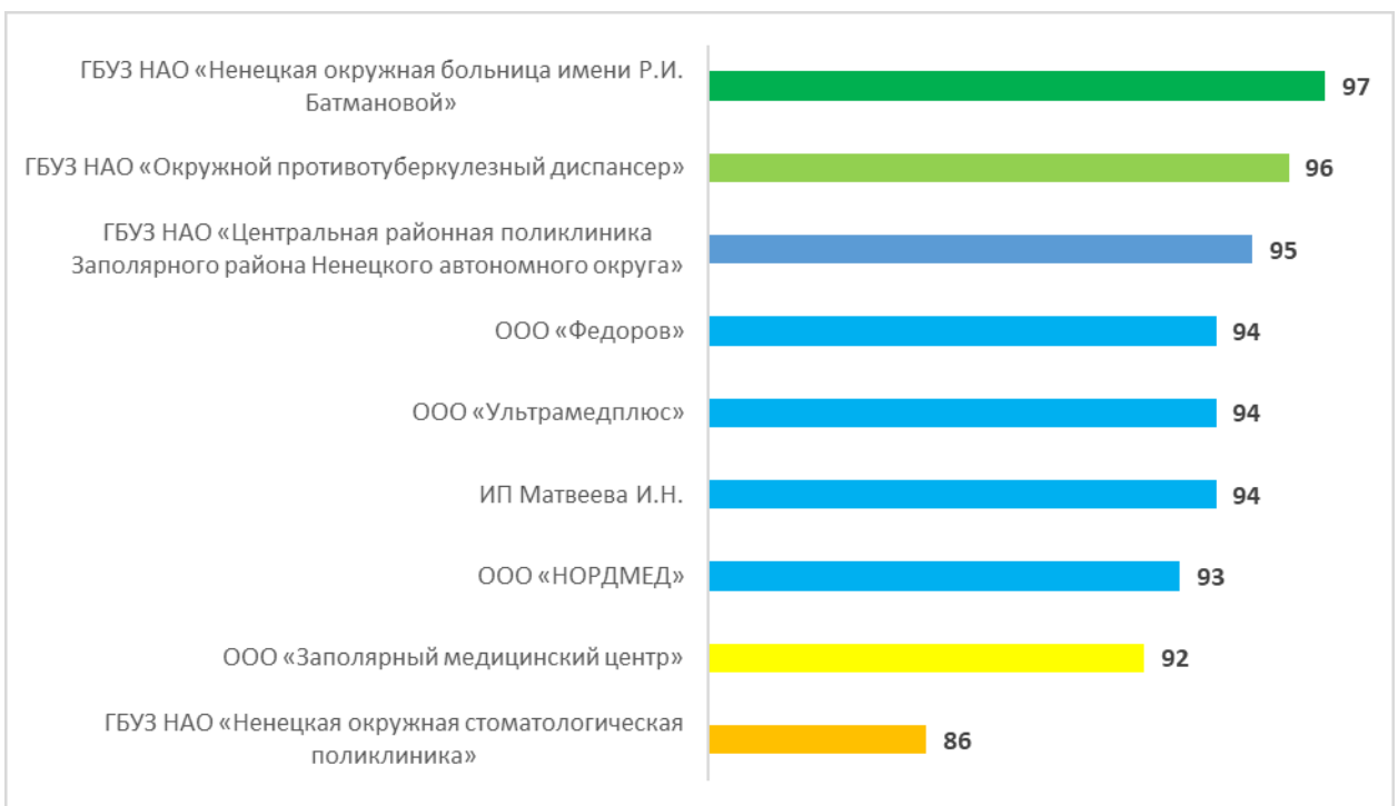
Рисунок – 3 Рейтинг организаций по критерию «Комфортность условий предоставления услуг», в баллах