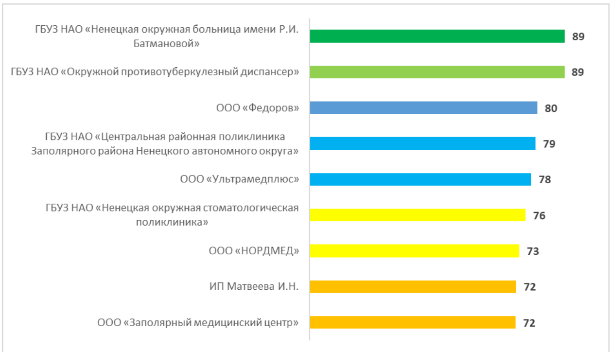
Рисунок – 6 Рейтинг организаций по критерию «Удовлетворенность условиями оказания услуг», в баллах