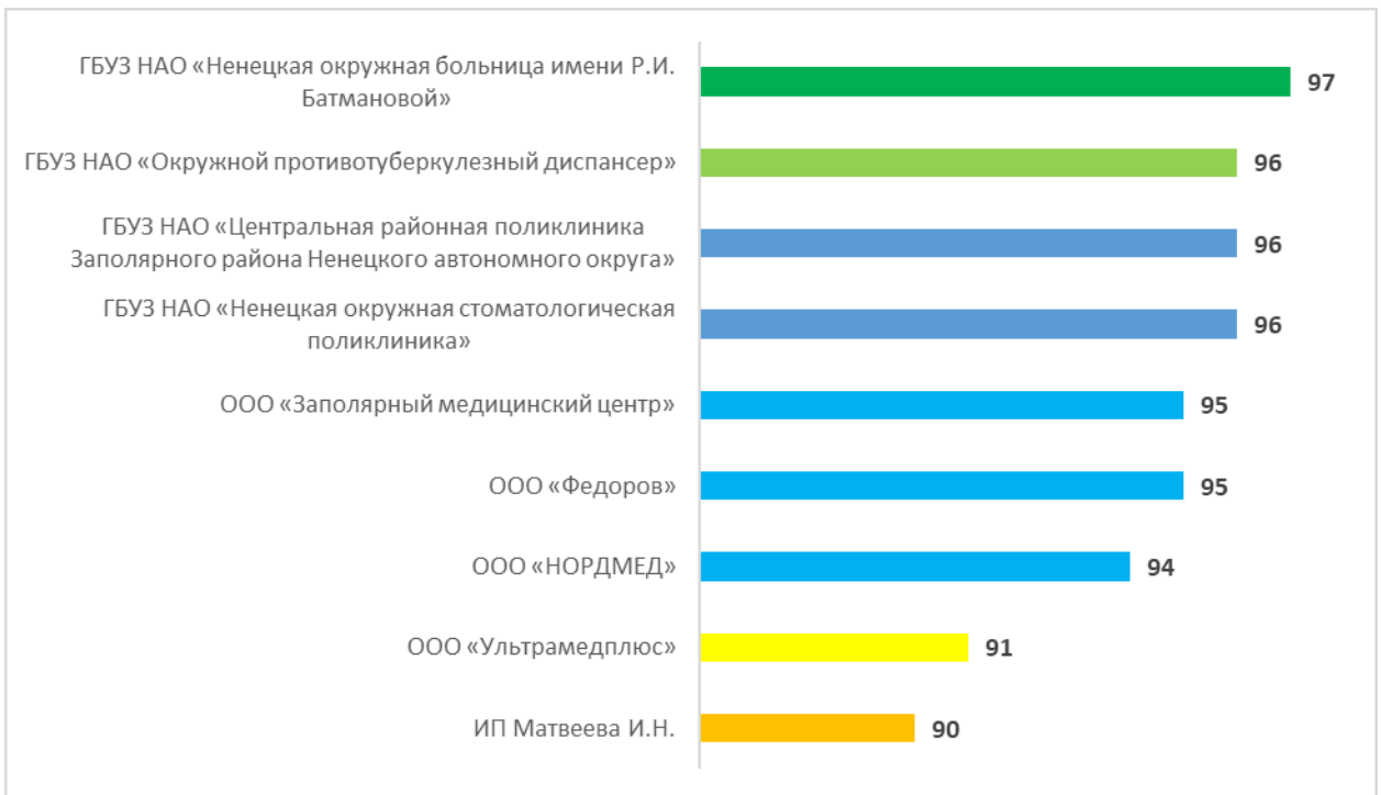
Рисунок – 2 Рейтинг организаций по критерию «Открытость и доступность информации об организации», в баллах