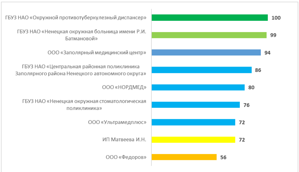
Рисунок – 4 Рейтинг организаций по критерию «Доступность услуг для инвалидов», в баллах