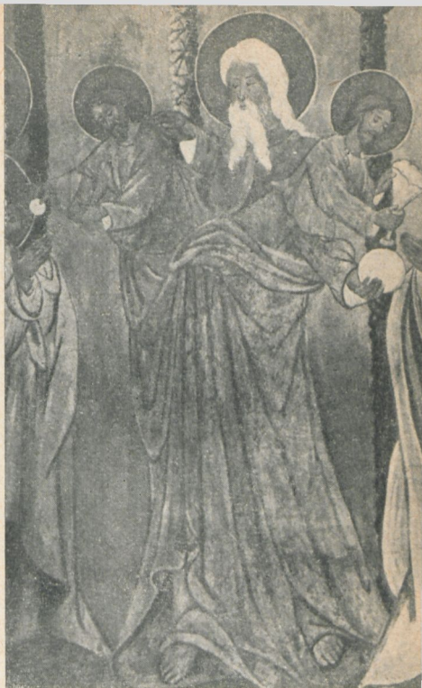
Ryc. 181. Fragment centralny „Komunii apostołów”. Malowidło na ścianie północnej prezbiterium.