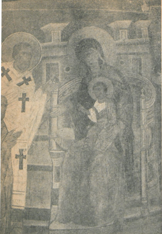
Ryc. 183. Wł. Jagiełło przed Ma-donną. Fragment malowidła na obmurowaniu klatki schodowej wiodącej na chór.