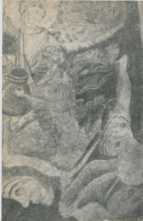
Ryc. 179. Malowidło na ścianie zachodniej nad chórem.