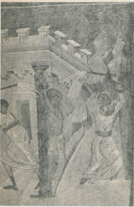
Ryc. 180. Biczowanie. Malowidło na ścianie południowej prezbiterium.

pejskiej („Komunia apostołów“). Na sklepieniu rozwija się apologia Sądu Ostatecznego i Trójcy Świętej, przeprowadzone, jak się zdaje, w nawiązaniu do tekstów liturgicznych leodyjskiego teologa Ruperta de Deutz z XII w. Jest to dodatkowy akcent, wzmacniający znajomość zachodnio-europejskiej kultury u mistrza Andrzeja, który zapewne od dawna już przebywał na terytorium polskiego państwa, stąd też zaczerpnął znajomość gotyckich realiów a częściowo i gotyzujące formy. W przejściu pod łukiem tęczowym po stronie północnej namalował on herb kasztelana lubelskiego Kmity („Szreniawa“), umieszczając nad nim stylizowaną heraldycznie postać Jagiełły na wspiętym koniu; po stronie południowej, namalował niedochowany dziś własny wizerunek, opatrując go szeroko rozbudowanym tekstem opowiadającym wykonanie dzieła.