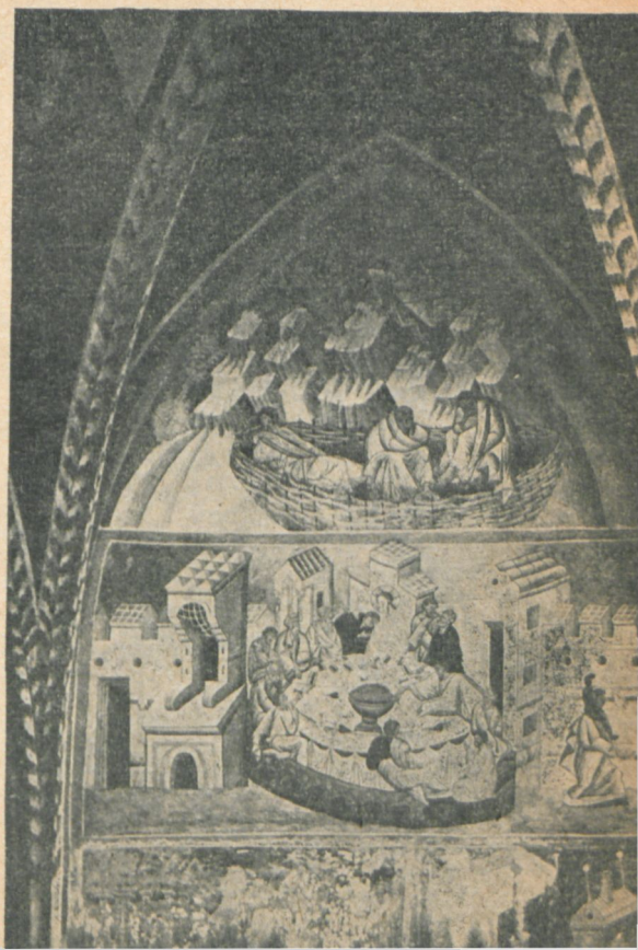
Ryc. 178. Modlitwa w Ogroju, Ostatnia Wieczerza. Malowidło na ścianie północnej prezbiterium.

A dzieło to jest istotnie niepospolite. Wyróżnić należy w nim dwa zasadnicze cykle. Cykl prezbiterium wykonany własnoręcznie przez mistrza, jak o tym świadczy jego sygnatura oraz odrębny, bardzo osobisty i jednolity styl malowideł, przejawiony zarówno w ujęciu kompozycyjnym jak i rysunku figur. Świadczy też o tym odmienna technika oraz obfitość zapożyczeń ze sztuki gotyckiej. Zasadniczym motywem jest tutaj cykl pasyjny obiegający ściany, przeprowadzony w ciągłym wątku narracyjnym. Małoformatowe kompozycje sprawiają wrażenie powiększonych miniatur uderzając dramatycznością („Cios włóczni“) bądź realizmem ujęcia („Nagrabanie się“ w otoczeniu parodystycznie pojętej kapeli); niektóre ze scen oparte zostały zapewne o doświadczenie zaczerpnięte ze sztuki zachodnio-euro-