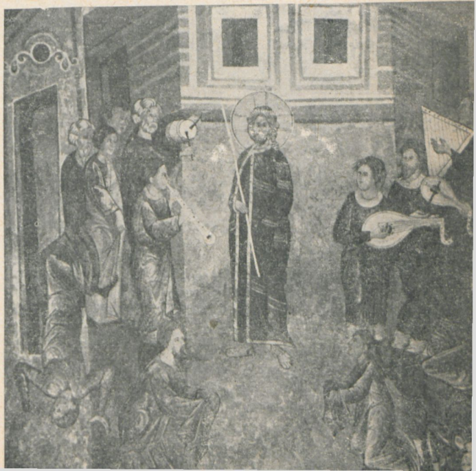
Ryc. 182. Naigrawanie się. Malowidło na ścianie południowej prezbiterium.