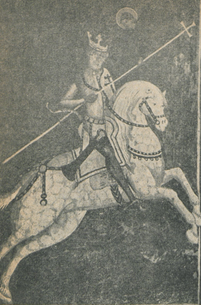
Ryc. 177. Władysław Jagiełło na koniu. Malowidło na ścianie łuku tęczowego.